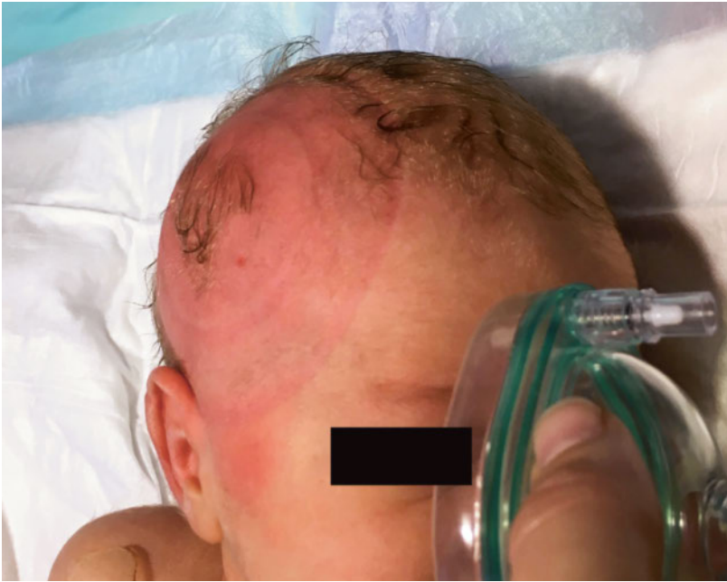
Abbildung 4: Befund direkt nach der Reposition (die Publikation erfolgt mit dem Einverständnis der Eltern).