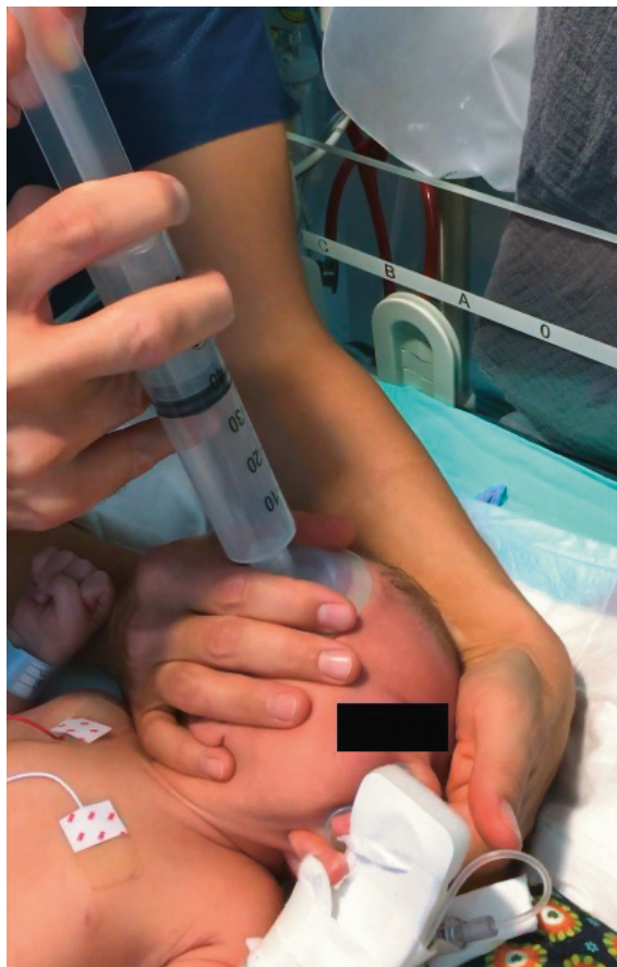
Abbildung 3: Während der Reposition mittels Beatmungs- maske und konnektierter 50-ml-Spritze (die Publikation erfolgt mit dem Einverständnis der Eltern).

bewegt haben uns das Ausmass und die Lokalisation der Impression, wobei man insbesondere bei Betrachtung des Gesichtes von vorne von einem auch später kosmetisch störenden Ausmass ausgehen musste.