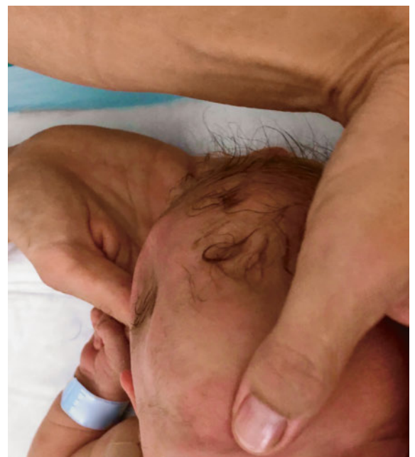
Abbildung 1: Schädelimpression rechts parietal vor der Reposition; die Haare wurden für die Reposition rasiert (die Publikation erfolgt mit dem Einverständnis der Eltern).