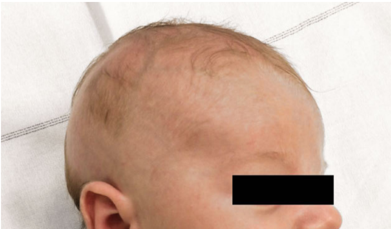
Abbildung 5: Verlauf vier Wochen nach der Reposition (die Publikation erfolgt mit dem Einverständnis der Eltern).

Anlässlich der ambulanten Verlaufskontrollen im Alter von vier Wochen und sechs Monaten konnte ein erfreulicher Verlauf verzeichnet werden (Abb. 5). Es persistierte einzig eine sehr diskrete Prominenz im Bereich der ehemaligen Impression parietal rechts im Vergleich zu links. Das Haarwachstum war symmetrisch unauffällig.