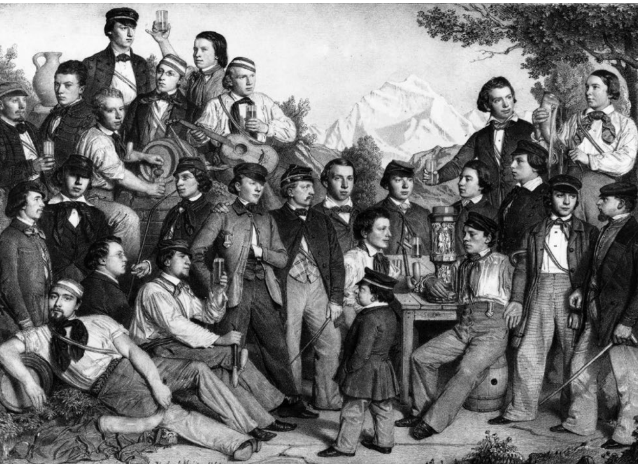
Die Helvetia Bern im Jahre 1850. Die Studentenverbindung entwickelte sich in den 1840er-Jahren zu einer Rekrutierungsbasis für die angehende politische Elite und diente der radikalen Bewegung als Kadernschmiede. Deshalb war später bisweilen die Rede vom Bundeshaus als «Curia Helvetorum» (Rathaus der Helveter) – eine Persiflage auf die offizielle Bezeichnung «Curia Confoederationis Helveticae» (Rathaus der Schweizerischen Eidgenossenschaft). – Lithografie von Hubert Meyer (geb. 1826).