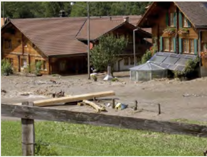
Schäden in Reichenbach, ausgelöst durch das Hochwasser

Die langanhaltenden Starkniederschläge vom 19.-23. August 2005 lösten in weiten Teilen der Schweiz Überschwemmungen aus. Sechs Menschen starben in den Wasser- und Geröllmassen. Schweizweit wurden Schäden im Wert von drei Milliarden Schweizer Franken verursacht. Mit Gesamtniederschlagssummen von 200-280 mm in 48 Stunden bzw. bis 337 mm in 72 Stunden war das Berner Oberland besonders stark von Hochwasser betroffen. In Brienz verloren zwei Menschen ihr Leben aufgrund eines Murgangs, welcher ihr Haus erfasste.