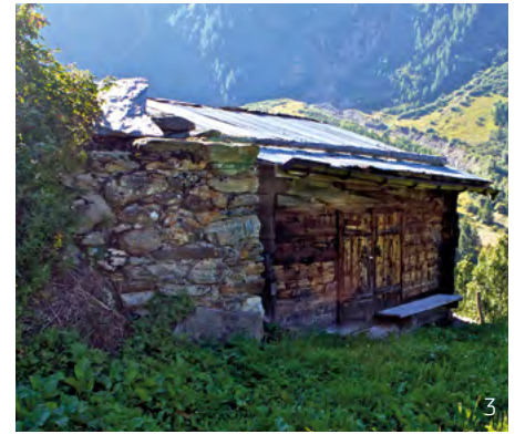
Abbildung 3: Lawinenschutz aus Fels und Stein: Gerade in engen Tälern wie dem Lötschental mussten die Bewohnerinnen und Bewohner landwirtschaftliche Gebäude teilweise in lawinengefährdeten Gebieten erbauen. Diese Stallscheune im Einzugsgebiet der «Gerynloibina» (Geryn-Lawine) wurde deshalb hinter einem Felsblock erbaut, welcher zusätzlich ummauert wurde. Im Falle des Niedergangs einer Lawine dient diese massive Rückwand als Keil, welcher die Lawine teilt. Dadurch fliesst die Lawine rechts und links am Gebäude vorbei, ohne nennenswerten Schaden anzurichten.