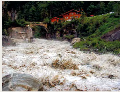
Hochwasser in der Lütschine aufgrund der Seeentleerung

Der ständige Rückzug des Unteren Grindelwaldgletschers und das Auftauen des Permafrosts führt zur Destabilisierung von Lockermaterial und Fels. So rutschen Moränen ab oder es kommt vermehrt zu grossen Felsstürzen. Das mobilisierte Material lagert sich auf der Gletscherzunge ab und das darunterliegende Eis wird vor dem Abschmelzen geschützt. An den Stellen ohne Bedeckung verliert der Gletscher aber weiterhin 5-10 Meter Höhe pro Jahr. Aufgrund dieser ungleichen Schmelzraten hat sich auf dem Unteren Grindelwaldgletscher eine Vertiefung gebildet, welche im Frühling aufgrund der Schneeschmelze mit grossen Wassermengen gefüllt wird – ein See entsteht.