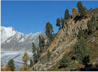
Hangrutschung mit Aletschgletscher im Hintergrund

Durch den Rückzug der Gletscher und das Auftauen des Permafrosts werden die angrenzenden Hänge destabilisiert. Auch beim Grossen Aletschgletscher ist dies der Fall: Er verlor bis Anfang der 1990er Jahre nur wenig aber konstant an Länge und Mächtigkeit. Ab 1995 beschleunigte sich dieser Prozess zunehmend – mit Folgen: Bis in die 1990er Jahre bewegte sich der angrenzende Hang Moosfluh mit einem Zentimeter pro Jahr, ab 1995 mit bis zu 30 Zentimeter pro Jahr. Im Herbst 2016 beschleunigte sich dieser Prozess drastisch: In zuvor nie gekanntem Tempo glitt die gesamte Böschung von rund einem Quadratkilometer Ausdehnung talwärts – im Herbst 2016 mit teilweise über 70 Zentimeter pro Tag. Dieses Volumen von über 200 Millionen Kubikmetern ist somit eine der grössten Rutschflächen der Schweiz.