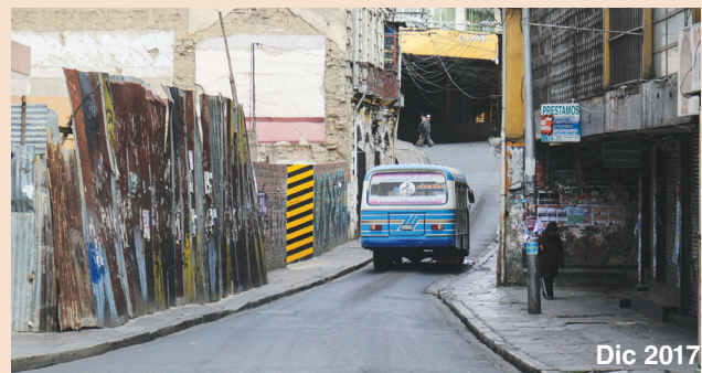
Vista de la calle Mercado, la más afectada en el centro de la ciudad.

View of Mercado street, the most affected in the center of the city.