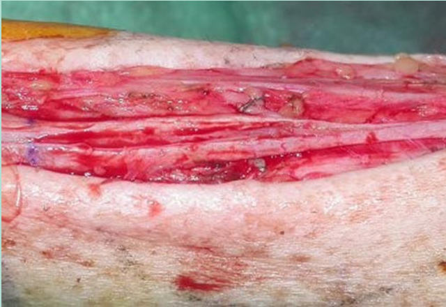
Abb. 5 ▲ Durch Venenverweilkanüle bedingte Fibrosierung einer V. cephalica am Vorderarm