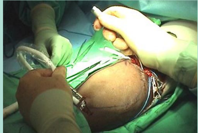
Abb. 6 ▲ Einsatz eines Kelly-Tunneliergerätes zum schonenden Durchzug einer Kunststoffprothese