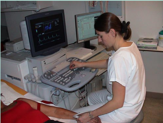
Abb. 1 ▲ Präoperative farbkodierte Duplexsonographie, optimale Venenfüllung durch Anlage einer auf 60 mmHg aufgeblasenen Blutdruckmanschette