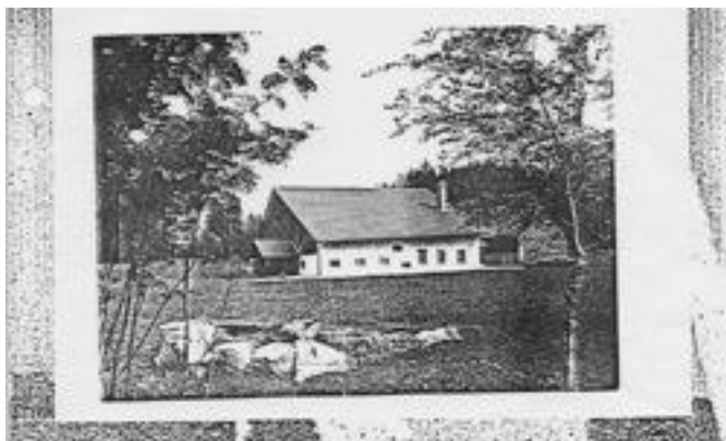
Abb. 6: Les Emibois