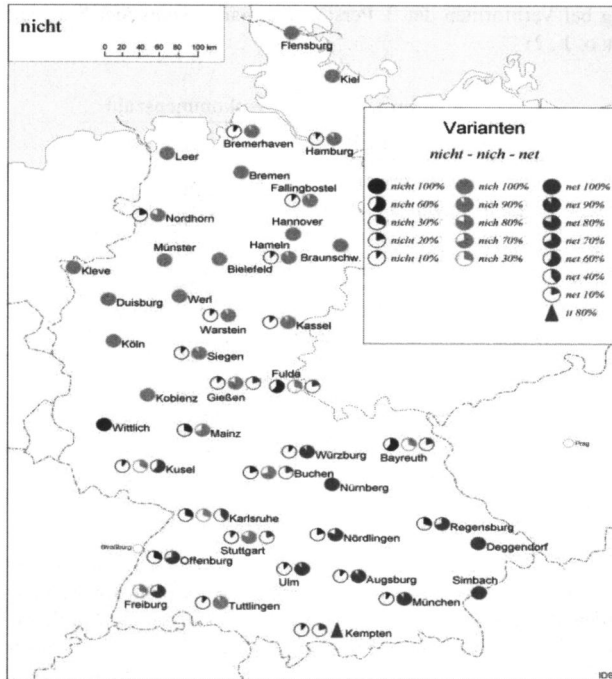
Abb. 2: Die regionalen Varianten von nicht

manchen Stellen jedoch auch eine mehr oder weniger überwiegende t -haltige standarddeutsche Form vorkommt. 3 Genau dieses Bild wird in der empirischen Untersuchung von ANDROUTSOPOULOS und ZIEGLER (2003, 267) zur Chat-Kommunikation im Raum Mannheim (Kanal #mannheim) bestätigt: 52 Prozent der von ihnen untersuchten Personen verwendeten dialektale Formen – von denjenigen, die nicht zu den Dialektformen griffen, benutzten 30 Prozent die Form nich , und nur 18 Prozent die standarddeutsche Form nicht .