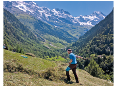
Abbildung 5: Freiwillig arbeiten für die alpine Kulturlandschaft: Landwirte und Landwirtinnen leisten mit der Sömmerung und den Arbeiten zur Offenhaltung der Weiden einen grossen Beitrag zur Pflege der alpinen Landschaften. Wenn die Arbeitsbelastung und die Kosten aber zu hoch werden und/oder die Bestossung der Alpen abnimmt, droht diesen Gebieten die Einwaldung. Eine neue Form der Unterstützung der Landwirte sind Landschaftspflegeeinsätze. So werden zum Beispiel durch Pro Natura oder das Managementzentrum UNESCO-Welterbe Swiss Alps Jungfrau-Aletsch Pflegeeinsätze im Hinteren Lauterbrunnental organisiert. Ausgeführte Arbeiten sind beispielsweise die Entbuschung von Weiden oder die Instandstellung von Wanderwegen und Trockenmauern. Bei solchen Einsätzen profitieren Landwirte, wie auch Teilnehmende: Die Teilnehmenden erhalten einen Einblick in die Herausforderungen der Bewirtschaftung und in die Natur- und Kulturlandschaft der Region. Gleichzeitig kann eine Wertschätzung gegenüber der Arbeit der Landwirte aufgebaut werden.

Das geteilschaftliche System ist in einigen Walliser Welterbe-Gemeinden bis heute erhalten geblieben (bspw. in Naters), in anderen durch die Regulierung über die Gemeinde ersetzt worden (bspw. in Ausserberg). Auch bei Letzteren blieben aber wesentliche Elemente des