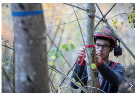
Abbildung 2: Die Verwaltung von Wäldern, Alpen und Allmenden durch die Burgerschaft Naters: Die Institution der Burgerschaft Naters kann bis ins 15. Jahrhundert nachgewiesen werden. Ihre zentrale Aufgabe ist noch heute die Verwaltung und Nutzung des Burgervermögens (Wälder, Alpen, Allmenden, heute zusätzlich auch Liegenschaften). Die Burgerschaft stellt auf der Belalp Sömmerungsrechte für Milchkühe, Galtvieh, Ziegen und Schafe zur Verfügung. So werden zum Beispiel die Milchkühe auf der Alpe Bäll in einer Senntumsstallung durch die Alppenossenschaft Bäll betreut. Die Wälder auf dem Gemeindegebiet von Naters sind grösstenteils im Besitz der Burgerschaft. Sie bildeten früher die Haupteinnahmequellen der Burgerschaften. Heute steht nicht mehr die Holzproduktion, sondern die Schutz- und Erholungsfunktionen der Wälder im Vordergrund.

Leistungen der Bergland- und Forstwirtschaft in Frage. Deshalb müssen sich die im alpinen Raum aktiven Körperschaften immer wieder mit neuen Herausforderungen, beispielweise dem Rückgang der landwirtschaftlichen Betriebe und dem damit verbundenen Rückgang von Körperschaftsmitgliedern auseinandersetzen. Als Folge davon werden Körperschaften umgestaltet, aufgelöst oder neu gegründet. In den folgenden Abschnitten wird die Bedeutung von kollektiven Körperschaften in der Welterbe-Region Jungfrau-Aletsch anhand der Ressourcen Weide, Wald und Wasser illustriert, sowie heutige Herausforderungen aufgezeigt.