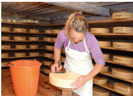
Abbildung 1: Die Taleinung in Grindelwald: Die Organisationsform der Grindelwaldner Bergschaften besteht seit dem Mittelalter und hat noch heute zum Ziel, eine geordnete und nachhaltige Bewirtschaftung der sieben Alpen der Talschaft Grindelwald umzusetzen. Ihre Rechtsgrundlage ist der Taleinungsbrief. In diesem wird festgehalten, dass jeder Bauer nur so viel Vieh auf der Mairensässtufe und auf der Alp weiden lassen darf, wie er dafür im Tal eigenes Winterfutter zur Verfügung hat. Nicht der individuelle Besitz, sondern das gemeinschaftliche Handeln und Entscheiden zeichnet die Bergschaften aus. Dazu zählen auch die alljährlich wiederkehrenden Tagwannerarbeiten, welche zur Aufrechterhaltung der landwirtschaftlichen Nutzung sowie einer attraktiven und ästhetisch wertvollen Landschaft beitragen. Jedoch stehen auch die Bergschaften unter dem Druck des Strukturwandels in der Landwirtschaft. Sie begegnen diesem auf verschiedene Arten: so wurden bereits einzelne Senntüme zusammengelegt und zum Teil Gemeinschaftsställe gebaut und eingerichtet. Andere Bergschaften investieren in bessere Infrastruktur, was zu attraktiveren Arbeitsbedingungen für das Alppersonal führt.