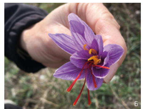
Abbildung 6: Die Tradition rund um das rote Gold: 1979 wurde in Mund die Safranzunft gegründet. Die Zunft hat zum Ziel, gemeinsam die Safrankulturen in Mund zu erhalten und gleichzeitig Kameradschaft und geselliges Beisammensein zu fördern. Es wird davon ausgegangen, dass Safran seit dem 14. Jahrhundert in Mund angebaut wird. Mit der Industrialisierung betätigten sich immer weniger Bewohner in der Landwirtschaft. Somit wurde auch die Safrankultivierung zunehmend vernachlässigt. 1998 wurde der Munder Safran als Marke geschützt und 2004 erhielt die Zunft die geschützte Ursprungsbezeichnung AOC. Der geschützte Name darf nur von Produzenten des genau definierten Gebiets genutzt werden.