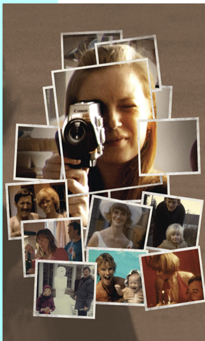
Sarah Polley: Stories We Tell (Filmposter)

self-fashioning Autoethnografie oral history embodied knowledge aging oral history embodied knowledge narración de una vida, narrating a self fluides Ich Autofiktion autobiografía narrating a self fluides Ich altro-biographie embodied knowledge aging narrating a self fluides Ich Autofiktion