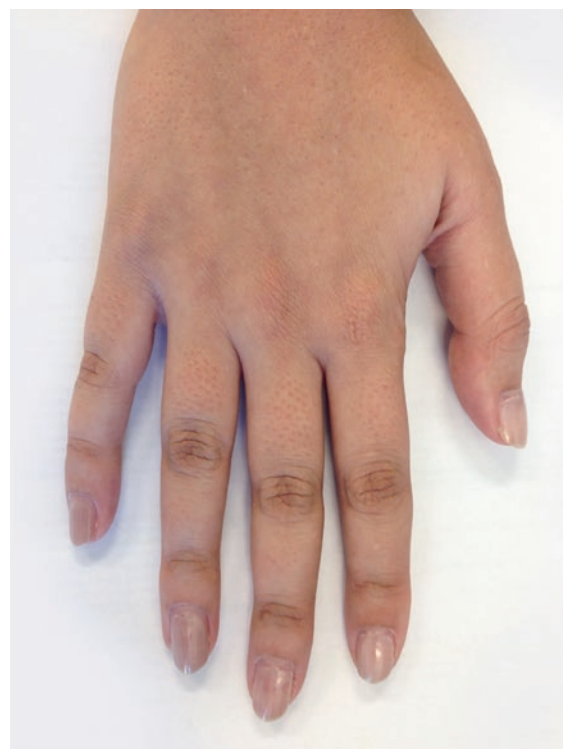
Abbildung 1: Hyperpigmentation der Fingerknöchel bei primärer Nebennierenrindeninsuffizienz.