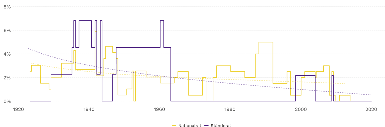
Abbildung 1: Sitzanteile von Fraktionslosen in National- und Ständerat, 1923–2019 (in Prozent)

Dabei waren die Fraktionslosen meist nicht Parteilose, sondern Angehörige von Kleinparteien. Seit 1991 können 44% von ihnen dem nationalkonservativen Rand zugeordnet werden, 37% entfielen auf Linksaussenparteien. Deutlich seltener (19%) waren fraktionslose Mittelpolitiker. Gerade den Vertreterinnen von Parteien an den linken und konservativen Rändern des Spektrums dürfte es seit den 1990er-Jahren leichter fallen, sich einer grösseren Fraktion anzuschliessen, weil die grossen Polparteien im Zug der Polarisierung selbst stärker an die Ränder gerückt sind, sich also gewissermassen den Randparteien angenähert haben.