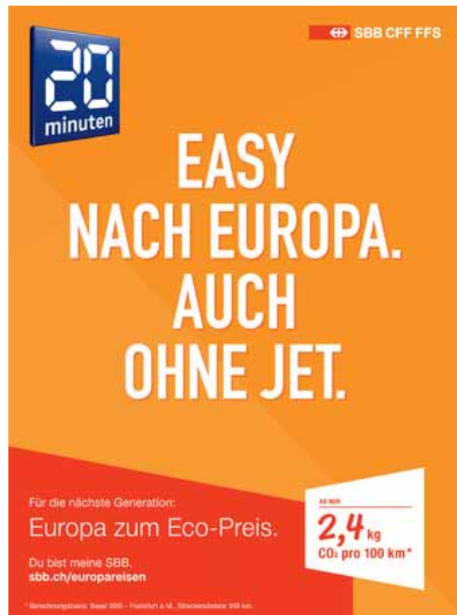
ABBILDUNG 3: Werbekampagne der Schweizerischen Bundesbahnen (SBB) 2019. Sie parodiert einen Werbefeldzug der Fluggesellschaft easyjet, der Mobilität versüßt, indem er die Naturkosten übersieht und auf einen tiefen Preis abhebt. Die SBB bewirbt umgekehrt die niedrigen CO 2 -Emissionen und denkt den im Mobilitätsframe ausgeblendeten Naturverbrauch mit. Quelle: 20 Min. 05.09.2019.

Der Frame von Verkehr ruft sinnliche Vorstellungen von Staus, Hektik und Unfällen leichter auf und kann daher warnend und abschreckend wirken, hat aber andere Einschränkungen.