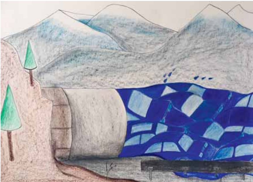
ABBILDUNG 2: Gotthardröhre. Die Illustration von Julia Weiss veranschaulicht den Verkehrsstrom.

kritischen Perspektive tut. Man kann Mobilität verfügbar machen, kaufen, verteuern etc. Ist der ökonomische Frame einmal aufgerufen, so wird unser Wissen über Wirtschaft aktiviert.