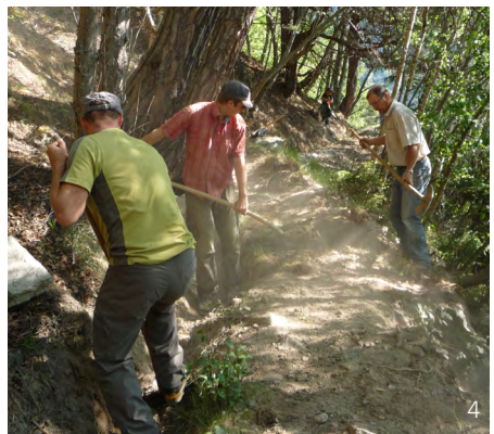
Abbildung 4: Gemeinwerk zum Unterhalt einer Suone.

Diese gemeinschaftliche Arbeit findet in der Regel im Frühjahr jedes Jahres statt und dauert 1-2 Tage («Schortage»). Beteiligt sind primär die Geteilen, teilweise aber auch Dritte.