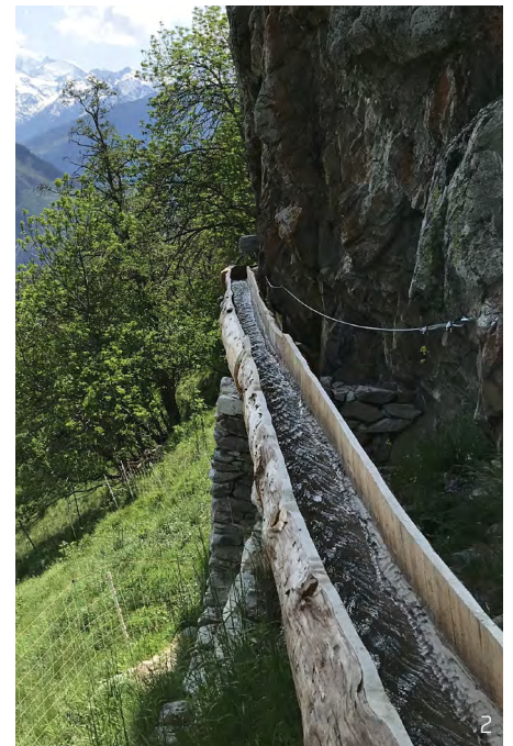
Abbildung 2: Wasserwasserleitungen werden je nach Region auch Suonen, Wasserleiten oder bisses (franz.) genannt. Das Wasser wird meist aus Bächen abgezweigt, die durch höhergelegene Quellen, Schneefelder und Gletscher gespeist werden. Über teils spektakuläre Bauten wird es in tiefere Lagen geleitet, wo es zur Bewässerung von Wiesen, Reben oder Obstkulturen genutzt wird.

Nebst ihrer primären landwirtschaftlichen Bedeutung hat die traditionelle Bewässerung vielfältige weitere Funktionen. Dank dem Bau der Wasserwasserleitungen und der Bewässerung entstand das heutige Mosaik von trockenen und feuchteren Standorten, artenreichen Heuwiesen, Waldungen und Terrassen und damit eine Vielzahl von Lebensräumen und Landschaftsqualitäten. Die Hangbewässerungslandschaften des Wallis und die vielen Suonenwanderwege sind somit für Gäste ein attraktives Wander- und Landschaftserlebnis und werden dementsprechend seit den 1980er Jahren auch vermehrt touristisch genutzt und vermarktet. Suonen bewässern zudem den Bergwald und stabilisieren dadurch die Hänge, können Wasser zur Waldbrandbekämpfung liefern und dienen durch die Regulierung