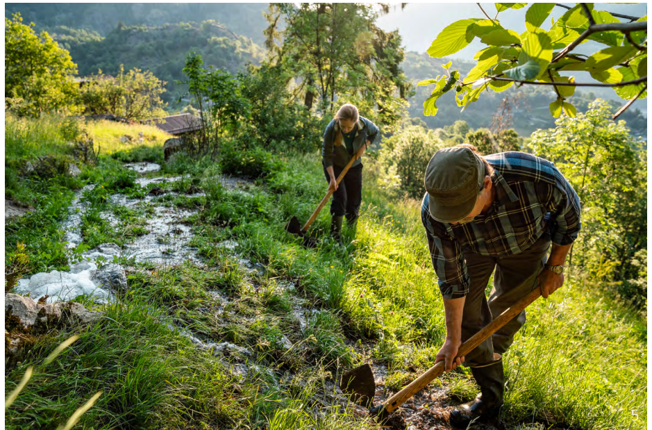
Abbildung 5: Traditionelle Hangbewässerung mit Wasserplatte und Wasserbeil. Die traditionelle Hangbewässerung ist eine aufwändige, auf grosser Erfahrung beruhende Tätigkeit, bei der der Wässerer das Wasser mittels Wasserplatten, Holzbrettern oder Steinplatten staut, lenkt und mit dem Wasserbeil über die Wiesen «zieht».