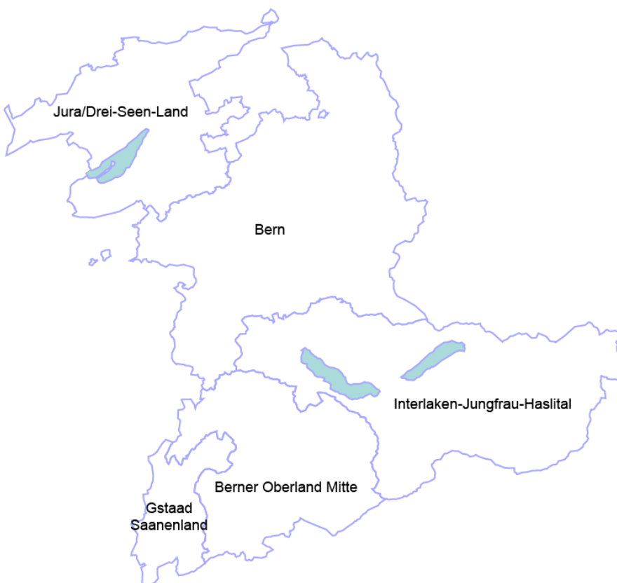
Abbildung 1: Tourismusdestinationen des Kantons Bern