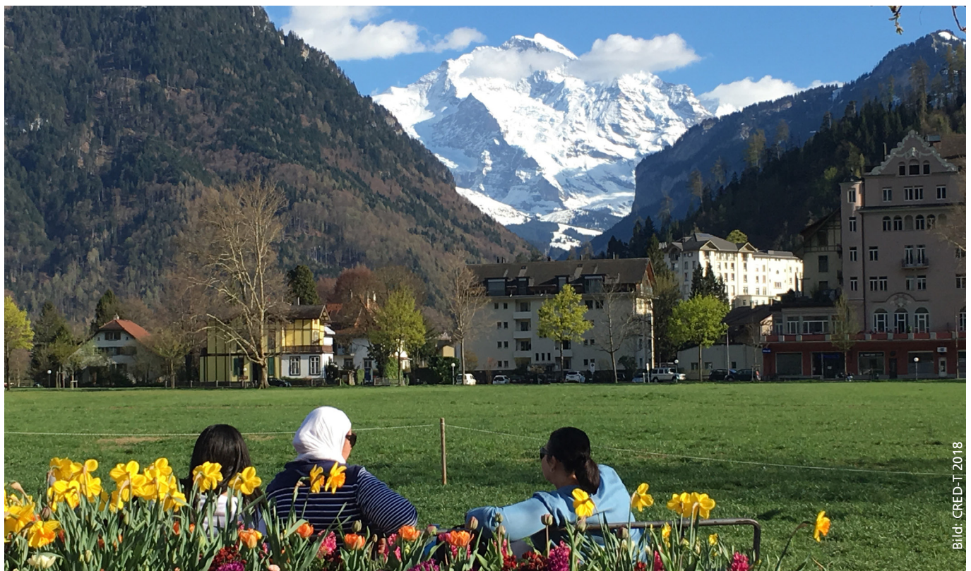
Bild: Flanierstrasse Höhematte in Interlaken mit Blick auf die Jungfrau

Interlaken erlebte in den letzten Jahren ein starkes Tourismuswachstum. Dort, wo der Tourismus wächst und wichtiger Wirtschaftszweig der Region ist, können deshalb Anzeichen von Sättigungseffekten bei der einheimischen Bevölkerung auftreten, so dass der Stärkung des Tourismusbewusstseins hohe Bedeutung zukommt. Die Tourismusorganisation Interlaken (TOI) hat deshalb die Forschungsstelle Tourismus (CRED-T) beauftragt, Chancen und Risiken des Wachstums aufzuzeigen und Strategien und Stossrichtungen zur Tourismus-Sensibilisierung und damit zur Stärkung des Tourismusbewusstseins zu erarbeiten. Nebst direkten Strategien wie der Lancierung von Kommunikationsmassnahmen, beispielsweise mittels Austausch auf Social Media Kanälen oder der Einbindung der Bevölkerung bei der Ausarbeitung von Tourismusszenarien, kommt auch der indirekten Stärkung des Tourismusbewusstseins wichtige Bedeutung zu. So kann eine gut ausgebaute touristische Infrastruktur auch für Einheimische zu einer hohen Standortattraktivität als Wohn- und Arbeitsort führen, was sich positiv auf deren Zufriedenheit auswirkt und zu mehr Toleranz gegenüber dem Tourismus führt.