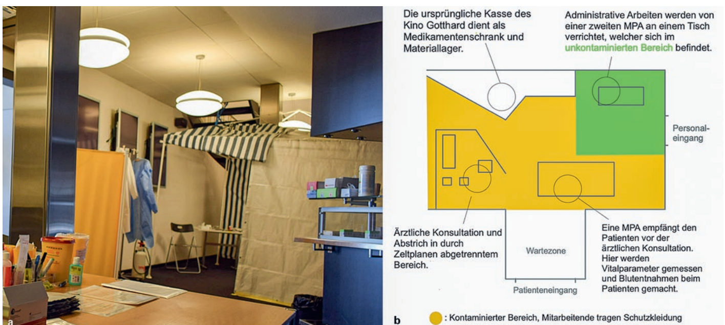
Abbildung 1: Das COVID-19-Abstrichzentrum der Praxis Bubenberg im Entrée des Kino Gotthard. a Foto, b Situationsplan.

Im Zeitraum zwischen dem 3.4.2020 und dem 11.11.2020 wurden bei allen Mitarbeitenden insgesamt fünf Blutentnahmen durchgeführt (Abb. 2a). Vor jeder Blutentnahme füllten die Teammitglieder einen Fragebogen aus, der die vier Wochen vor der ersten Blutabnahme