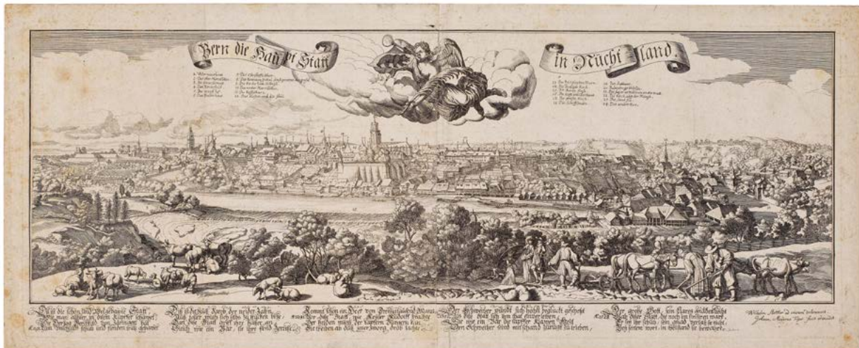
Abb. 1 Wilhelm Stettler/Johann Meyer, Bern die Haupt Stadt in Nüchtland , nach 1682, Radierung, Bild 22,9×67,2 cm, Blatt 25,7×67,9 cm, Bern, Kunstmuseum Bern, Inv. Nr. S 4716

vornehm gekleidete Familie, die Tochter hält zum Schutz gegen die Sonne einen grossen Schirm über ihren Kopf. Der Zusammenhang von städtisch-verfeinerter Lebensart und harter Arbeit auf dem Felde, er hätte augenfälliger nicht gemacht werden können. Der Text unten endet mit der Bitte, Gott möge dieser Stadt weiterhin gnädig sein, sie beschützen und «in Wohlstand sie bewahren».