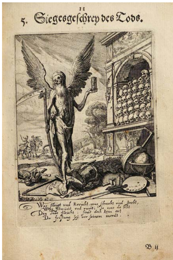
Abb. 16 Rudolf Meyer/Conrad Meyer, Siegesgeschrey des Tods , aus: Sterbenspiegel, das ist sonnen-klare Vorstellung menschlicher Nichtigkeit [...] , Zürich: Johann Jacob Bodmer 1650, 11

nander in einer Stimmung stummer, geteilter Resignation. Die Ikonografie steht eindeutig in der Folge von Darstellungen der biblischen Ruhe auf der Flucht , Rudolf Meyer intendierte wohl eine Überblendung zeitgenössischer gesellschaftlicher Aussenseiterfiguren mit der Heiligen Familie.