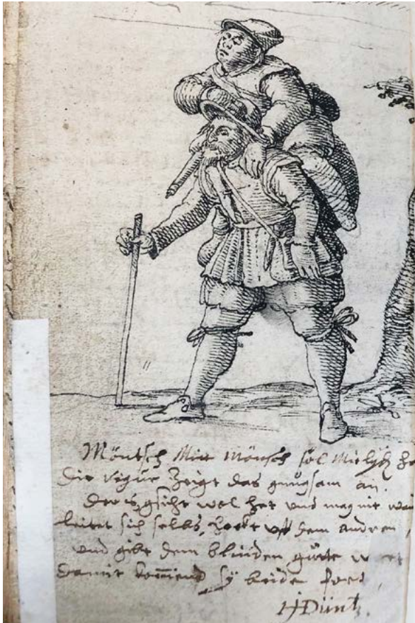
Abb. 14 Hans Jakob Düzi, Lahmer auf dem Rücken eines Blinden, Lochrödel-Zeichnung, 1643, StAB B IX 595, Einband hinten

Möntschi mit Möntschi sol Mitlyden han, Die Vigur zeigt das gnugsam an. Der's gsicht wol hat und mag nit wandren, leitet sich selbs, hockt uff dem andren, und gibt dem blinden gutte wort, damit kommend sy beide fort. 64