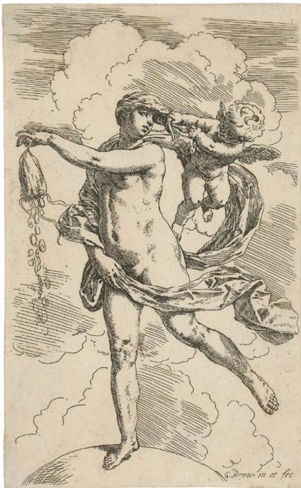
Abb. 4 Simone Cantarini, genannt Il Pesarese, nach Guido Reni, Fortuna , 1630–1648, Radierung, 23,7×14,4 cm, Hamburg, Hamburger Kunsthalle, Kupferstichkabinett, Inv. Nr. 2159

Der landwirtschaftliche Ertrag wurde im 17. Jahrhundert auch in Stilleben ausgebreitet, einer Gattung, die seit den 1630er Jahren in Bern Einzug gehalten hatte. 11 Die frühesten Berner Stilleben stammen von Joseph Plepp und waren, ihrem Format nach zu urteilen, für die Wände kleinerer Esszimmer in Stadtwohnungen bestimmt (siehe Kat.1). In der zweiten Generation schuf Albrecht Kauw für die inzwischen entstandenen repräsentativen