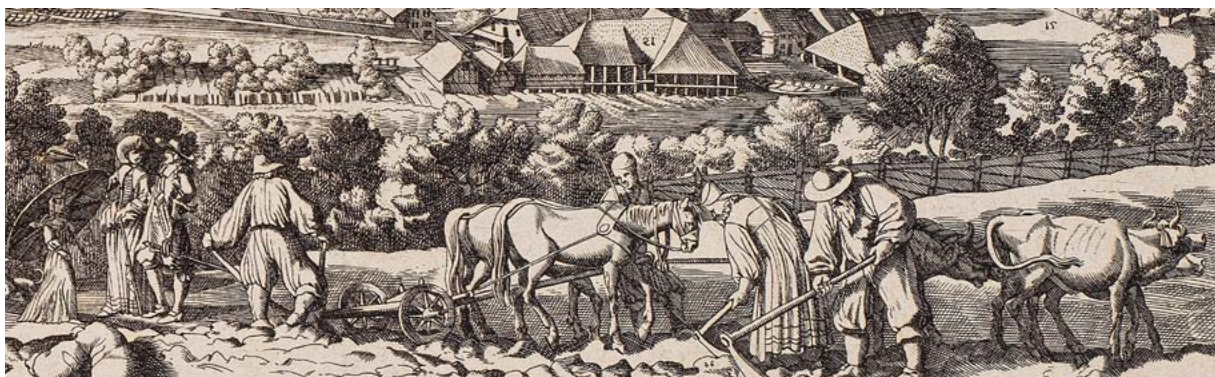
Abb. 2 Wilhelm Stettler/Johann Meyer, Bern die Haupt Stadt in Nüchtland (Detail)

Dass der Wohlstand der Stadt und Republik Bern in besonderem Masse vom Ertrag der Landwirtschaft abhing, wird auch in Joseph Werners berühmter Allegorie auf Bern von 1682 verdeutlicht (Abb. 3). Hier sitzt eine nackte Frau zu Bernas Füßen und schaut devot zu ihr auf, die Scham mit einem glänzend blauen Tuch bedeckt. Ihr geflochtenes Haar ist mit einem Blumenkranz geschmückt, sie sitzt