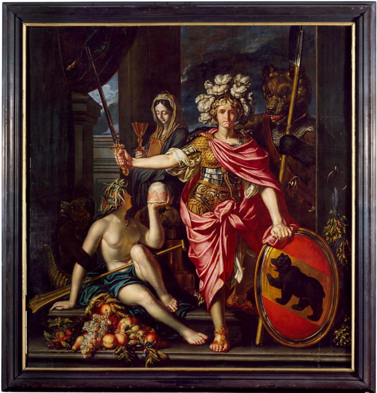
Abb. 3 Joseph Werner, Allegorie auf Bern , 1682, Öl auf Holz, 160×152 cm, Bern, Bernisches Historisches Museum