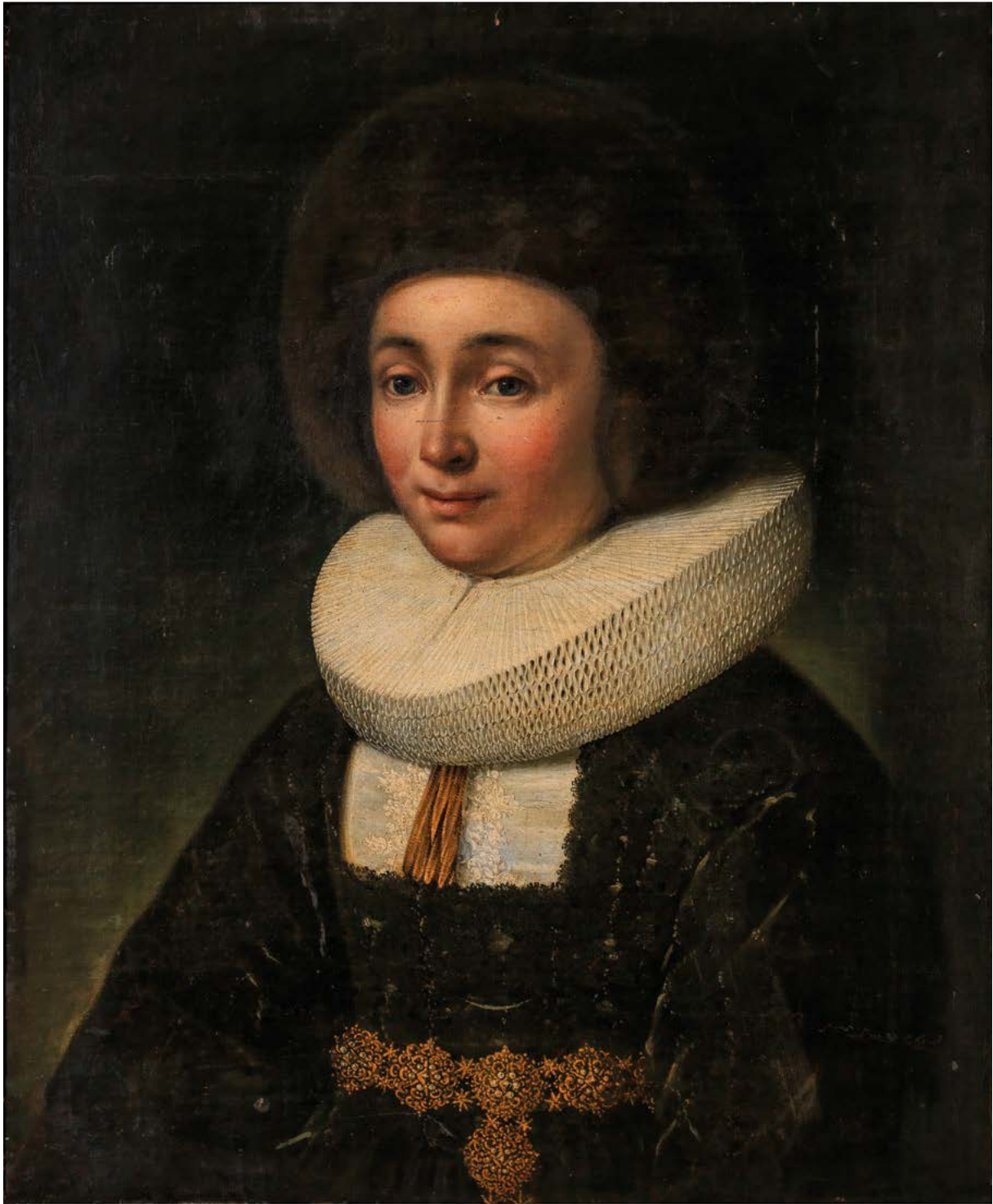
Abb. 5 Joseph Plepp, Porträt einer vornehmen Berner Dame , 1620, Öl auf Leinwand, 63×51 cm, Bern, Kunstmuseum Bern, Inv. Nr. G 0144