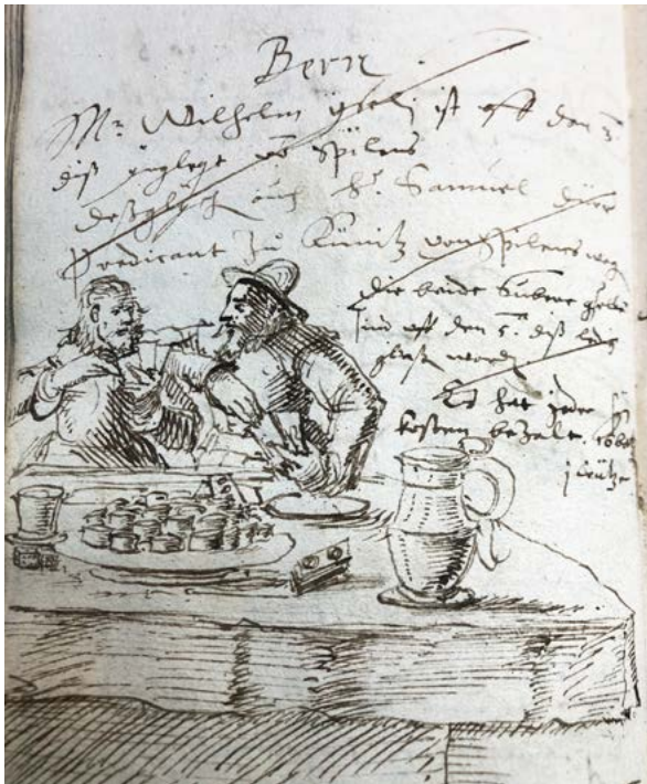
Abb. 9 Hans Jakob Dünz, Zwei Männer beim Glücksspiel , Lochrödel-Zeichnung, Dezember 1639, Bern, Staatsarchiv des Kantons Bern (StAB) B IX 595, 170

men. 46 In der Zeichnung wenden sich die beiden Männer einander zu, einer stützt den Arm auf der Schulter des anderen ab – sie beäugen sich und sind intensiv ins Kartenspiel vertieft. Auf dem Tisch sind stapelweise Münzen auf einem Teller aufgebaut, im Vordergrund liegen noch Würfel und ein Geldbündel (oder der Talon). Eine grosse Weinkaraffe steht an der Tischkante.