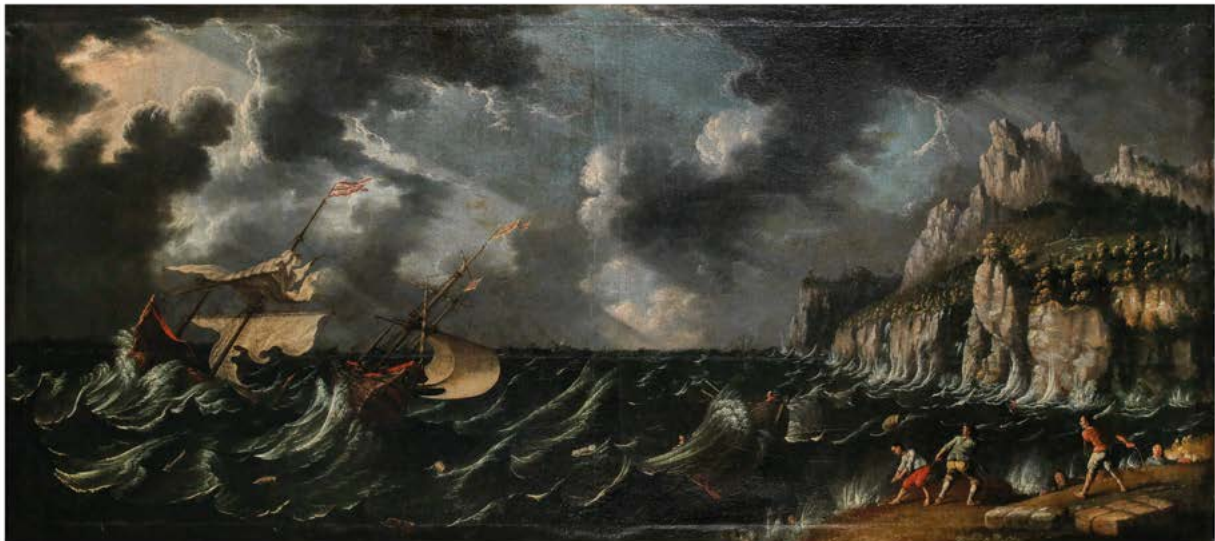
Abb. 6 Albrecht Kauw, Gefahren des Handels zu Wasser: Schiffbruch , 1671, Öl auf Leinwand, 101,5×232,5 cm, Bern, Kunstmuseum, Inv. Nr. 277

einem Handelskontor an einem fernen Hafen. Herausgeputzte Kamele und Maultiere haben diese Waren offensichtlich aus dem «Orient» an diesen Hafen transportiert, im Hintergrund liegen Schiffe zum Weitertransport bereit. Der Berner Standesläufer, der im rechten Bildvordergrund auftaucht, hat soeben einem Kaufmann ein Schriftstück überreicht, vermutlich handelt es sich um einen Auftrag der Berner Kaufhausdirektion, die den Standesläufer zum Kauf von Waren ausgesandt hat. Das zweite Bild zeigt, wovor sich alle Fernhandelskaufleute fürchteten: die Havarie zweier Handelsgaleonen in einem heftigen Seesturm (Abb. 6). In den aufgepeitschten Wellen treiben Warenballen, Fässer, Körbe und Teile der zerbrochenen Masten. Ein Boot, das vom Ufer zur Rettung der Schiffbrüchigen ausgesandt wurde, wird von einer hohen Welle erfasst und droht ebenfalls zu kentern. Auf einem Landvorsprung vorne rechts versuchen drei Männer mit einem Seil, diejenigen Seeleute zu retten, die es bis zur Kliffkante geschafft haben. Hier liegen auch zwei geborgene Warenpacken.