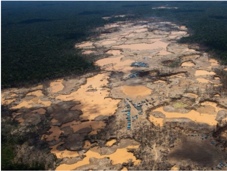
Minería ilegal en Madre de Dios, Perú.

La minería aurífera – incluyendo la deforestación y el uso de mercurio asociados – se considera la mayor amenaza a los ecosistemas naturales en Madre de Dios. Aunque la extracción de oro a pequeña escala se ha producido históricamente en la región, el incremento del precio internacional del oro tras la crisis financiera del 2008, así como la intensificación de la migración favorecida por la finalización de la carretera Interoceánica han generado un aumento substancial de esta actividad, en muchos casos ilegal o informal.