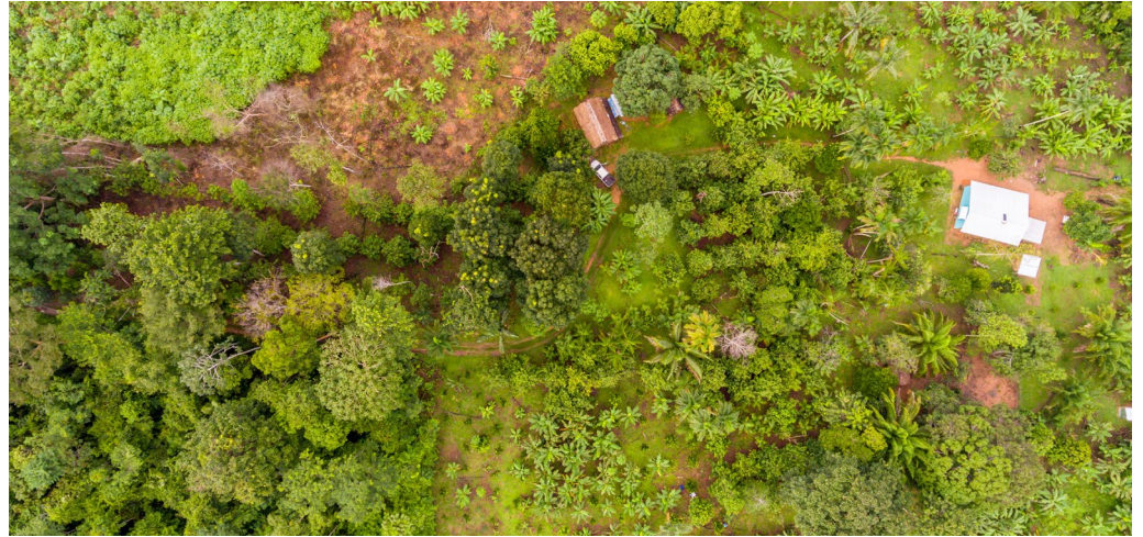
Sistema agroforestal diversificado

Madre de Dios, “Capital de la Biodiversidad del Perú”, alberga una abundante diversidad biológica. La riqueza de los recursos naturales de la región aporta múltiples contribuciones a la sociedad, incluyendo la regulación del clima, productos forestales como la castaña y oportunidades para el ecoturismo. Aunque las actividades extractivas como la minería aurífera y la tala aportan una parte importante de los medios de vida en Madre de Dios, también comprometen el desarrollo sostenible de la región. Sin embargo, existen alternativas con enfoques integrados participativos y usos múltiples que pueden armonizar el bienestar humano y la conservación de la naturaleza.