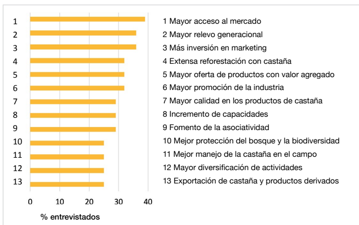
Figura 2. Características del futuro ideal del sistema castaño, desde la percepción de sus actores.