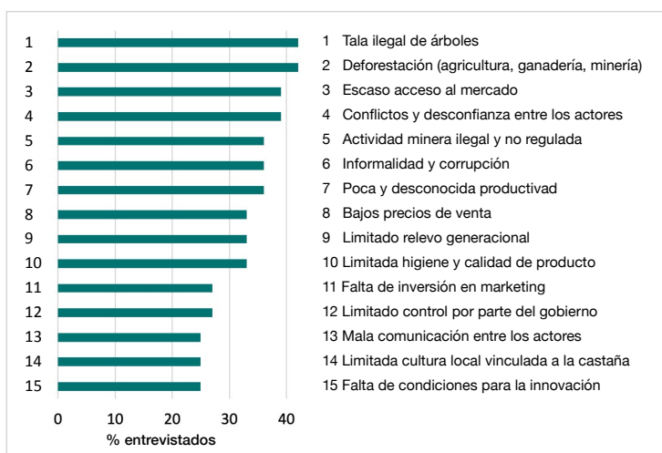
Figura 1. Desafíos de la actividad castañera, desde la percepción de sus actores.

La castaña es la única nuez comercial silvestre (es decir, que no se cultiva) y genera ingresos para el Perú de alrededor de 29 millones de dólares cada año 2 . La fluctuación de precio, que se observa todos los años, depende mucho de la oferta de los países con mayor producción como Bolivia y Brasil, quienes son responsables del principal abastecimiento de castaña para el mundo entero. Los precios fluctuantes de la castaña amazónica afectan directamente la economía local. Estos precios no siempre reflejan la inversión en la recolección y por lo general, son los concesionarios castañeros quienes asumen los riesgos de la actividad en campo y quienes obtienen menores