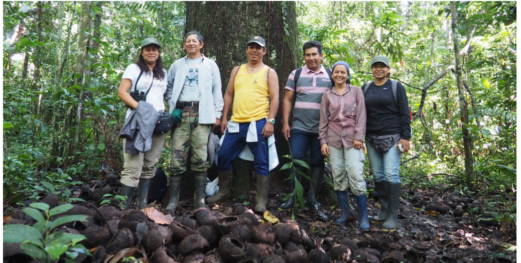
Diversos actores del sistema castañero: diseñando en conjunto acciones para la mejora de la actividad desde el castañoal.

Como la actividad castañera puede ser la herramienta para lograr el bienestar sostenible y justo para la región Madre de Dios en Perú