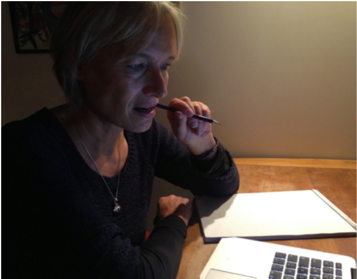
Abbildung 2. Facial feedback: Ein Grund, warum wir beim Arbeiten auf dem Bleistift kauen?

Die ursprüngliche Studie von Strack et al. hat sich als schwer replizierbar erwiesen (Wagenmakers et al. 2016). Es wurden aber weitere Hinweise auf einen möglichen Effekt des facial feedback gefunden. Psychiatrische Studien überprüften etwa den Effekt von Botox, bekannt als Faltenglätter in der Schönheitsmedizin, zur Behandlung von Depression (Wollmer et al. 2012). Der angenommene Wirkmechanismus ist, dass das injizierte Medikament die Gesichtsmuskeln, die für Stirnrunzeln als Ausdruck negativer Gedanken und Gefühle verantwortlich sind, vorübergehend lähmt, und damit in Sinne der Bidirektionalität negative Gefühle weniger wahrscheinlich machen würde. Tatsächlich konnte gezeigt werden, dass die botoxbehandelte Gruppe gegenüber einer Placebokontrollgruppe nach sechs Wochen deutlich weniger depressive Symptome aufwies. Auch wenn man die medikamentöse Depressionsbehandlung als Intervention insgesamt skeptisch betrachten mag, scheint es sich hier um einen Beleg für die facial feedback Hypothese des Embodiment zu handeln.