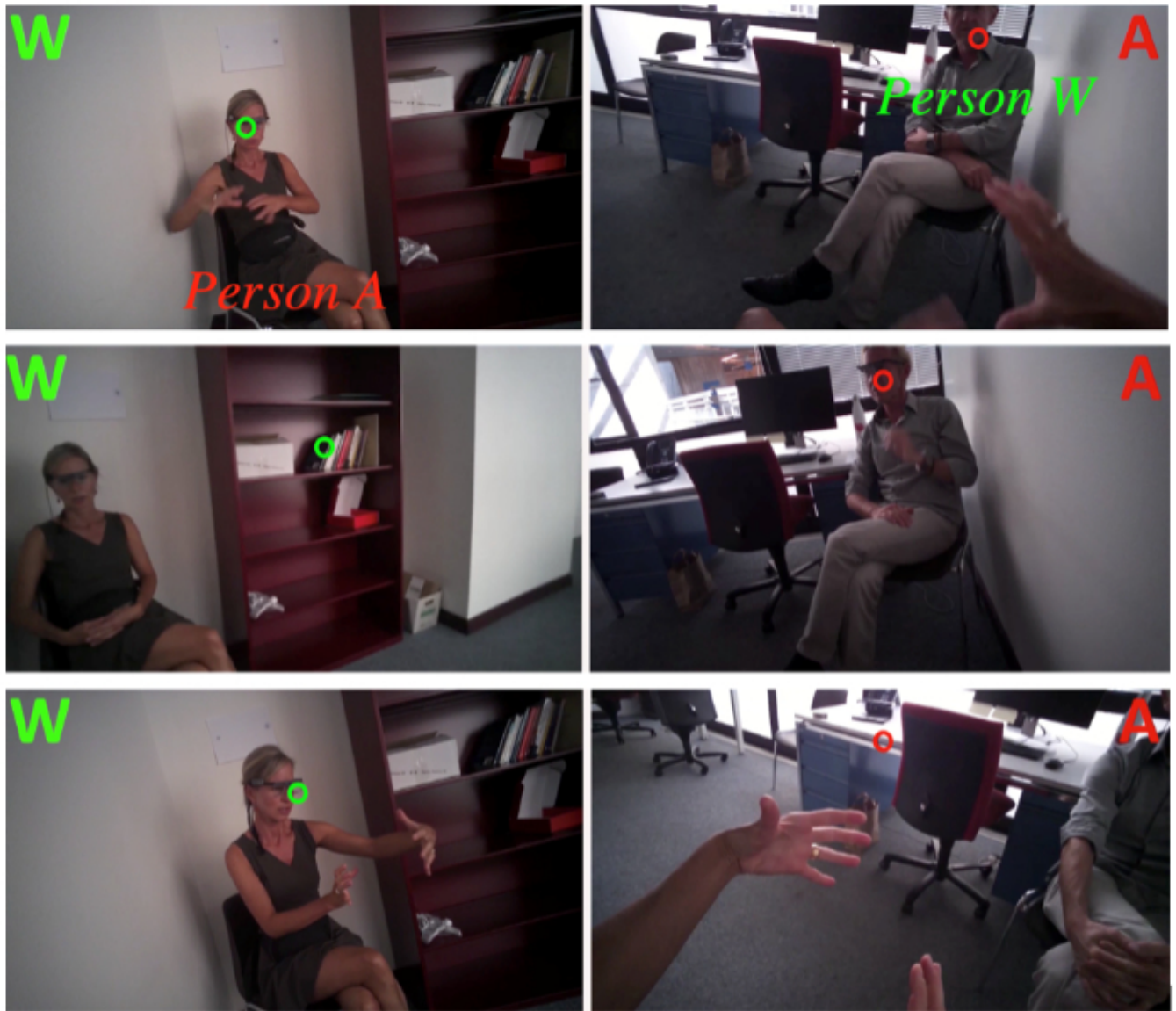
Abbildung 1. Ausschnitte aus Videos zur Augenbewegungssynchronie. Links jeweils das Blickfeld von Person W, rechts das zeitgleiche von Person A. In die Videos ist jeweils eingblendet, wohin W (grüner Kreis) und A (roter Kreis) blicken

Um Zeitreihen auf Synchronie zu testen, entwickelten wir ein statistisches Verfahren, das auf den Kreuzkorrelationen zweier Zeitreihen basiert (für Details s. Tschacher & Haken 2019). Alle Korrelationen einschliesslich der Korrelationen mit zeitlich gegeneinander versetzten Daten (hier ein lag von -3 bis +3 Sekunden) werden durch Mittelung aggregiert und ergeben ein Mass für die wechselseitige Koppelung der interagierenden Personen. Ein wichtiger weiterer Schritt ist es, die Bedeutsamkeit dieses Masses einzuschätzen, also eine Kontrollbedingung zu generieren. Hierzu verwenden wir ein Surrogatverfahren, bei dem Segmente (hier von 30 Sekunden Dauer) der Zeitreihen zufällig in ihrer Sequenz vertauscht werden. Diese Surrogatzeitreihen werden dann in gleicher Weise auf ihre (Pseudo-) Synchronie ausgewertet. Der abschliessende Schritt der Methode Surrogat-Synchronie (SUSY[1]) ist die Berechnung einer Effektstärke (Vergleich der realen Korrelation mit allen Pseudokorrelationen), die angibt, ob und wie stark die beiden Zeitreihen synchronisiert sind. In der Pilotstudie fanden wir signifikante Synchronien der Kopfbewegung und der Blickbewegungen sowie Hinweise auf synchronisierte Augenkontakte. Alle Synchronien waren in einer Art Schaukelbewegung antiphasisch, also negativ korreliert: wenn eine Person sich mehr bewegte, war ihr Gegenüber weniger bewegt; der Augenkontakt einer Person war verkoppelt mit dem Wegschauen der anderen Person.