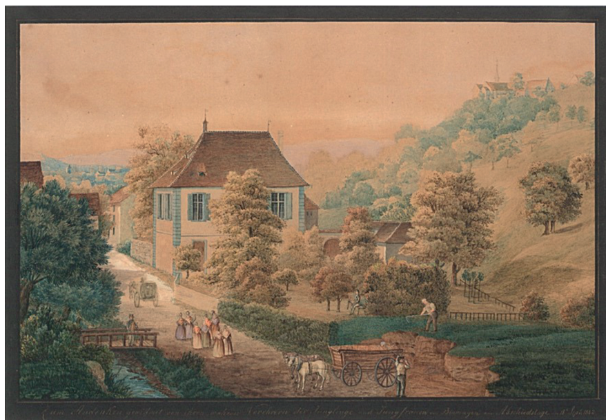
Abb. 12: Anonymus: Pfarrhaus Binningen 1842; Bildquelle: Kantonsmuseum Baselland, Liestal.