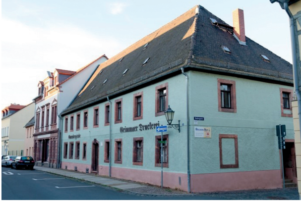
Abb. 14: Das Gebäude der Druckerei in Grimma, Frauenstraße, heute