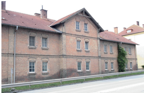
Abb. 20: Wien-Inzersdorf, Triester Straße 16–20, Arbeiterhaus vor dem Abriss 2016; Bildquelle: Karin M. Hofer.

von den Notwendigkeiten der Subsistenz bzw. der Existenz bestimmt. Die Kinder sind zuerst und primär Arbeitskräfte.