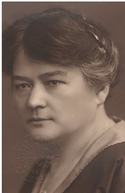
Abb. 18: Adelheid Popp, geb. Dwořak; Bildquelle: Wikimedia Commons.

den. 24 Die Taufpaten der Dwořak-Kinder sind Weber. Auch Adelheids Taufpatin ist eine Weberfrau mit böhmischen oder slowakischen Wurzeln, die nicht ihren Namen schreiben kann. 25 Sicher ist zudem, dass Adelheid Dwořak in Verhältnissen aufwächst, die man keinem Menschen wünschen möchte. Die Wiener Textilindustrie befindet sich seit Mitte der 1850er Jahre in einem schnellen Niedergang. Durch die bauliche Stadterweiterung boomt aber die Ziegelproduktion. Die Ziegelfabrik des Vororts Inzersdorf (Vösendorf) am Wienerberg ist mit Abstand die größte im Raum Wien. 26 Sie beschäftigt mehrere tausend Arbeiterinnen und Arbeiter. Vielleicht hoffte das Ehepaar Dwořak, in der Ziegelfabrik Arbeit zu finden und zog deswegen nach Inzersdorf. In dem kleinen Ort treffen zwei Welten aufeinander: auf der einen Seite ein ländliches Idyll und Ausflugsziel der Wiener Gesellschaft, auf der anderen Seite die Quartiere der schlecht beleumundeten Arbeitsmigranten. Die enorme Expansion der Ziegelfabrik wird flankiert durch den Bau billiger Arbeiterbehausungen. Alteingesessene ‚Dörfler‘ und zugezogene ‚Ziegelböhmi‘ leben in direkter Nachbarschaft und nehmen doch kaum Notiz