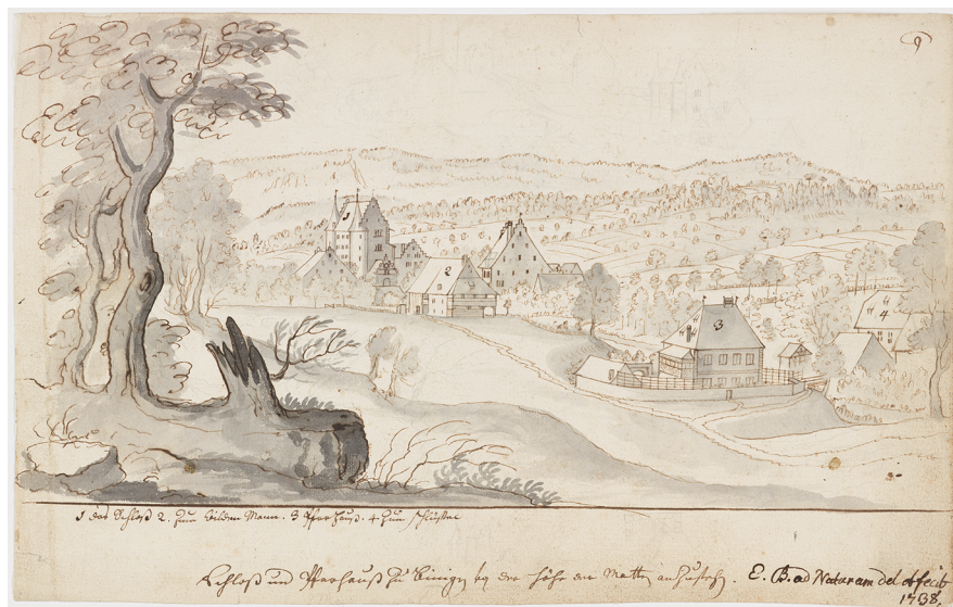
Abb. 11: Emanuel Büchel: Schloss und Pfarrhaus (Nr. 3) Binningen 1738