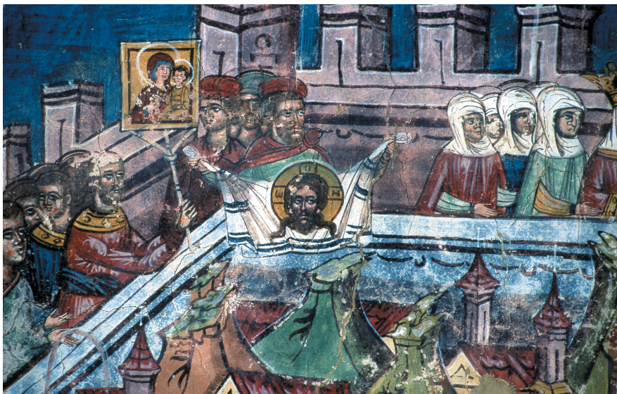
Illustration 10: Monastère de Moldovița, façade méridionale, détail de la représentation du Siège de Constantinople : le Mandylion et l'icône de la Mère de Dieu ( Hodégêtria ) en procession sur les remparts de la ville. La scène fait partie de la représentation de l'Hymne Achatiste.