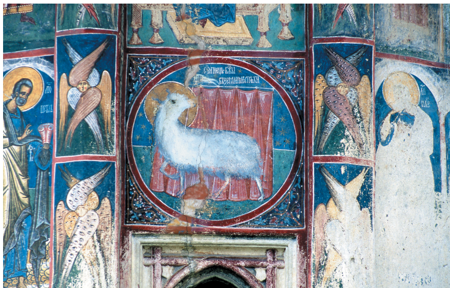
Illustration 5: Monastère de Moldovița, extérieur de l'abside du sanctuaire (détail), l'Agneau de l'Apocalypse sur fond de rideau rouge ( Mandylyon symboliquement recomposé), en médaillon au-dessus de la fenêtre axiale. Il correspond au registre des apôtres (dans la représentation de la hiérarchie ecclésiastique), dont il est séparé par des séraphins et des chérubins (de la hiérarchie céleste) figurant sur les pilastres des arcatures aveugles. Au-dessus du Mandylyon se trouve la Mère de Dieu avec l'enfant ( Hodêgêtria ).

et comme décroché de la toile, l'empreinte du visage du Christ. Ce même décrochement symbolique entre l'empreinte du visage et la toile-support se remarque à l'intérieur, où le Mandylyon est repris sur la lunette de la porte entre la nef et la chambre funéraire (espace qui sépare la nef du narthex), visible lorsque le fidèle quitte la nef et se dirige vers la sortie ; la même image, avec le même décrochement symbolique entre le « portrait » et la toile, apparaît au même endroit à Voroneț, Humor et Moldovița. Comme à l'extérieur, le Mandylyon est situé dans un lieu de passage, signalant une limite et servant en même temps de sauf-conduit, à l'instar d'un rappel et d'une prière silencieuse pour le regard et pour l'âme du fidèle qui traverse le lieu. Dans la voûte qui couronne l'embrasure de la porte, la Main de Dieu, sortant des cieux et tenant les âmes des fidèles, rappelle le même rapport paradigmatique entre l'Incarnation et l'Eschatologie qui définit ce que j'ai appelé plus haut la dialectique théologique fondatrice de l'Église. Illustration 7 (Humor).