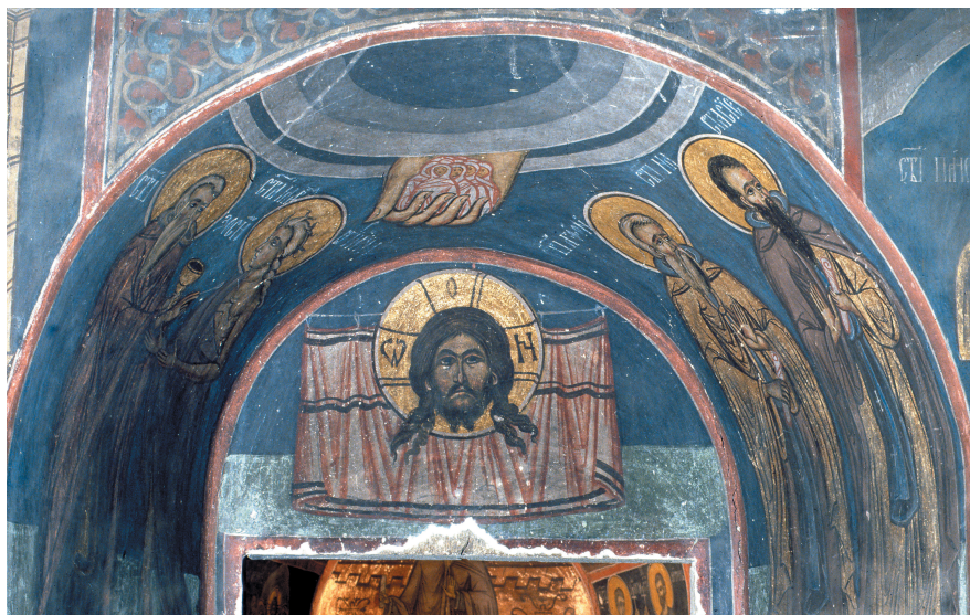
Illustration 7: Monastère de Humor, lunette du portail entre la nef et la chambre funéraire. Le Mandylyon figure du côté de la nef, entouré par des anachorètes dans les embrasures (saint Zosime et sainte Marie l'Égyptienne à gauche).

représentation. L'allusion au Voile du Temple est plus que vraisemblable dans ce contexte figuratif. 11