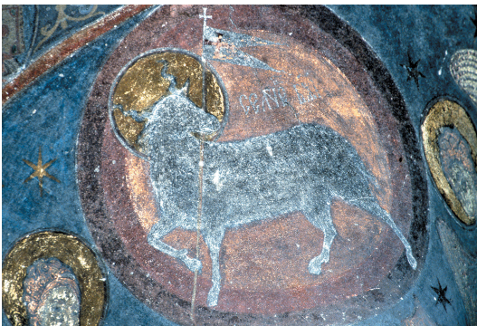
Illustration 2: Monastère de Humor, intérieur de l'abside du sanctuaire, médaillon avec l'Agneau de l'Apocalypse dans l'embrasure de la fenêtre axiale, correspondant au Mandylion à l'extérieur.

Illustration 1: Monastère de Humor, détail de l'abside du sanctuaire. Le Mandylion se trouve juste au-dessus de la fenêtre axiale et au-dessous de la Deisis (le Christ sur le trône, entouré par deux anges, ainsi que par la Mère de Dieu et par Saint Jean, eux aussi secondés par des anges). Cette représentation se trouve au centre de la vaste figuration des Hiérarchies célestes et ecclésiastiques qui embrassent l'abside du sanctuaire et les absides latérales de la nef. Le Mandylion est rangé dans le registre des saints hiérarques (évêques). La hiérarchie céleste est représentée sur le relief des pilastres et des arcatures aveugles qui rythment les trois absides. Les deux hiérarchies sont ainsi concomitantes mais détachées par le relief des arcatures et pilastres.