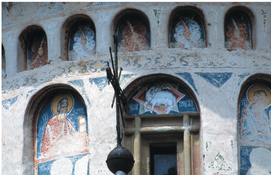
Illustration 8: Monastère de Voroneț, vue de la tour au-dessus de la nef, détail du côté méridional, l'Agneau de l'Apocalypse inscrit dans une étoile à huit pointes sur la lunette de la petite fenêtre méridionale.