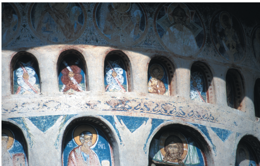
Illustration 9: Monastère de Voroneț, vue de la tour au-dessus de la nef, détail du côté Est, le Mandylion dans la lunette de la petite fenêtre axiale.