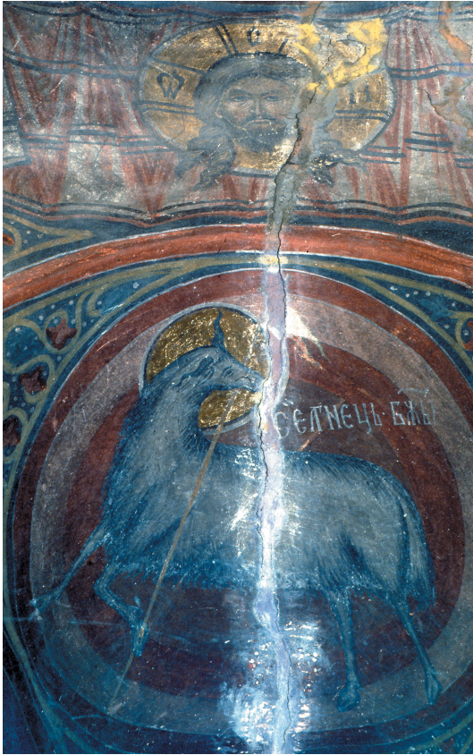
Illustration 6: Monastère de Moldovița, intérieur de l'abside du sanctuaire : le Mandylion au-dessus de la fenêtre axiale (correspondant à l'Agneau sur le rideau rouge, à l'extérieur) et l'Agneau de l'Apocalypse en médaillon dans l'embrasure de la fenêtre axiale.

lement que les autres figures dans le contexte, et d'inverser l'ordre canonique entre l'effigie et le support pour déplacer ainsi le sens de l'image du registre habituellement narratif vers une lecture plus attentive aux autres fonctions de l'image. Contrairement à la représentation qui figure à l'intérieur, le voile est ici ostensiblement étendu bien au-delà du « portrait » qu'il est censé montrer, la composition de l'ensemble insistant davantage sur le plan du voile que sur le « sceau » du visage, davantage donc sur l'objet textile recouvrant que sur le sujet proprement dit de la