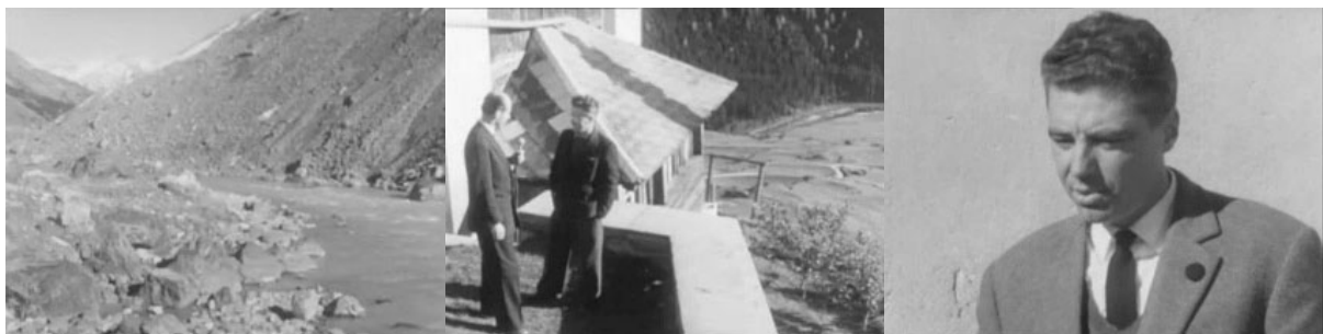
Abb. 9: Filmstills Zeitspiegel, 5. Dezember 1958: Flussbett und Geröll am Ufer – Interview mit Vertreter Lia Neira – Interview mit dem Gemeindepräsidenten.

Das Hintergrundmagazin Zeitspiegel des Schweizer Fernsehens widmete dem Spölprojekt am 5. Dezember 1958 rund 20 Minuten. 73 In der Sendung kommen Befürworter und Gegner ausführlich zur Sprache; ergänzt werden die Statements durch Landschaftsaufnahmen aus dem Engadin, dem Nationalpark und aus Livigno. Der Beitrag ist für die damalige Zeit recht lebendig gestaltet, die Interviews werden in der Natur, an einer Tankstelle, vor der Zollstation oder vor den stattlichen Hausfasaden des Gemeindehauses gedreht. Der Kommentar zu diesen Aufnahmen ist nicht erhalten, es gibt offenbar auch kein Sendeskript mehr. Die Gegner sind vertreten durch Herrn Arquint, Vorstandsmitglied der Lia Neira , und Herrn Semadeni, der die Interessen der Nationalpark-Initiative vertritt. Die Sorge gilt vor allem der ursprünglichen Nationalparkidee mit der unversehrten Natur und der Befürchtung, dass Spöl und Inn wegen der Wasserentnahmen zu kümmerlichen Rinnsalen verkommen könnten. Die Befürworter stellen dies in Abrede, wobei sich keine der beiden Seiten auf unabhängige Prognosen berufen kann. Man hat jeweils eigene Berechnungen angestellt und kommt wenig überraschend auf völlig unterschiedliche Resultate. Hauptargumente für das Kraftwerk sind die Konzessionsentschädigungen und der dadurch erhoffte wirtschaftliche Aufschwung. Das Engadin leide nämlich unter Entvölkerung und spärlichen Steuereinnahmen.