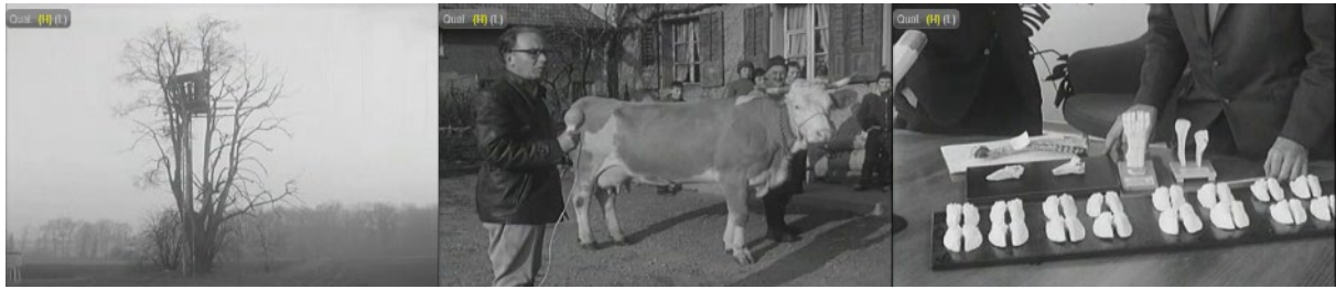
Abb. 19: Filmstills Antenne, 13. Dezember 1963: Schädigung nahe dem Werk – ein Reporter im Fricktal – ein Experte erklärt Fluorose-Formen.

Im Fricktal dauerten die Auseinandersetzungen fast bis zum Ende der Aluminiumproduktion 1991 an 128 und hatten Auswirkungen auf die ab den späten 1950er-Jahren entstehenden Produktionsbetriebe der Basler Chemiekonzerne ( Ciba Geigy in Stein 1957 und Kaisten 1971 und Roche in Sisseln 1965). Die Bevölkerung zeigte sich durch die Erfahrungen kritisch gegenüber neuen Bauvorhaben und Emissionen; zahlreiche Einsprachen verpflichteten die Betriebe zu umweltschonender Produktion und einer offeneren Informationspraxis. 129 Der Konflikt sensibilisierte die Bevölkerung, aber auch die lokale Presse für Umweltfragen, was sich bei der Besetzung des nahe gelegenen Geländes des geplanten Kernkraftwerks Kaiseraugst zeigen sollte. 130 Eine breit angelegte Untersuchung der Lebenssituation der werktätigen Bevölkerung im Fricktal wies zudem nach, dass der Widerstand gegen die Emissionen des Aluminiumwerks in Badisch Rheinfeldens das Selbstbewusstsein und die Identität der Region entscheidend gestärkt hatte. 131 Zudem war der Fricktaler Fluorkrieg einer der ersten Konflikte zur Umweltverschmutzung (beim Widerstand gegen Wasserkraftwerke spielte die Verschmutzung keine Rolle), der in breiteren Bevölkerungskreisen Widerhall fand. 132 Die Ereignisse im Fricktal beeinflussten auch einen weiteren grossen – und noch längeren – Konflikt in der Schweiz um Emissionen von Aluminiumwerken, jenen im Wallis, in den Medien zuweilen als „Aprikosenkrieg“ tituliert.