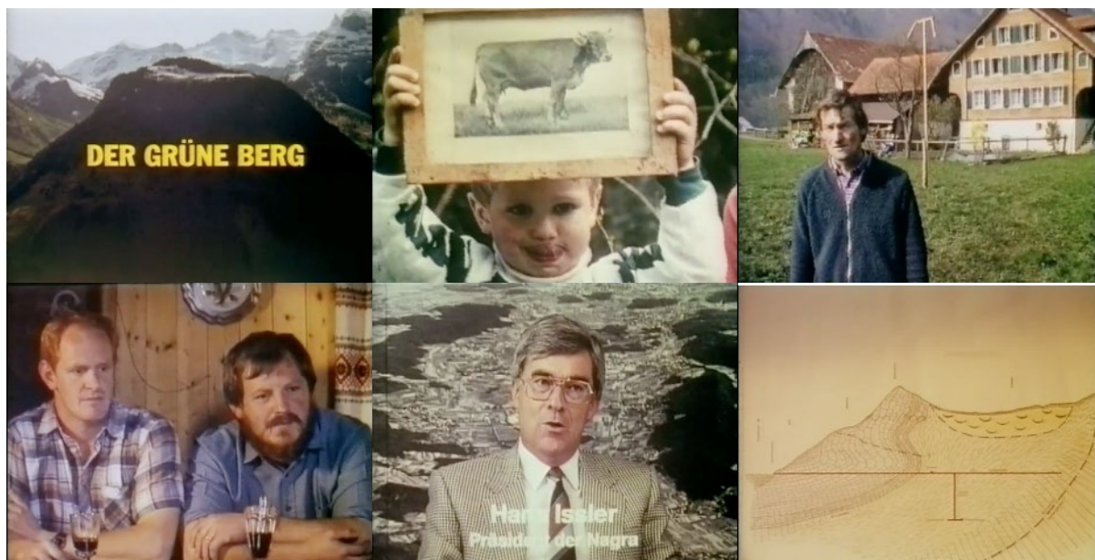
Abb. 31: Filmstills Der grüne Berg (1990): Filmanfang – zwei Stills aus der Portraitserie – Anwohner mit Fragen – der Experte – die Geologie.

Der grüne Berg startete im Frühsommer 1990 in den Kinos, gut drei Monate vor der Volksabstimmung „Stopp dem Atomkraftwerkbau – ein 10-jähriges Moratorium für neue Atomkraftwerke“ im Herbst 1990. Bei der Premiere in der vollen Mehrzweckhalle in Wolfenschiessen schienen die Sympathien klar: „Wann immer sich im Film (...) kritische Bäuerinnen und Bauern ablehnend zum Atommülllager äusserten, brandete Applaus auf. Die Kommentare der Nagra-Experten wurden dagegen meist mit Gelächter quittiert.“ 301 Der grüne Berg erhielt ein grosses, mehrheitlich positives Echo bei der Kritik. Der Tages-Anzeiger schrieb: „Ein wichtiger Beitrag zur Frage der Verantwortung von Mensch und Gesellschaft gegenüber Natur und Nachwelt, ein spannungsgeladenes Dokument in Sachen abgewirtschafteter Demokratie.“ 302 Der Kritiker der Neuen Zürcher Zeitung schätzte Murers Empathie für die „Fragen, Vorbehalte, Zweifel und Befürchtungen“ der Bauernfamilien: „Auf direkte Konfrontation und Auseinandersetzung verzichtet der (...) Film, dem an Vertiefung und nicht an Überhöhung und Zuspitzung gelegen ist.“ 303