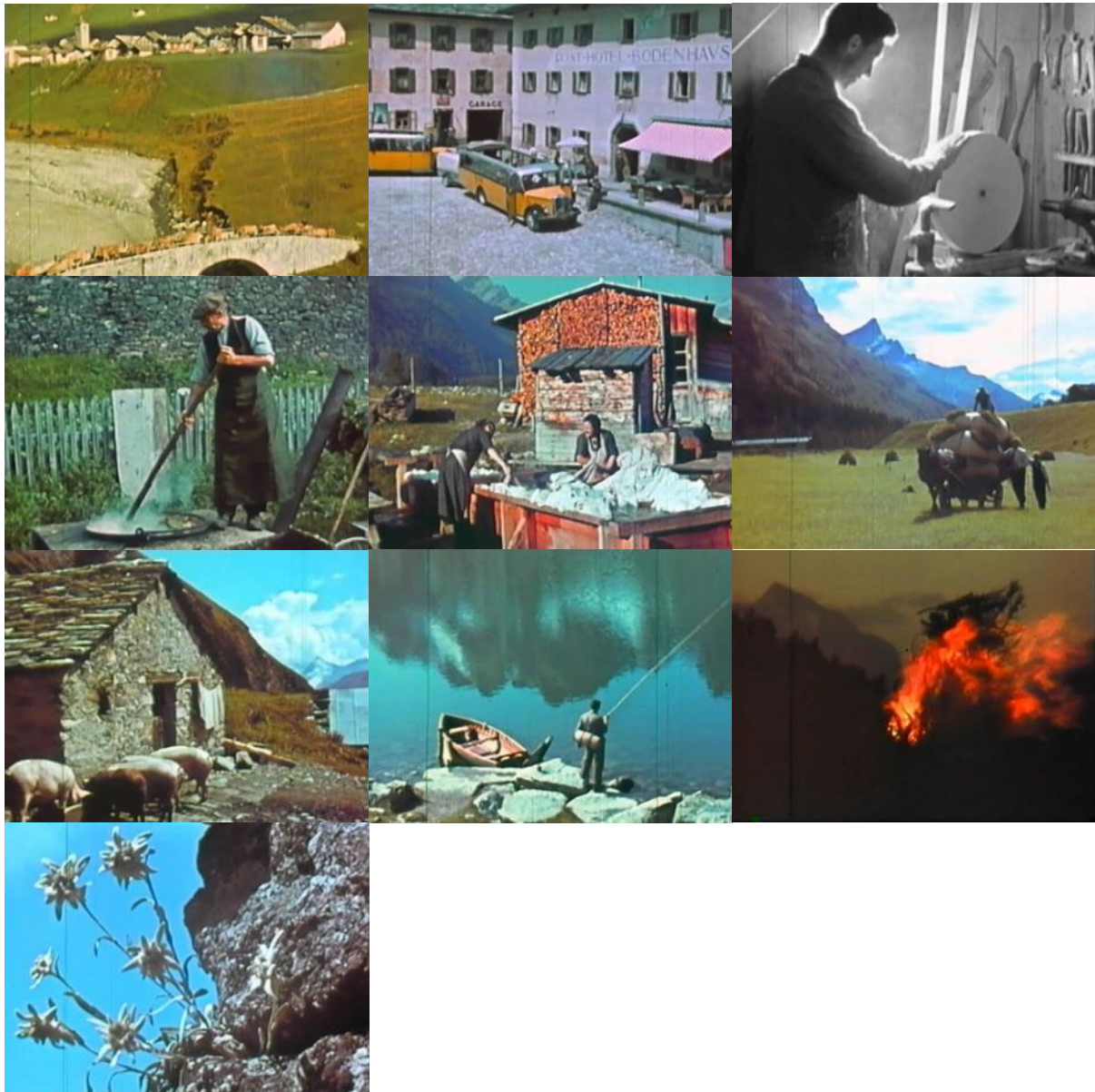
Abb. 1: Filmstills Das Tal der freien Walser (1942): Dorfansicht Splügen – Postauto auf dem Dorfplatz – Werkzeugschleifen – Verkochen von Ampfern – Grosswäsche – Heuet im Talboden – Schweine auf der Alp – Fischer am Surettasee – Höhenfeuer – Edelweiss.

Das Tal der freien Walser fügt sich nahtlos in Schochers Gesamtwerk ein. Es dominiert ein ethnografischer Zugang. Schochers Hauptinteresse gilt dem arbeitsgeprägten Alltag der Bevölkerung. Er dokumentiert Gras- und Viehwirtschaft, die weitgehende Selbstversorgung mit den Früchten aus dem Bauerngarten und den Pilzen aus dem Wald, die Erzeugnisse der lokalen Handwerker und Gewerbetreibenden. Schocher konnte dabei auf seine Erfahrungen zurückgreifen, die er als Auftragsfilmer für die Schweizerische Gesellschaft für Volkskunde (für die Reihe „Sterbendes Handwerk“) gemacht hatte 46 . Der Film portiert ein harmonisches Bild der Rheinwalder Gemeinden, deren Bevölkerung im Einklang mit der Natur ihren Tätigkeiten nachgeht. Eine zentrale Rolle spielen die Landschaftsaufnahmen. Immer wieder bezieht Schocher die Bergwelt, die Weiden, Fluss- und Bachläufe und den Talboden in seine Aufnahmen ein. Dabei entstehen lange Takes von zusammenhängenden topografischen Übersichten, die erstaunlicherweise von der kriegsbedingten Zensur nicht beanstandet wurden. Sämtliche Filme, die während der Kriegsjahre öffentlich vorgeführt wurden, mussten die Kontrolle der Filmzensurkommission der Abteilung für Presse und Funkpruch passieren. Genau das, was