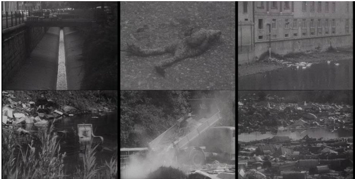
Abb. 12: Filmstills Fortschritt I – nach uns die Wüste (1966): kanalisierter Fluss – verendende Kröte auf einer Strasse – Abwassereinleitung in einen Fluss – Abfallentsorgung im Weiher (dreimal).

beim Versuch, eine befahrene Strasse zu überqueren (Minute 13:11). Als kümmerlicher Ersatz für natürliche Lebensräume werden künstliche Gartenweiher oder Naturschutzgebiete angelegt (Minute 15:16). In den letzten vier Minuten des Films dokumentiert Schlumpf verschiedene Formen von an sich illegalen Schuttablagerungen bei Weihern. Unaufhörlich laden Lastwagen Müll auf einer wilden Deponie in unmittelbarer Nachbarschaft eines Naturschutzgebietes ab (Minute 17:07). In der Schlusseinstellung entsteht der Eindruck eines komplett zugemüllten Gewässers.