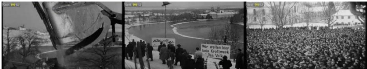
Abb. 4: Filmstills SFW, 1. Februar 1952, Rheinau Kraftwerk: Baggerschaufel – Demonstrationszug mit Transparenten und Gesslerhut – Menschenmenge im Klosterhof Rheinau.

Trotz der Proteste begannen im Januar 1952 die Bauarbeiten. Das Rheinau-Komitee beraumte kurzfristig auf den 27. Januar eine Demonstration an: 10'000 Teilnehmende forderten in einer Resolution den sofortigen Abbruch der Bauarbeiten und den Rückzug der Konzession. Erneut berichtete die Schweizer Filmwochenschau am 1. Februar 1952 – ein Novum, mied sie es doch üblicherweise, über Demonstrationen zu berichten. Der kurze Beitrag (37 Sekunden) zeigt Bagger bei den Bauarbeiten am Rhein und den Demonstrationszug mit Parolen auf dem Weg zum Klosterhof Rheinau, vorbei an einem Gesslerhut. Der Kommentar erwähnte bedauernd, dass mit dem Kraftwerkbau einer der letzten frei fliessenden Rheinabschnitte gestaut würde. „Am Sonntag, den 27. Januar haben sich trotz Kälte und Schnee über 10'000 Bürger und Bürgerinnen aus allen Bevölkerungskreisen im alten Klosterhof zu Rheinau versammelt, um einstimmig einen beschwörenden Appell zu verabschieden, der die Einstellung der Bauarbeiten und die Rücknahme der Konzession verlangt.“ 61