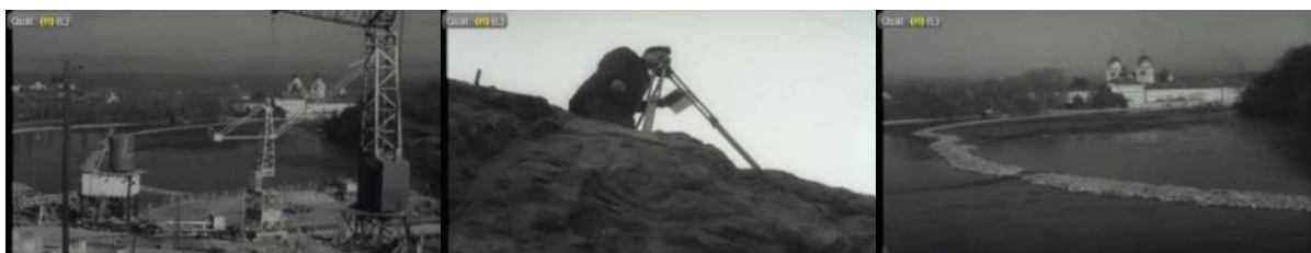
Abb. 6: Filmstills SFW, 20. November 1953: Baukran bei der Rheinau – Geometer – Stauung im Rhein.

Zum vierten und letzten Mal erschien am 20. November 1953 ein Beitrag der Schweizer Filmwochenschau mit dem Titel In Rheinau... (41 Sekunden). Es werden Aufnahmen, die 1951 entstanden, der gegenwärtigen Situation bei der Rheinau entgegengestellt. Der Bau ist nun in vollem Gang, die Schweizer Seite des Flusses ist trockengelegt. „Hier dröhnen die Baumaschinen. Die Technik entfaltet ihre Geschäftigkeit, deren stille Zeugen die alten Türme von Rheinau sind.“ 64