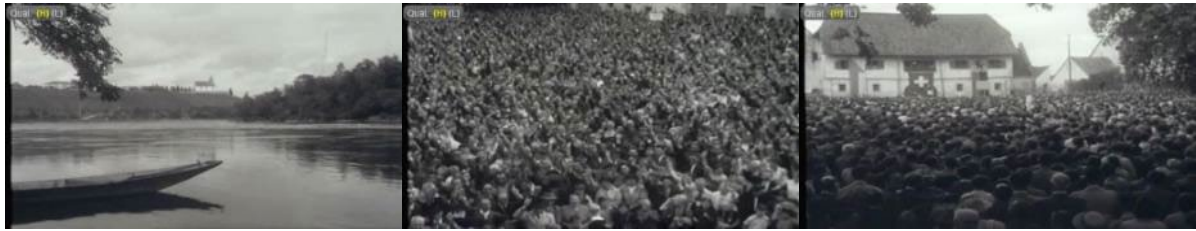
Abb. 5: Filmstills SFW, 5. September 1952: Rhein – Menschenmenge – Klosterhof Rheinau.

Zum vierten und letzten Mal erschien am 20. November 1953 ein Beitrag der Schweizer Filmwochenschau mit dem Titel In Rheinau... (41 Sekunden). Es werden Aufnahmen, die 1951 entstanden, der gegenwärtigen Situation bei der Rheinau entgegengestellt. Der Bau ist nun in vollem Gang, die Schweizer Seite des Flusses ist trockengelegt. „Hier dröhnen die Baumaschinen. Die Technik entfaltet ihre Geschäftigkeit, deren stille Zeugen die alten Türme von Rheinau sind.“ 64