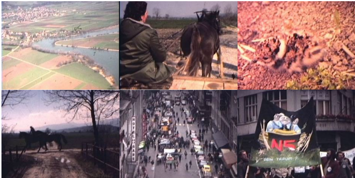
Abb. 36: Videostills Von der Kulturlandschaft zur Kulturwüste, Eine Landschaft in Gefahr – Zur Region Solothurn/Grenchen (1983): Flugaufnahme Grenchner Witi – landwirtschaftliche Nutzung – frisch geschlüpfter Vogel – Naherholungsgebiet mit Reiter – Demonstration in Biel – Transparent „N5 – dein Traum“.

Innenstadt, sie tragen Transparente gegen die N5 mit, mehrere Musikgruppen sind zu sehen, Ballone und Süßigkeiten werden an Kinder verteilt (Minute 12:55). Am Schluss wird ein Feuer entfacht (Minute 20:02).