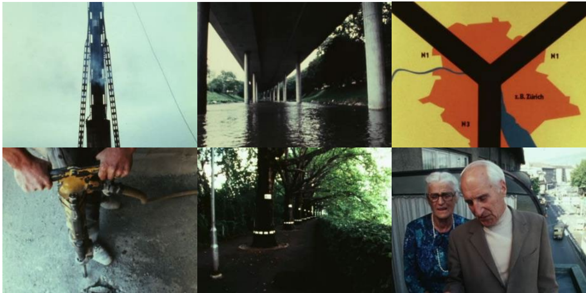
Abb. 33: Filmstills Betonfluss (1974): Dampftramme sorgt für permanent hohen Geräuschpegel – der bereits gebaute Ast der Sihlhochstrasse – Karte städtische Expressstrassen (Y) – Presslufthammer – markierte Bäume am Sihlufer – Interview mit einem Rentnerpaar an der Manessestrasse.