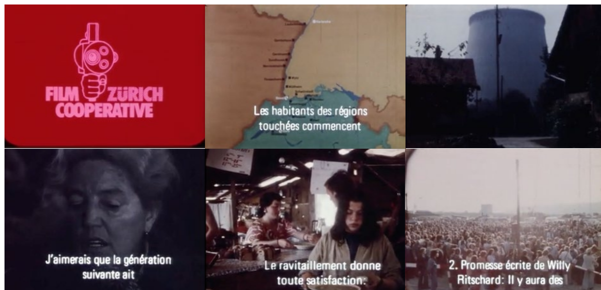
Abb. 27: Filmstills Kaiseraugst (1975): Logo der Filmcooperative – Geplante A-Werke am Oberrhein – Werk Gös- gen im Bau – Besetzerinnen (zweimal) – die Vollversammlung am 7. Juni beschliesst den Abbruch der Besetzung.