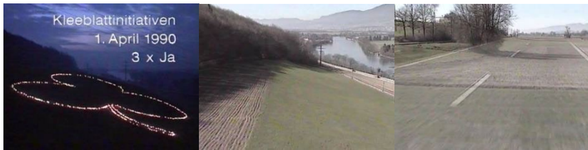
Abb. 38: Videostills Kleeblattinitiativen 1. April 1990 3x Ja (1990): Logo des Abstimmungskampfes mit Fackeln – Flugaufnahme des geplanten Trassees – Overlay Fahrbahn auf Wiese.

Im Vorfeld der Abstimmung über die Kleeblatt-Initiative kam übrigens auch eine Kurzversion von Mit 120 durchs Säuliamt als Werbespot in die Kinos. 351 Die Jungen Säuliamtler kombinierten einen einminütigen Ausschnitt aus dem ursprünglichen Video mit einer Aktion, in der vier in weisse Overalls gekleidete Aktivisten auf das Dach eines Bauernhauses mit weisser Farbe ein Kleeblatt mit dem Slogan „Ja“ pinseln. Eingebildet wird: „Damit unsere Kinder solche Landschaften nicht nur aus dem Film kennen.“