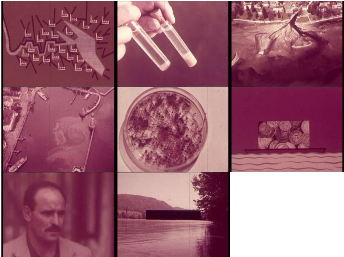
Abb. 39: Filmstills welche zukunft hat begonnen [...] (1964): Fabrikenboom am Bodensee – verunreinigtes Bodenseewasser – Abwassereinleitung in den See – Öllachen in einem Hafen – Vermehrung der falschen Mikroorganismen in verunreinigten Sedimentproben – finanziell nicht lukrativer Transport auf dem Fluss – der „Südländer“ – mit Zensurbalken belegte, bedrohte Holzbrücke bei Diessenhofen.

welche zukunft hat begonnen [...] argumentiert ambivalent. Es dominiert zwar die ästhetische Kritik mit ihrem Festhalten an Naturwundern, Landschaftsidylle und städtebaulichen Preziosen. In die Blauäugigkeit, was die Umweltverträglichkeit der zur Disposition stehenden Energieträger und die positive Einstellung dem Autobahnbau gegenüber angeht, mischt sich aber bereits Fortschrittskritik mit apokalyptischen Zügen. 1965 sah der Bundesrat ein, dass der Plan einer Schiffbarmachung des Hochrheins unnütz, unrentabel und zu teuer sei. 362 Ganz anderer Meinung war der Schweizerische Wasserwirtschaftsverband , der ebenfalls 1965 ein Gutachten veröffentlichte, das zum Schluss kam, dass die Förderung der Binnenschifffahrt unabdingbar sei, um die Transportkapazitäten zu bewältigen. Unzufrieden waren auch die Westschweizer Kantone und das Tessin, weil mit dem Verzicht auf die Schiffbarmachung des Rheins die Wasserwege ganz allgemein ins Hintertreffen gerieten. Auch der Transhelvetische Kanal und die Verbindung Lago Maggiore-Adria genossen beim Bundesrat offenbar keine Priorität mehr.