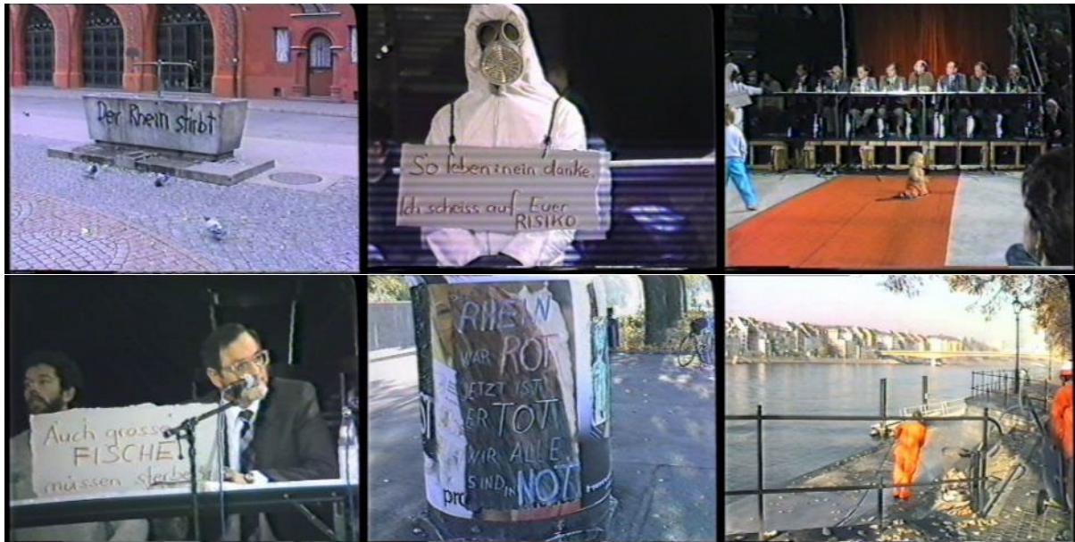
Abb. 16: Videostills Der Rest ist Risiko (1987): Graffiti auf einem Brunnen – Szenen während des Tribunals (dreimal) – Plakat – Reinigung des Rheinufers.

Schweizerhalle war nicht nur Thema des Staatsfernsehens. Die 25-minütige Videoproduktion Der Rest ist Risiko von Sus Zwicky 99 schildert abseits von realen Katastrophenbildern die mannigfaltigen Reaktionen der betroffenen Bevölkerung. Die Aufnahmen zeigen unter anderem die grosse Protestdemonstration eine Woche nach der Katastrophe und eine Plakataktion, bei der die Innenstadt Basels in der Nacht vom 7. auf den 8. November 1986 mit selbstgemachten Plakaten tapeziert wurde (Minute 10:45). Protestaktionen fanden nicht nur im öffentlichen Raum statt. An der Veranstaltung „14 Tage danach“ gaben Kulturschaffende ihrer Betroffenheit und Wut Ausdruck. In der Kunsthalle Basel wurde im Dezember das Happening „Von 12 bis 12“ mit Performances und Lesungen durchgeführt. An der Universität Basel gründeten rund 800 Personen die Aktion „Selbstschutz“, Ausdruck einer weitverbreiteten Skepsis gegenüber den Verantwortlichen und den Behörden, denen Vertuschung und Verharmlosung vorgeworfen wurden. Am eindrücklichsten sind die Aufnahmen einer tribunalartigen Veranstaltung, an der Vertreter von Behörden und der chemischen Industrie auf dem Podium von einer aufgetragenen Menge in die Zange genommen werden (Minute 6:46 und 19:18)