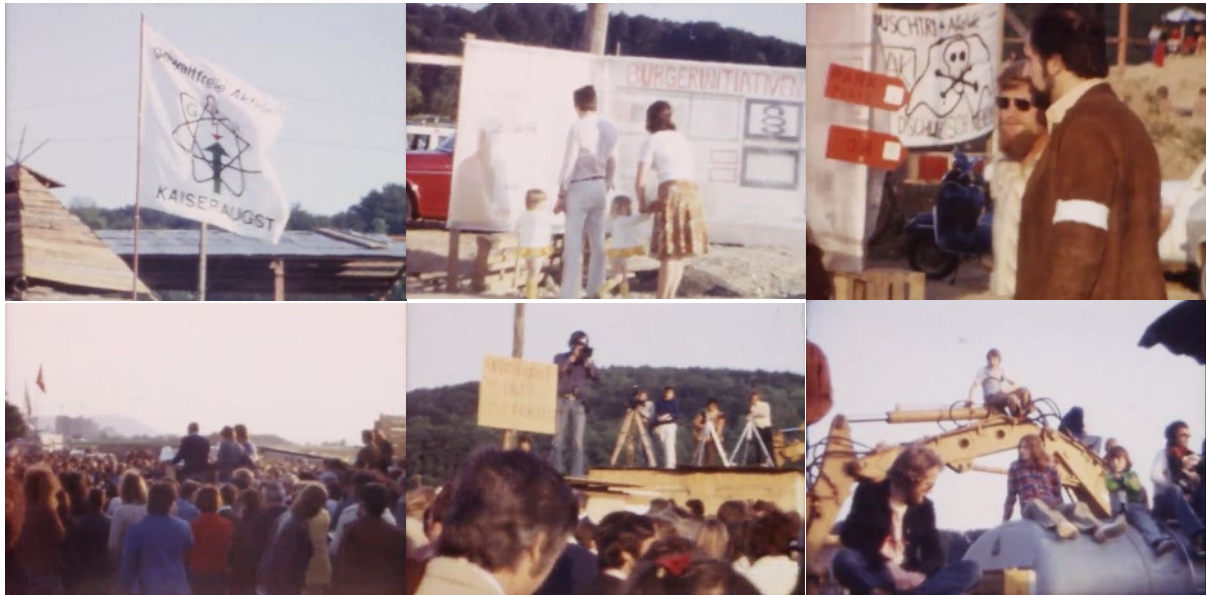
Abb. 26: Filmstills [Kaiseraugst] (1975): GAK-Logo – sich informierende Besucher – „Ordner“ (Ordnungskräfte) – Vollversammlung – Filmkameras – Baumaschinen als Tribüne.