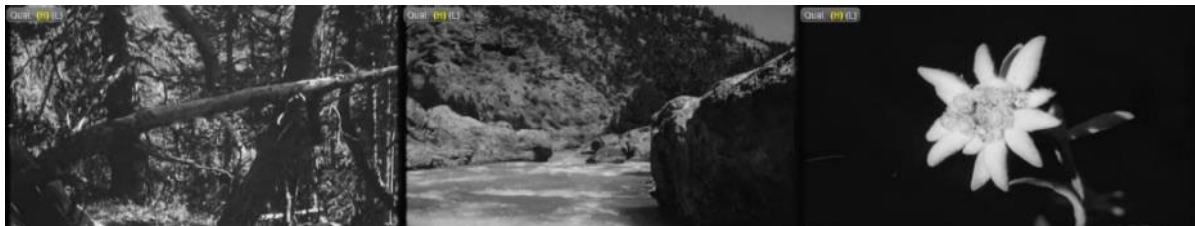
Abb. 7: Filmstills SFW, 26. August 1949: Wildnis Nationalpark – Spöl – Edelweiss.

Der geplante Eingriff in ein weiteres Naturschutzgebiet von nationaler Bedeutung rief schon, bevor die Auseinandersetzungen in eine heisse Phase gerieten, die Schweizer Filmwochenschau auf den Plan. Am 26. August 1949 berichtete die Schweizer Filmwochenschau über den Nationalpark. 71 Die Aufnahmen zeigen den Baumbestand des Parks und seine tierischen Bewohner: Vögel, Eichhörnchen, Murmeltiere, Gämsen und Hirsche. Im einsamen Spöltal, das von der italienischen Quelle durch den Nationalpark bis zur Mündung in den Inn in Zernez führt, gedeiht Edelweiss. Der Kommentar beschwört das Primat der Natur im Unterengadiner Park: „Und alle diese freie Schönheit befruchtet der Spöl mit seinen rauschenden Wassern. Wie aber, wenn dieser Fluss durch den Bau von Kraftwerken zum trüben Rinnsal würde?“.