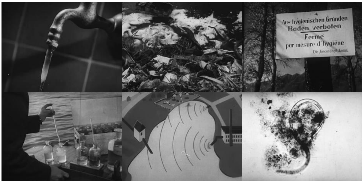
Abb. 10: Filmstills Wasser in Gefahr (1952): Algenpfropf aus dem Trinkwasserhahn – Schaumkronen und Abfall am Seeufer – Badeverbotsschild – Entnahme von Wasserproben – schematisierter Zusammenhang von Verunreinigungen durch Abwassereinleitungen und getrübbten Badefreuden – Bakterien bei der Arbeit.

Nach diesem Problemaufriss widmet sich die zweite Sequenz den Lösungsansätzen. Animierte Szenen erklären den Zusammenhang von Abwassereinleitungen, offenen Kehrrichtablagerungen und der Verschmutzung des Grundwassers (Minute 6:56). Mit einer Kanalisation können die zu reinigenden Abwässer in die Kläranlage geführt werden, wo sie mechanisch und biologisch gereinigt werden. Im Labor demonstriert der Techniker anhand einer Zeitrafferaufnahme, wie erfolgreich die biologische Reinigung ist. Der Blick durchs Mikroskop zeigt, wie Mikroorganismen ihre Arbeit verrichten (Minute 9:50). Technisch-biologische Innovationen können allerdings nur die Folgen bekämpfen. Um die Ursachen zu bekämpfen, sind Verhaltensänderungen angezeigt. In einer Rückwärtssequenz kehren alle zu Beginn des Films in den See gekippten Abfälle wieder an ihren Ursprungsort zurück (Minute 12:27). Bade- und Trinkwasserverbotsschilder können abmontiert werden, in den Seen kann wieder unbedenklich gebadet werden, vom Rheinfluss stiebt die Gischt.