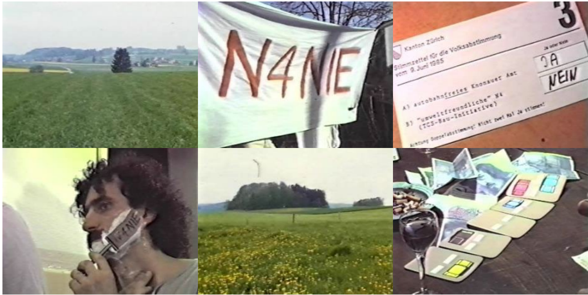
Abb. 34: Videostills Mit 120 durch Säuliamt (1985): rasante Fahrt über Felder und Wiesen – Spielszene mit Anti-N4-Leintuch – Abstimmungsunterlagen – Rasur – immer wieder im Bild: unverbaute Natur im Säuliamt – das finale Pokerturnier mit „Grosser Strasse“.

Der fertige Film wurde auf Videobänder ausgespielt, um eine möglichst vielfältige, günstige und einfache Verbreitung zu ermöglichen. Mit 120 durchs Säuliamt konnte auch an den Solothurner Filmtagen 1986 gezeigt werden – der Film stiess auf grossen Anklang, die Aufführung fand laut Gery Girschweiler vor vollem Saal statt, nicht zuletzt wegen der Sympathiebesucher der lokalen Widerstandsbewegung gegen den Autobahnabschnitt Biel-Solothurn/Zuchwil. Eine Kinoauswertung war aufgrund des Formats ausgeschlossen: Kaum ein Kino war damals in der Lage, Videokassetten abzuspielen und zu projizieren. Hingegen lief das Band an verschiedenen Diskussionsanlässen, meist als Einstieg in eine Diskussion oder für ein Referat. Die Jungen Säuliamtler waren mit Standaktionen auch im Zürcher Niederdorf und in anderen Schweizer Städten präsent, wo das Video auf einem Monitor gezeigt wurde, oder an einschlägigen Treffpunkten Jugendlicher, wie im Zürcher Quartierzentrum Kanzlei. Wegen der einfachen Kopierbarkeit von Videokassetten verbreitete sich Mit 120 durchs Säuliamt rasch auf inoffiziellen Vertriebskanälen – was ganz im Sinn der Sache war.