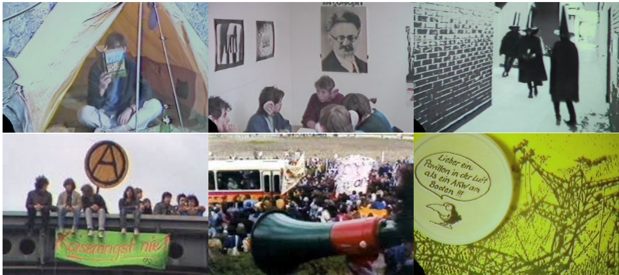
Abb. 29: Videostills Kaiserangst nie! (1984): Besetzer im Regen – konspirative Treffen – dunkle Mächte – Besetzung des zerstörten Infopavillons – Besuch Nationalratskommission – Slogan der Gruppe.

die herkömmlichen Bewegungen es mit traditionellen Mitteln erreichen können. Kaiserangst nie! weitet den Blick auf die Problematik der Entsorgung und Lagerung des radioaktiven Abfalls (ab Minute 36:22) und zeigt die Vielfalt und die Ausdauer der Gegenbewegungen.