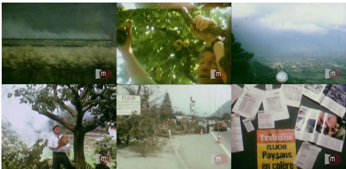
Abb. 20: Filmstills Baroud de survie (1970-1975): Emissionen aus dem Werk Martigny – geschädigte Aprikosen – Wolkenzug in Zeitraffer – Fällen von Aprikosenbäumen – Demonstration auf der Kantonsstrasse vor Martigny 1977 – Schlagzeilen.