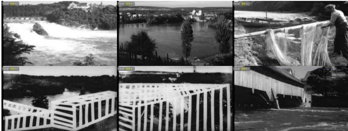
Abb. 3: Filmstills SFW, 28. September 1951: Rheinfall – Rheinau – Fischer am Rheinufer – Overlay mit geplanten Kraftwerksbauten – Holzbrücke.

Trotz der Proteste begannen im Januar 1952 die Bauarbeiten. Das Rheinau-Komitee beraumte kurzfristig auf den 27. Januar eine Demonstration an: 10'000 Teilnehmende forderten in einer Resolution den sofortigen Abbruch der Bauarbeiten und den Rückzug der Konzession. Erneut berichtete die Schweizer Filmwochenschau am 1. Februar 1952 – ein Novum, mied sie es doch üblicherweise, über Demonstrationen zu berichten. Der kurze Beitrag (37 Sekunden) zeigt Bagger bei den Bauarbeiten am Rhein und den Demonstrationszug mit Parolen auf dem Weg zum Klosterhof Rheinau, vorbei an einem Gesslerhut. Der Kommentar erwähnte bedauernd, dass mit dem Kraftwerkbau einer der letzten frei fliessenden Rheinabschnitte gestaut würde. „Am Sonntag, den 27. Januar haben sich trotz Kälte und Schnee über 10'000 Bürger und Bürgerinnen aus allen Bevölkerungskreisen im alten Klosterhof zu Rheinau versammelt, um einstimmig einen beschwörenden Appell zu verabschieden, der die Einstellung der Bauarbeiten und die Rücknahme der Konzession verlangt.“ 61