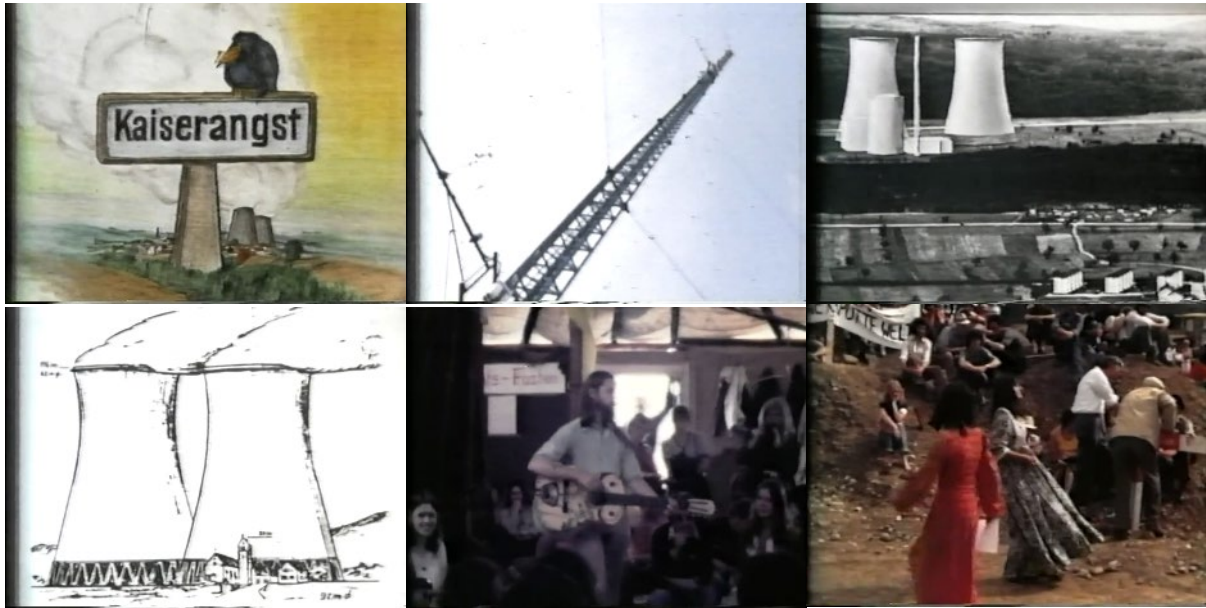
Abb. 24: Filmstills Kaiseraugst besetzt (1975/76): Erste Einstellung – Baugespann – Visualisierungen der geplanten Kühltürme (zweimal) – Aernschd Born im Rundhaus – Tanz.