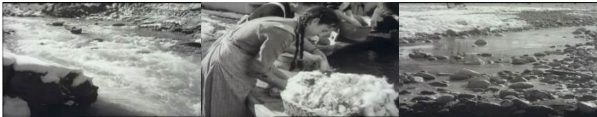
Abb. 8: Filmstills SFW, 7. November 1958: Rauschender Spöl – Schafwolle wird nach der Schur gewaschen – Inn mit Niedrigwasser.

dienst und elektrische Energie ins Tal bringe, warnt aber gleichzeitig: „Wie aber, wenn die Inn-Kraftwerke wie in anderen Bergtälern aus dem Talfluss ein trübes, stagnierendes Gewässer machen?“.