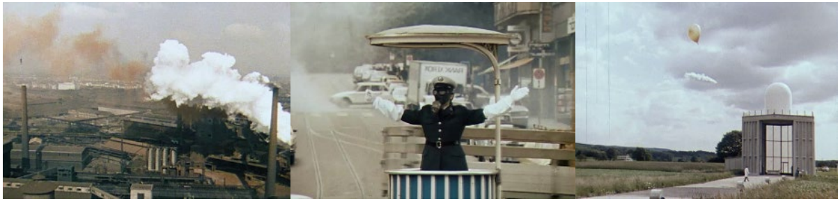
Abb. 17: Filmstills Luft zum Leben (1972/1973): Das Ruhrgebiet als Hotspot der Luftverschmutzung – Polizist mit Gasmaske in Zürich – eine Luftwert-Messstation in der Schweiz.

Die Langversion mit Bildern aus der Schweiz stellt einheimische Lösungen in den Vordergrund: Neben einigen abschreckenden Bildern, etwa einem Verkehrspolizisten mit Gasmaske (!) in Zürich inmitten einer Abgaswolke (Minute 5:30) und Emissionen von Zement- und Aluminiumwerken (Minute 20:45) zeigt der Film bereits Erreichtes: In Zürich werden Heizabgase gefiltert und kontrolliert, am Walensee und anderswo machen Staubfilter bei Zementwerken Hochkamine überflüssig (Minute 21:50). Die Zementindustrie habe auf Reklamationen von Anliegern reagiert, Grenzwerte festgelegt und den Ausstoss um 90 Prozent reduziert. Diese Aktionen wirken – gefolgt von Bildern rauchender Schlotte im Ruhrgebiet – geradezu vorbildlich. Beide Versionen des Filmes erreichten ein grosses Publikum, die Langversion vermutlich sechsstellig und die in ganz Europa in Kombination mit einem Hauptfilm vertriebene Kurzversion hatte allenfalls gar siebenstellig Zuschauerzahlen. 106 Der Film dürfte viele erstmals für die Luftverschmutzung sensibilisiert haben. In hohem Masse virulent wurde die Luftverschmutzung in Gesellschaft und Medien ab Herbst 1983 im Zusammenhang mit europaweit sich zeigenden Waldschäden (Waldsterben). Das Fernsehen widmete dem Thema Waldsterben unzählige Berichte, jedoch entstand unseres Wissens weder eine spezifische Bewegung noch filmische Dokumente aus einer Bewegungs-Innensicht.