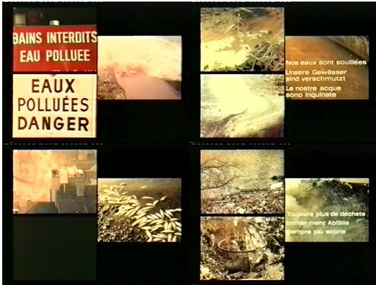
Abb. 11: Filmstills La suisse s'interroge (1964); synchron wurden auf der Leinwand eine bis drei Einstellungen präsentiert: Warnung vor verschmutztem Wasser – Schaumkronen – tote Fische – zugemülltes Gewässer.

scher Problemwahrnehmung: Die Wasserverschmutzung ist eines von vielen Warnzeichen eines kranken Systems, das wegen der Interdependenzen von anderen Faktoren nicht isoliert betrachtet oder gelöst werden kann. Folgerichtig bleiben im Schockzustand dieser Erkenntnis auch Aufrufe zur individuellen Verhaltensänderung oder die Erwartung einer politischen Intervention aus.