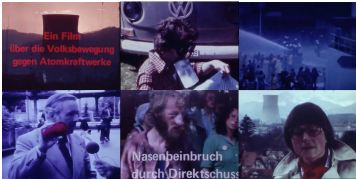
Abb. 30: Filmstill Gösgen – Ein Film über die Volksbewegung gegen Atomkraftwerke (1978): Filmbeginn – selbstgefertigte „Gasmasken“ – Einsatz von Tränengas und Wasser – Polizeidirektor zeigt ein Gummigeschoss – Folgen eines Gummigeschosses – Zeitzeugin.

Das Kollektiv stellte den langen Film im Hinblick auf den Prozess vom 6. September 1978 fertig, den das Richteramt Olten-Gösgen gegen sechs Demonstranten führte. Jürg Hassler blies den Super-8 Film in einer selbst gebauten Apparatur Bild für Bild auf das 16-Millimeter-Format auf, das auch im Kino gezeigt werden konnte. Die Verteidigung führte als Beweismaterial einen Teil des Filmes vor, wobei sich die 400 bis 600 Sympathisanten im Gerichtssaal solidarisiert und im Film hörbare Lieder mitgesungen hätten. 292 Nach der Vorführung der Kurzversion an den Solothurner Filmtagen reagierte das Kollektiv auf die verbreitete Kritik, es sei Splittergruppen zu viel Platz eingeräumt worden. 293 Auch innerhalb des Kollektivs wurde offensichtlich so heftig diskutiert, dass dies „mehr Nerven gekostet [habe] als die Aufnahmen bei den Polizeieinsätzen“. 294