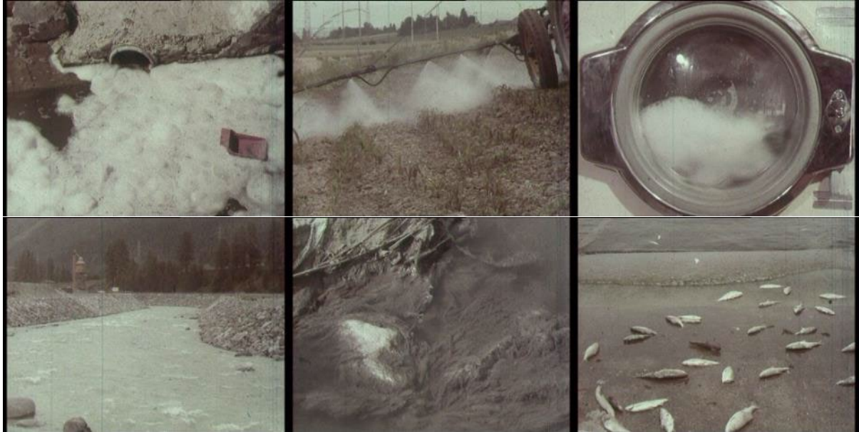
Abb. 13: Filmstills Nous autres fossoyeurs – Eh es zu spät ist (1970): Schaumkronen – Düngemittel der Landwirtschaft – phosphathaltige Waschmittel – begradigter Flusslauf – Algenbildung in Brackwasser – Fischsterben.