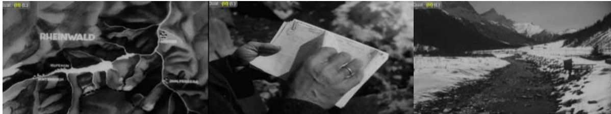
Abb. 2: Filmstills SFW, 31. März 1944: Animation mit dem überfluteten Gebiet Rheinwald - Pöstler überbringt Glückwunschtelegramme – Fluss und Landschaft im Rheinwald.

Eine Trickaufnahme visualisiert die nach einem Bau überflutete Talsohle. Es folgen Aufnahmen, die nach der Abstimmung entstanden sind: Ein Bauer transportiert in immer noch schneebedeckter Landschaft Schlagholz, im Dorf werden Schafe geschoren und durchs Dorf getrieben, eine Frau reinigt Gefässe, einzelne stattliche Wohngebäude mit schmiedeeisernen Fenstergittern werden gezeigt. Ein Pöstler bringt einem Dorfbewohner Glückwunschtelegramme an die Haustür. Der Beitrag endet mit einer Dorfansicht, Aufnahmen einer Kapelle und des Rheins.