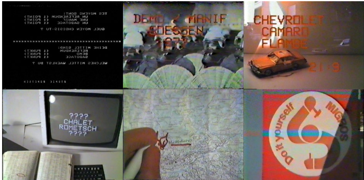
Abb. 28: Videostills Atomic Rometsch (1984): Zeitgenössisches Spiel-Interface – Demonstration in Gösigen – Anschläge auf Autos von Verantwortlichen – Ziel Grindelwald – das „geborgte“ Logo der anonymen Gruppe.

flug von verschämter Sensationsgier“ 268 auf das Zeigen des an die Redaktion adressierten Päckleins und eines kurzen Ausschnittes. 269 Die deutsche Wochenzeitung Die Zeit situierte das Bekennervideo als Gegenpol zu „rechtsradikalen“ AKW-Befürwortern, die Bürgerwehren forderten. Es könne sich aber auch um einen „Reichstagsbrand‘ fanatischer AKW-Befürworter“, handeln, der im Vorfeld der Abstimmung AKW-Gegner diskreditieren solle, spekulierte der Autor. 270