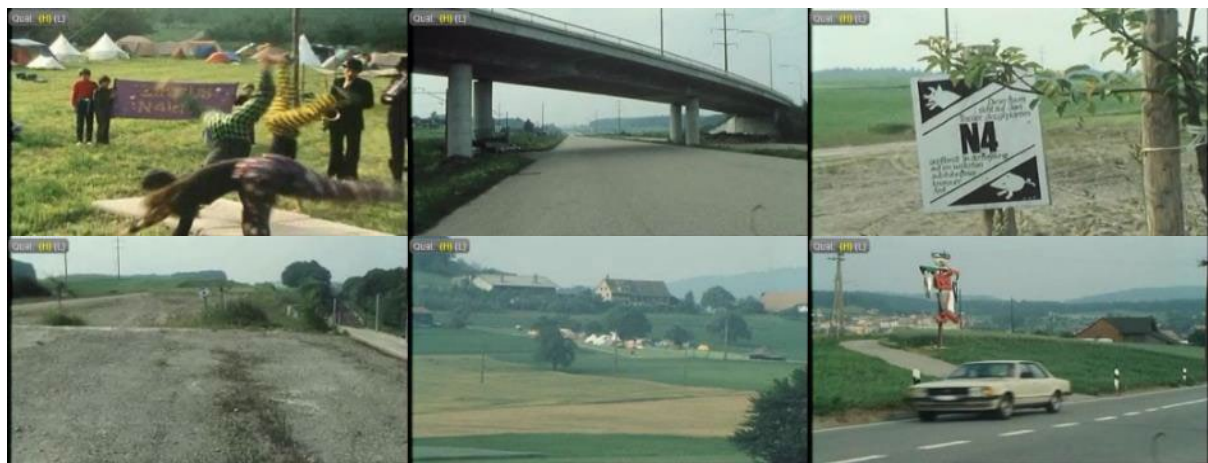
Abb. 35: Videostills Blickpunkt , SRF, 25. Juni 1981: Kinderzirkus und Musikband, im Hintergrund die Zeltstadt der N4-Gegner – Teilstück mit Brücke im Säuliamt – symbolische Baumpflanzung und Protestplakat beim Autobahnstummel – Unkrautbefall – Zeltstadt der Gegner bei Bonstetten – Durchgangsverkehr und Protestfigur im Hintergrund.

Die Sendung Blickpunkt strahlte am 25. Juni 1981 einen Bericht über ein von den Jungen Säuliämtern veranstaltetes Protestfest in der Gegend des geplanten Rastplatzes Bonstetten aus. 341 Der Kinderzirkus „N4lefan“ führt Akrobatikübungen vor (Minute 0:02), die Kamera schwenkt über die sanft hügelige Landschaft zum toten Autobahnstummel auf kantonalzürcherischem Gebiet (Minute 0:38). Fünf Fest-Teilnehmende äussern sich zu ihren Beweggründen gegen den Streckenverlauf der N4. Am Rande des bereits wieder rissigen Autobahnbelages steht ein frisch gepflanzter Baum; ein Schild macht auf den Widerstand aufmerksam (Minute 1:58). Die Kamera fängt mit einem Schwenk über landwirtschaftlich genutzte Flächen, Wälder und Wiesen die idyllische Umgebung der geplanten Baustelle für den Rastplatz Bonstetten ein. Hier veranstalten die Jungen Säuliämter ihr Widerstandshappening mit Zeltstadt und Verpflegung (Minute 2:49). Aufnahmen von stark befahrenden Durchgangsstrassen durch die Säuliämter Gemeinden beenden den Beitrag (Minute 5:10).