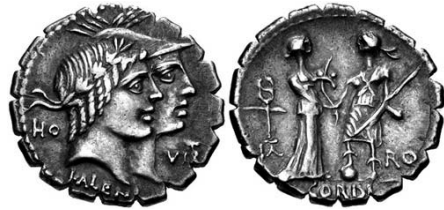
FIG. 2 - RRC 403. Classical Numismatics Group, Inc. ( www.cngcoins.com ), inventory number: 944650.

Spartiti sulle facce delle monete compaiono anche i nomi dei due triumviri monetali responsabili di questa emissione: KALENI e CORDI, rispettivamente sul diritto e sul rovescio. Entrambi gli elementi onomastici possono essere interpretati sia come gentilicia che come cognomina (6) ; tutta-