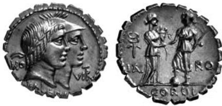
FIG. 1 - RRC 403. Lehrstuhl für Alte Geschichte an der Katholischen Universität Eichstätt-Ingolstadt – Numismatische Bilddatenbank Eichstätt.

(legende: ITAL e RO), colte mentre si rivolgono l'una verso l'altra porgendo le destre in una stretta; con la sinistra, Italia reca una cornucopia (2) , mentre la figura di Roma, coronata d'alloro, regge una hasta (3) e poggia il piede destro su un globo. La scena è con grande verosimiglianza un'allusione alle procedure censitarie del 70/69 a.C. (4) , grazie alle quali i novi cives vennero definitivamente integrati nella comunità civica e politica romana (5) .