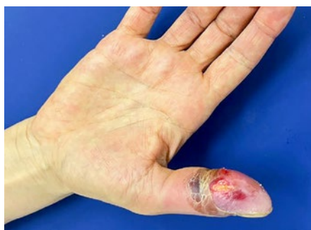
Figure 4: Main droite vue ventrale. Six jours après le rinçage avec une solution de dichlorhydrate d'octénidine. La peau commence à se décoller.