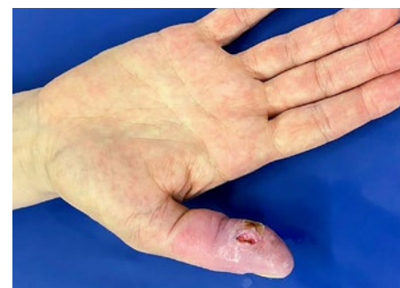
Figure 5: Main droite vue ventrale: 17 jours après le rinçage avec une solution de dichlorhydrate d'octénidine. Détachement presque complet de la couche cutanée supérieure avec persistance de rougeurs.

de dichlorhydrate d'octénidine n'est pas connu à ce jour, mais pourrait être élevé, comme pour d'autres effets indésirables. Les professionnels de santé et tous ceux qui fabriquent, administrent ou remettent des produits thérapeutiques à titre professionnel ou qui sont autorisés à le faire en tant que personnes exerçant une profession médicale sont tenus de notifier à Swissmedic la survenue d'un effet indésirable grave ou jusqu'alors inconnu (art. 59, al. 3 de la loi sur les produits thérapeutiques [LPT]) – même en présence d'un simple soupçon.