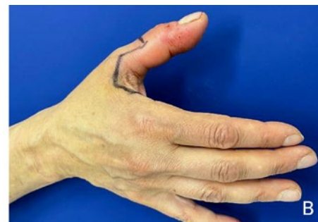
Figure 2: Main droite vue ventrale (A) et vue dorsale (B). Deux jours après rinçage avec une solution de dichlorhydrate d'octénidine, montrant une augmentation du gonflement et de la rougeur au-delà de l'articulation métacarpo-phalangienne I.