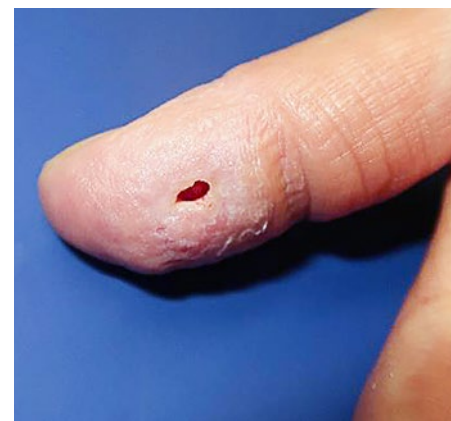
Figure 6: Pouce droit: 43 jours après le rinçage avec une solution de dihydrochlorure d'octénidine. On constate des conditions de plaie inertes sans signe de fermeture secondaire.

Le mécanisme pathologique des EIM décrits n'est pas totalement élucidé. La solution introduite sous pression peut pénétrer dans le tissu interstitiel, entraînant entre autres une lésion directe des tissus par un temps de contact