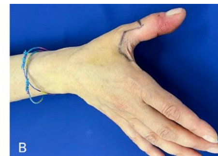
Figure 3: Main droite vue ventrale (A) et vue dorsale (B): Quatre jours après le rinçage avec une solution de dichlorhydrate d'octénidine. La rougeur est régressive. Dans la zone entourant la plaie, une macération croissante de la peau s'observe.