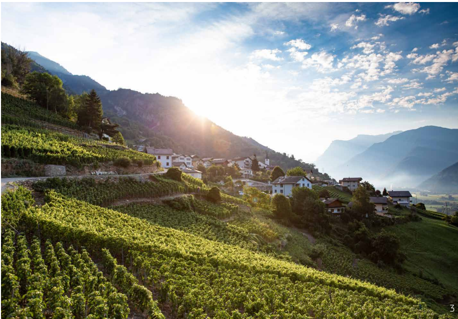
Abbildung 3: Die Reb- und Terrassenlandschaft prägen das einmalige Landschaftsbild von St. German.

des 20. Jahrhunderts waren Landwirte und Gemeinden für den Unterhalt verantwortlich. Im Wallis wurden Unterhaltsarbeiten oft von temporären Arbeitskräften verrichtet, die im Winter nicht genügend Beschäftigung fanden. Mit dem Strukturwandel in der Landwirtschaft und der zunehmenden Mechanisierung blieb jedoch immer weniger Zeit dafür, und die Tradition verschwand. Heute fehlt neben Zeit und Personal oftmals auch das nötige Fachwissen. Um dieser Problematik entgegenzuwirken, haben sich verschiedene Projekte zum Ziel gesetzt, die Kunst des Trockenmauerns zu erhalten (s. Box 3). So auch das vom UNESCO-Welterbe Schweizer Alpen Jungfrau-Aletsch initiierte Gemeinschaftsprojekt mit den Alpgeteiltschaften Bettmeralp, Greicheralp, Goppisbergeralp und Riederalp. Die Erstellung eines Inventars, das den Handlungsbedarf an der