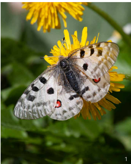
Abbildung 1: Der Rote Apollo ( Parnassius apollo ) gilt als gefährdet. Trockene und besonnte Mauersteine dienen ihm als Ruheplatz.

Sie bilden den oberen Abschluss der Mauer. Sie können liegend oder stehend auf die Mauer aufgesetzt werden.