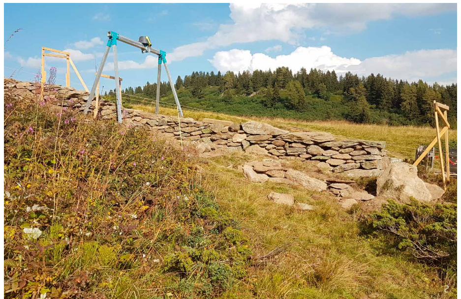
Abbildung 2: Trockenmauern sind wertvolle Landschaftselemente und bilden einen wichtigen Bestandteil der ökologischen Infrastruktur. Unter ökologischer Infrastruktur wird ein Netzwerk von Flächen, welche für die Biodiversität wichtig sind, verstanden.