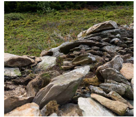
Abbildung 4: Durch den fehlenden Unterhalt zerfallen Trockenmauern nach und nach.