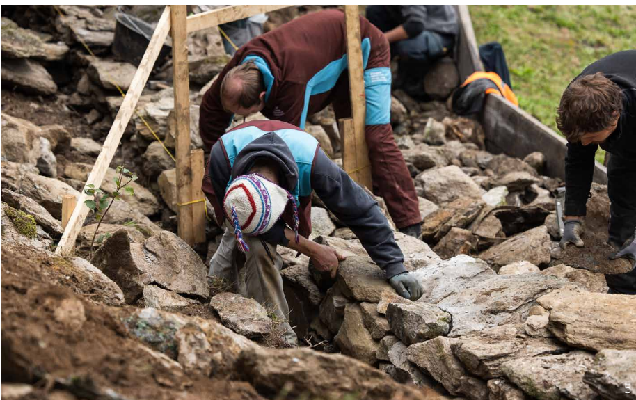
Abbildung 5: Mit grossem handwerklichem Geschick stellen Zivildienstleistende der Stiftung Umwelteinsatz eine Mauer wieder her.

Der Einsatz von Maschinen und importierten Rohstoffen ist heutzutage sehr kostengünstig geworden, und der Unterhalt von traditionellen Trockenmauern steht im Widerspruch zu kurzfristigen wirtschaftlichen Zielen. Dennoch ist genau diese besondere