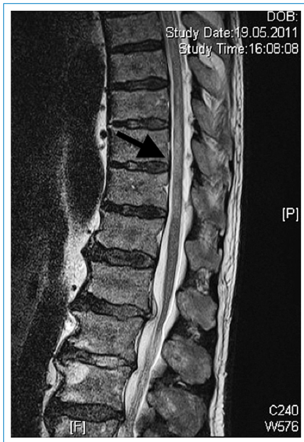
Abbildung 1 MRI (T2w-Sequenz) bei Spitaleintritt mit den hyperintensiven Läsionen des Myelons auf der Höhe Th8–11.

sche Kriterium, und die Myelitis ist zusätzlich durch eine Neuritis des Nervus opticus kompliziert [5]. Bei der VZV-Myelitis ist der frühe Therapiebeginn entscheidend, obwohl bisher keine Standardtherapie eta-