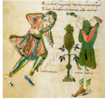
Abbildung 5: Anonymus: Zwei Spiel Männer als Allegorie der Konsonanz (um 1060), Tropar von Nevers, fol. 34v (Ausschnitt), Paris, Bibliothèque nationale de France, Ms. Latin 9449.

Nachdem sich das Gesamtsujet der fraglichen Beatus-Buchmalerei weder über Text- noch über weitere Bildquellen identifizieren lässt, bleibt nur noch die Möglichkeit, es mit den Einzelementen zu versuchen.