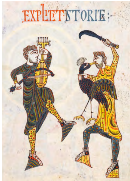
Abbildung 1 und 2: Petrus: Buchmalerei auf fol. 86r der Silos-Apokalypse, 1091/109 (378 x 235 mm), ganze Seite und Ausschnitt, London, British Library, Add MS 11695.

Das Medium der Buchmalerei hat für die musikikonographische Analyse den großen Vorteil, dass – im Unterschied zur Ölmalerei – Pentimenti 13 oder Restaurierungen der einzelnen Bilder eher selten sind. Im vorliegenden Fall sind keine späteren Veränderungen erkennbar.