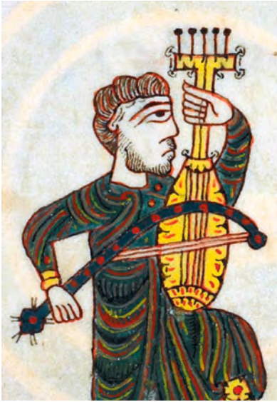
Abbildung 6: Petrus, Spielmann mit Streichinstrument, fol. 86r der Silos-Apokalypse, Ausschnitt.