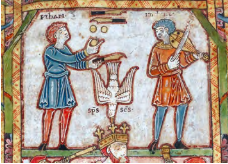
Abbildung 4: Anonymus: König David und seine Musiker (11.–12. Jahrhundert), Tiberius-Psalter, fol. 30v (Ausschnitt), London, British Library, Cotton MS Tiberius C VI.