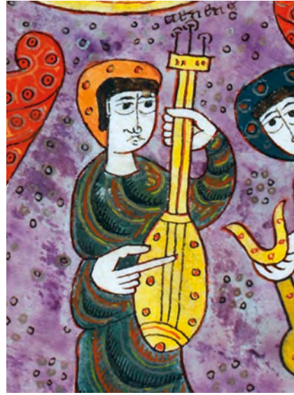
Abbildung 7: Petrus, Ältester mit »cithara«, fol. 86v der Silos-Apokalypse, Ausschnitt.

Abgesehen davon, dass die »citharas« der Ältesten nicht gestrichen, sondern gezupft werden (verdeutlicht durch den übergroß dargestellten Zeigefinger) und über der Decke nur drei statt fünf Saiten aufweisen, sind die Übereinstimmungen auffallend: Beide Instrumente werden annähernd senkrecht vor dem Körper gehalten, wobei die Greifhände bei beiden Spielern seltsam »verdreht« dargestellt sind. 40 Sowohl die Instrumentengröße als auch die ovale Korpusform und der deutlich abgesetzte Hals sind sehr ähnlich. Über dem Griffbrett ist jeweils nur eine Saite sichtbar und am oberen Instrumentenende stecken die Wirbel in einem T-förmigen Querbalken.