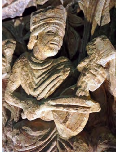
Abbildung 8: Meister von Jaca, Kapitell des Königs David (um 1085), Ausschnitt, Jaca, Museo Diocesano.

ziehen (Abbildung 8). Hier ist es zwar kein Spielmann, sondern König David, der ein annähernd senkrecht auf das linke Bein gestütztes Streichinstrument spielt. Auffallend ist jedoch, dass auch an dieser Skulptur die »cithara« mit nur einer Saite über dem Hals und drei Saiten über der Decke dargestellt ist.