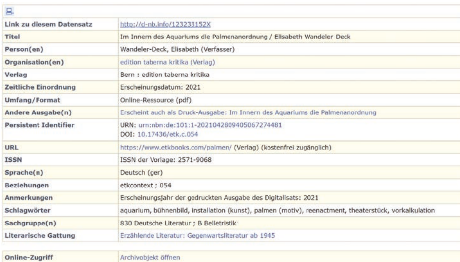
Abb. 6: Katalogisat in der Deutschen Nationalbibliothek, http://d-nb.info/123233152X . Der Verlags-DOI ist hier im Feld Identifier abgelegt, was bedeutet, dass über eine spezielle Katalogsuche mit den Identifiern serienmäßig eindeutige Deeplinks generiert werden können. Die im Nachhinein anpassbare URL-Verlinkung eines DOI kann also auf Wunsch und unter Kontrolle des Verlags auf ein Katalog- und Archivobjekt der DNB zeigen und diese quasi als Document Cloud herangezogen werden.

Weitere Maßnahmen sollen eine gewisse Nachhaltigkeit in der Verfügbarkeit gewährleisten: Neben dem Verlagsserver werden von mir diverse bibliothekarische Web- und Langzeitarchive wie die DNB, die Schweizerische Nationalbibliothek und das UB Repository der Universität Bern mit „Archivobjekten“ (DNB) und deren Meta- und Erschließungsdaten bestückt, sodass die Titeldaten dann über diverse Metakataloge wie den Karlsruher Virtuellen Katalog oder Suchmaschinen wie Google Scholar findbar sind. Und auch diese digitalen Objekte werden retrospektiv in die jährlich aktualisierte, von etkbooks herausgegebene Annotierte Bibliographie (Print und Online) der Verlagsproduktion aufgenommen und dort ausgewiesen. Dort werden die Erschließungsdaten als Schlagwortregister der Reihen etkbooks und etkcontext in einem gemeinsamen Index verschmolzen, was mediale Unterschiede in der Präsentation praktisch aufhebt bzw. die üblichen Priorisierungen angleicht. Der verschmolzene Index in der Annotierten Bibliographie vollzieht damit letztendlich auch analog das nach, was in dynamischen Bibliothekskatalogen schon länger üblich ist: Inhaltliche Recherche nach Literatur mit der Möglichkeit facetrierter inhaltlicher Filterung ist eine wichtigere, höher zu gewichtende Option als eine relevanzmäßige Präselektion nach Medium (digital oder print). Ein Ziel einer sol-