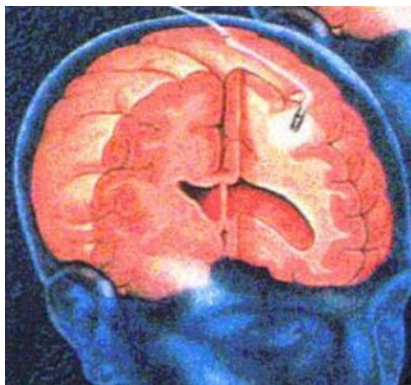
Abb. 2 ▲ Verformbare, für die Pädiatrie günstige intraparenchymale Sonde zur Messung des intrakraniellen Drucks