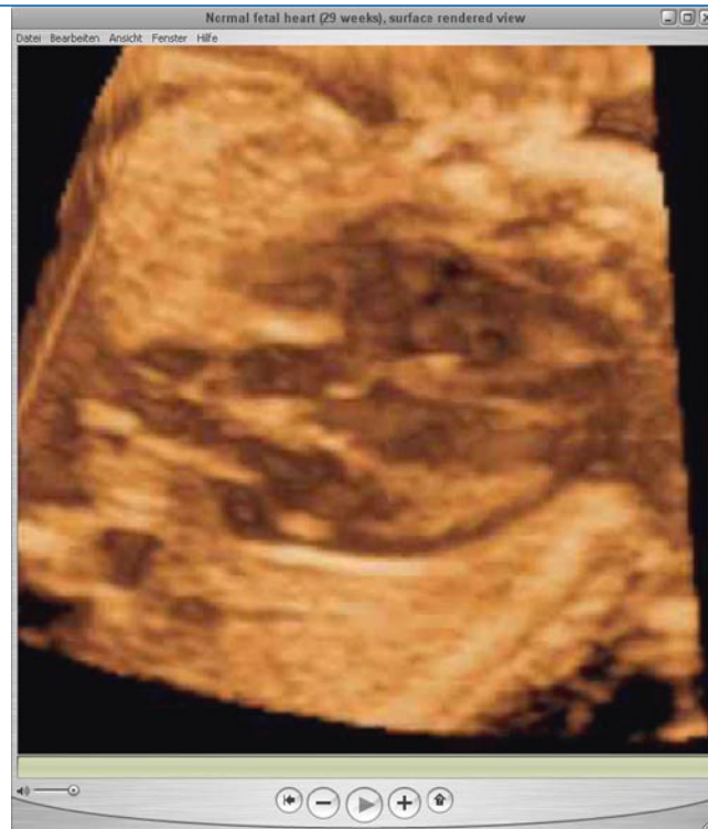
Abb. 3 ◀ Oberflächen-darstellung, Schnittbildverfahren und bewegte Sequenzen kombiniert in einem VR-Objekt: das fetale Herz (s. auch Movie S3). Movie S3: QuickTime VR-Movie eines normalen fetalen Herzens (Oberflächendarstellung der Herzhöhlen, bewegt)

Three-dimensional ultrasonography · Virtual reality · Interactive · Volume data