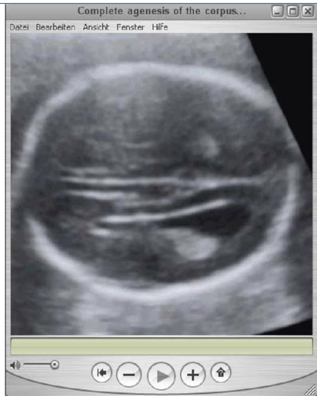
Abb. 4 ▶ Fetalen Balkenmangel in axialer Insonation (s. auch Beispiel Movie S4) Movie S4: QuickTime VR-Movie eines fetalen Gehirns mit Balkenmangel. (Aus [6], mit freundl. Genehmigung)

PD Dr. B. Tutschek Universitäts-Frauenklinik, Inselspital Bern Effingerstr. 102, 3010 Bern Schweiz tutschek@insel.ch