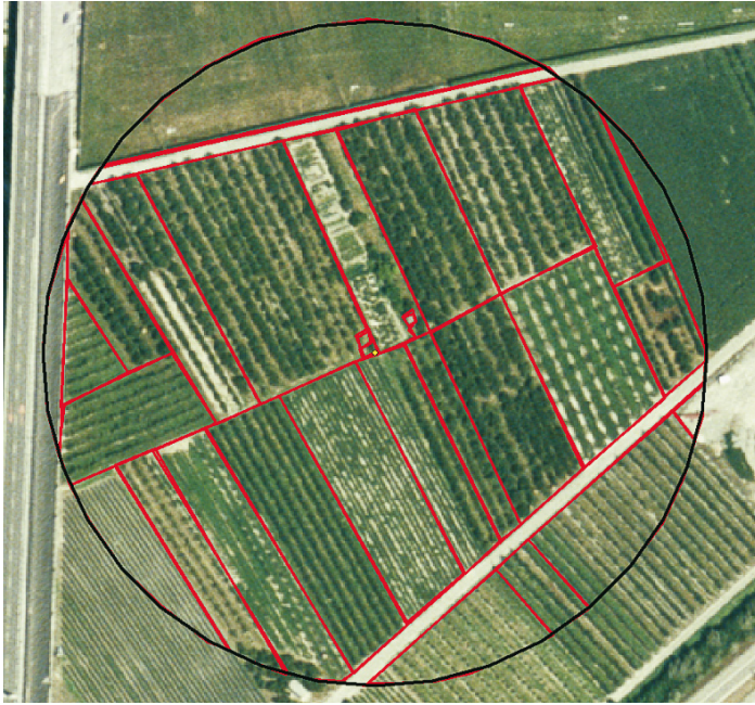
Abb. 3: Beispiel eines Territoriums (runder Kreis, r = 111\text{m} ) mit den unterschiedlichen Kulturen (in rot eingezeichnet). In der Mitte des Territoriums befindet sich der Nistkasten.

unbedecktem Boden aufgenommen. Zusätzlich wurden pro Territorium anthropogene Störfaktoren (Distanz zu Straßen und Siedlungen) anhand einer GIS-Datenbank und die Anwesenheit brütender Artgenossen erhoben. Da Ameisen die Hauptnahrung ausmachen, wurde für jedes Territorium die Anzahl Ameisennester geschätzt. Diese Schätzung basierte auf der Summe der proportionalen Kulturenflächen innerhalb des Kreises multipliziert mit der kulturspezifischen Ameisennestdichte. Die Auswertung erfolgte anhand zweier Modelle, einem statischen Modell, bei welchem die Anzahl besetzte Jahre eines Territoriums mit den Variablen verglichen werden, und einem dynamischen Modell, welches auf der Metapopulationsdynamik beruht. Im dynamischen Modell wurde für jedes der 6 Studienjahre unter Berücksichtigung der Variablen die Wahrscheinlichkeit für die Kolonisation und für das Verlassen eines Territoriums berechnet.