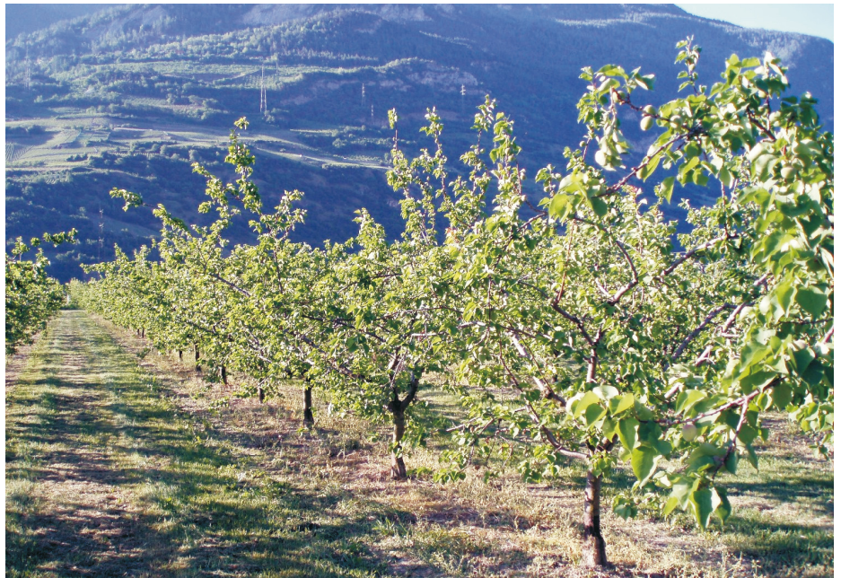
Abb. 2: Beispiel der intensiven Obstplantagen als Nahrungshabitat von Wendehälsen

wir, ob die Witterung zur Brutzeit einen grossen Einfluss auf den Bruterfolg und das Wachstum der Nestlinge hat. Es zeigte sich, dass Wetterschwankungen nur einen begrenzten Einfluss auf das Wachstum von Wendehalsnestlingen ausüben (GEISER et al. 2008). Die Nestlinge werden bei schlechtem Wetter weniger gefüttert und wachsen langsamer, doch können sie in Schönwetterphasen diesen Verlust meist wieder aufholen, so dass letztlich die Nestlingsmortalität wenig vom Wetter abhängt.