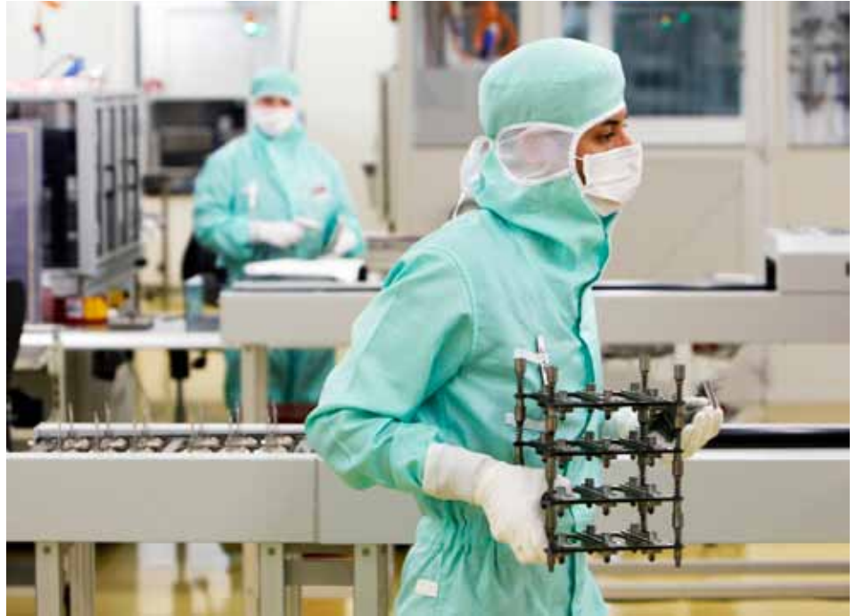
Von der Personenfreizügigkeit ist nicht in allen Fällen eine Reduktion des Fachkräftemangels zu erwarten. Aber sie kann zu einem Wachstum an entsprechenden Arbeitsplätzen führen, das ohne Freizügigkeit wegen der zu hohen Löhne in der Schweiz nicht in diesem Ausmass stattgefunden hätte. Im Bild: Halbleiterproduktion bei ABB.

Schweizer Betriebe haben schon seit längerer Zeit erhebliche Probleme, genügend qualifizierte Fachkräfte zu rekrutieren. Seit der Einführung der Personenfreizügigkeit im Jahr 2002 ist es für Betriebe prinzipiell einfacher geworden, auf Fachkräfte aus dem EU-Raum zurückzugreifen. Die vorliegende Analyse zeigt, dass sich das generelle Niveau des Fachkräftemangels zwischen 2000 und 2009 zwar nicht verändert hat, dass es aber ohne Personenfreizügigkeit im Jahr 2009 wohl sichtbar höher gelegen wäre. So hat sich der Fachkräftemangel bei jenen Betrieben, die im Jahr 2000 noch über grosse Schwierigkeiten klagten, an Arbeitsbewilligungen für ausländische Fachkräfte zu gelangen, bis 2009 deutlich zurückgebildet.