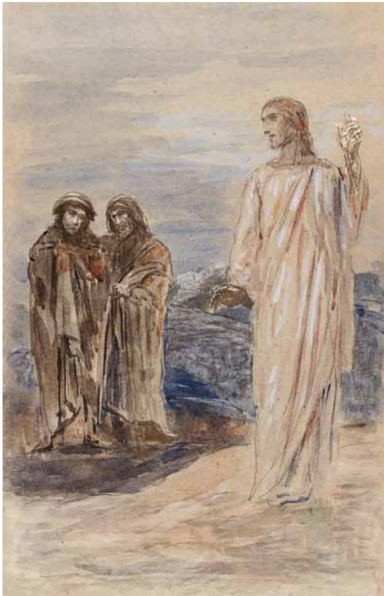
Rekonstruktion des Bildes «Die Jünger auf dem Weg nach Emmaus, denen der Herr nahe ist» Lukaskirche Frankfurt am Main

Du sollst nach Emmaus gehen, Wenn Zweifel dich bedroht, So wie zwei Jünger taten Drei Tage nach Christi Tod.