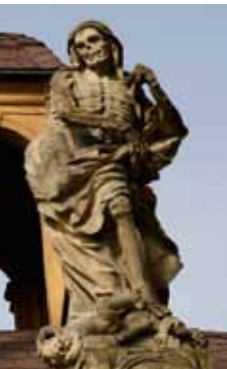
Gevatter Tod, um 1716 (auf dem Dach des Grufthauses Fam. Glafey in Jelenia Gora)

Seit Dezember 2012 kann das Prediger-Gärtlein als Bestattungsort genutzt werden. Gemeinsam mit der Tumba in der Kirche bietet unsere Kirchgemeinde nun zwei würdige