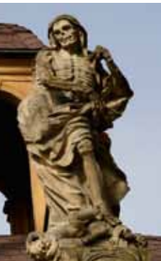
Gevatter Tod, um 1716 (auf dem Dach des Grufthauses Fam. Glafey in Jelenia Gora)

Seit Dezember 2012 kann das Prediger-Gärtlein als Bestattungsort genutzt werden. Gemeinsam mit der Tumba in der Kirche bietet unsere Kirchgemeinde nun zwei würdige