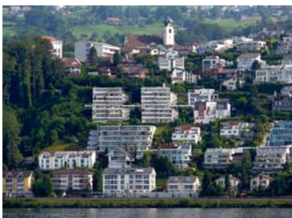
Dorfbild und soziales Gefüge ändern sich, wenn ein Kanton mit tiefen Steuersätzen Topverdiener anlockt. Hier in Wollerau im Kanton Schwyz.

Das Ergebnis bedeutet jedoch nicht, dass keine Veränderungen in den Ungleichheitsstrukturen stattgefunden hätten. Beispielsweise lassen sich Hinweise finden, dass die Top-Löhne in der Tat in den letzten Jahren überproportional zugelegt haben. Zudem scheinen starke regionale Unterschiede zu bestehen. In der Grafik auf dieser Seite ist die Veränderung der Einkommensungleichheit für die Schweizer Kantone dargestellt (berechnet auf Basis klassierter Steuerdaten