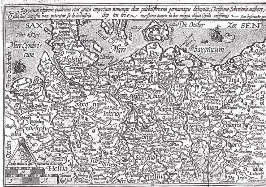
91. Brandenburg et Pomerania. 1. Saxoniae regionis quatuor ejus gentis imperiorum nomenque olim patebat, reuera germanique delineatio, Christiano Schrottenlo autore. Joan. Bussemacher exc. Marcia Brandenburgensis et Pomeraniae. I.D.(usammehr) exc.