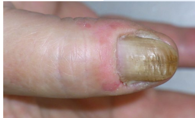
Abb. 13 ▲ Chronisches Ekzem der Paronychia mit unregelmäßiger Oberfläche des Nagels