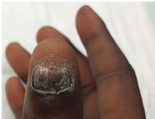
Abb. 6 ▲ Onychomykose durch Trichophyton rubrum bei einem 40-jährigen Schwarzafrikaner. Die Zuweisung war unter dem Verdacht eines ungualel Melanoms erfolgt

Onychomykosen sind die häufigsten Infektionen und auch die insgesamt häufigsten Nagelerkrankungen