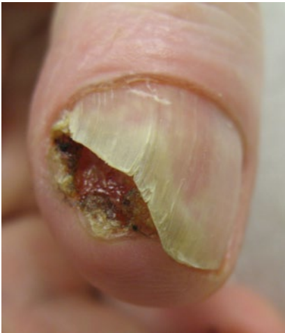
Abb. 16 ▲ Subunguales Plattenepithelkarzinom

nen Längsstreifen hervorrufen, solche im Nagelbett können kein Pigment an den wachsenden Nagel abgeben. Melanome des Hyponychium sind sehr selten. Ausdehnung der Pigmentierung auf die umgebende Haut wird als Hutchinson-Zeichen bezeichnet und ist praktisch immer ein Melanoma in situ. Molekulargenetische Untersuchungen haben gezeigt, dass veränderte Melanozyten bis zu 9 mm von der sichtbaren Pigmentierung nachweisbar sein können. Allerdings ist deren Bedeutung noch nicht eindeutig geklärt, und vor allen Dingen sind sie immer intraepidermal lokalisiert [34]. Klinische Warnzeichen für ein Nagelmelanom sind Auftreten eines Pigmentstreifens im Erwachsenenalter, Breite über 5 mm, unregelmäßige Pigmentierung innerhalb des Streifens und besonders auch Nageldystrophie im Zusammenhang mit der melaninbedingten Pigmentierung. Nach proximal hin sichtbare Verbreiterung des Streifens spricht für ein relativ schnelles Wachstum. Blutung