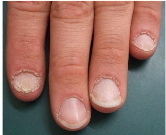
Abb. 11 ▲ Alopecia areata der Nägel

Der Umlauf oder Bulla repens ist meist durch Staphylokokken bedingt