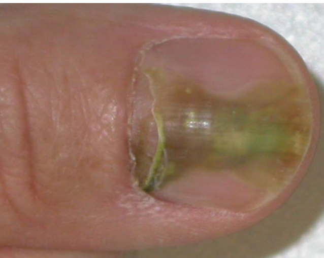
Abb. 9 ◀ Subungualer Abszess durch Pseudomonas aeruginosa

Alle diese Formen können sekundär zur totalen dystrophischen Onychomykose führen, die aber auch primär bei der chronischen mukokutanen Candidose auftritt [21, 22]. Bei dieser Form ist keine regelrechte Nagelplatte mehr erkennbar. Nagelbett und Matrix werden papillomatös und produzieren nur noch keratotischen Detritus.