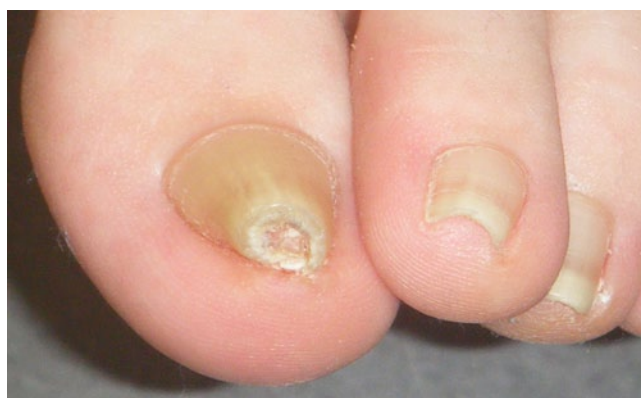
Abb. 2 ◀ Röhrennägel

Dystrophie eines oder weniger Nägel kann kein Zeichen einer allgemeinen Mangelerkrankung sein