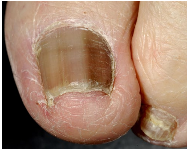
Abb. 14 ◀ Fast komplette Melanonychie, die sich bei einem 88-jährigen Patienten in den letzten Jahren allmählich entwickelt hat. Sie muss als maligne angesehen werden