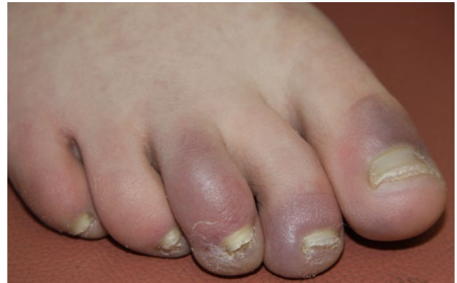
Abb. 8 ▲ Zyanotische Zehennagelwälle bei Chilblain-Lupus