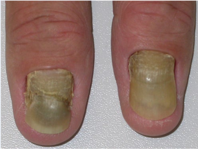
Abb. 5 ▲ Syndrom der gelben Nägel („yellow nail syndrome“)