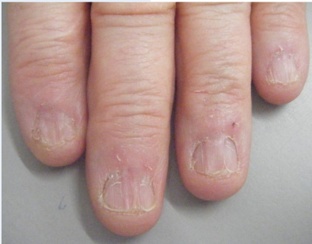
Abb. 10 ▲ Lichen planus der Nägel