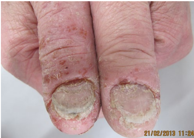
Abb. 12 ▲ Vorwiegend palmares Ekzem mit Nagelbeteiligung