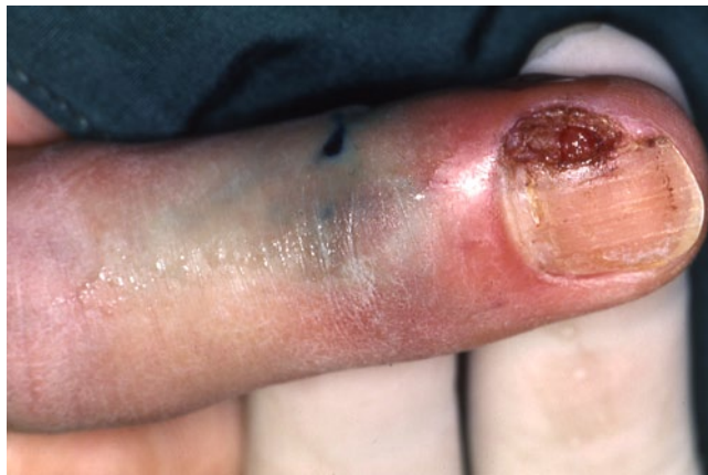
Abb. 15 ◀ Amelanotisches, jahrelang als eingewachsener Nagel fehl-diagnostiziertes amelanotisches Melanom