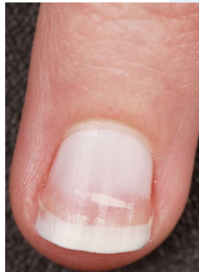
Abb. 4 ▲ Diffuse Leukonychie plus kleine striäre Leukonychie in deren distalen Anteil

Gelbe Nägel treten zusammen mit chronischem Lymphödem und Erkrankungen der Atemwege, jedoch auch vielen anderen Krankheiten, als Yellow-Nail-Syndrom auf (■ Abb. 5 ; [9, 10, 11, 12]). Assoziationen wurden auch mit Hypothyreose und Magenkarzinom gesehen [13]. Es wird angenommen, dass anatomische oder funktionelle lymphatische oder mikrovaskuläre Störungen vorliegen, jedoch zeigen die zahlreichen verschiedenen Krankheitsassoziationen, dass bisher kein einheitliches Ursachenmuster erkannt wurde.