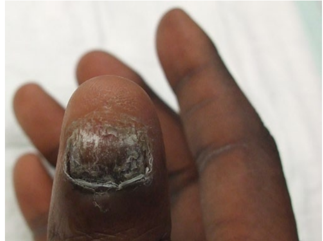
Abb. 6 ▲ Onychomykose durch Trichophyton rubrum bei einem 40-jährigen Schwarzafrikaner. Die Zuweisung war unter dem Verdacht eines ungualel Melanoms erfolgt

Onychomykosen sind die häufigsten Infektionen und auch die insgesamt häufigsten Nagelerkrankungen