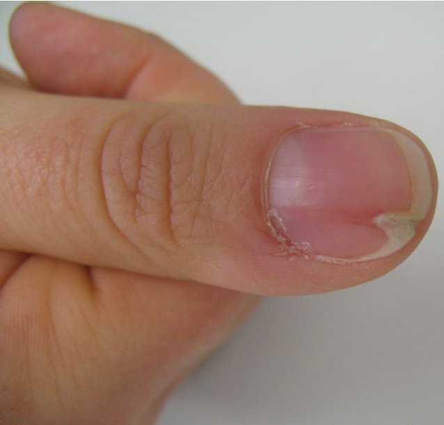
Abb. 7 ▲ Longitudinale Erythronychie bei Onychopapillom