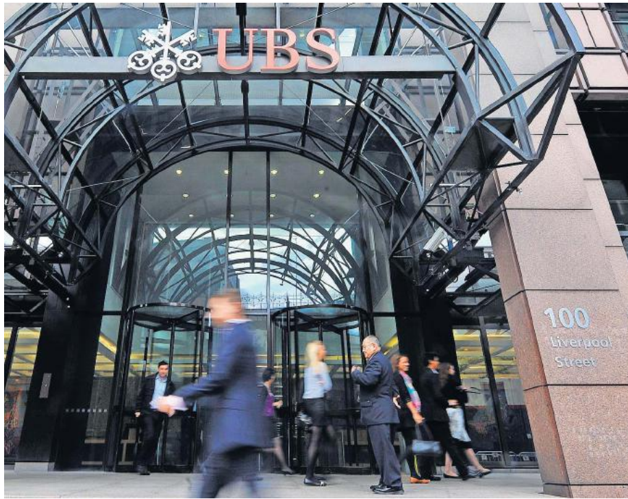
UBS-Filiale in London: In der britischen Hauptstadt sollen FBI-Agenten Zeugen befragt haben.

Die UBS wollte die neuen Vorwürfe gestern nicht kommentieren, wie ein Spre-