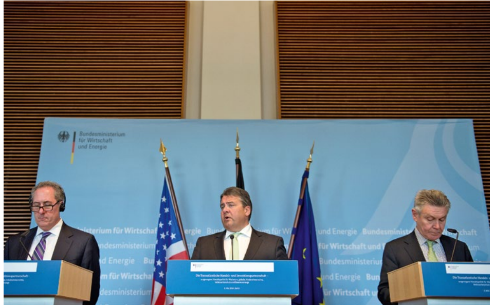
Le ministre de l'Économie allemand Sigmar Gabriel, entouré du représentant au commerce étasunien Michael Froman (à gauche) et du commissaire au commerce Karel de Gucht (à droite), lors d'une conférence de presse donnée suite aux tractations du TTIP du 5 mai 2014.

Les efforts déployés actuellement pour aboutir à un vaste accord sur le commerce et l'investissement entre l'Union européenne (UE) et les États-Unis ne manqueront pas d'affecter également la Suisse. À la demande du Secrétariat d'État à l'économie, le World Trade Institute de l'université de Berne a analysé les répercussions possibles d'un tel traité sur l'économie et les relations commerciales de notre pays. Les conséquences varient selon les scénarios.