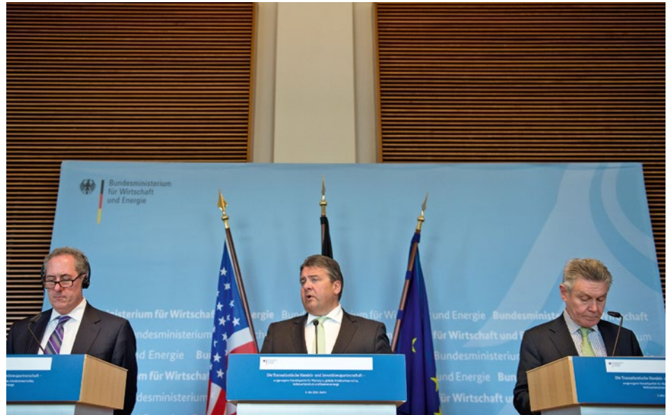
Bundeswirtschaftsminister Sigmar Gabriel flankiert von US-Handelsvertreter Michael Froman (links) und EU-Handelskommissar Karel De Gucht (rechts) an der Pressekonferenz zum TTIP-Dialog am 5. Mai 2014.

Die gegenwärtigen Bemühungen für ein umfassendes Handels- und Investitionsschutzabkommen zwischen der EU und den USA werden nicht ohne Auswirkungen auf die Schweiz bleiben. Eine Studie des World Trade Institute der Universität Bern im Auftrag des Staatssekretariats für Wirtschaft analysiert die möglichen Auswirkungen eines Abkommens auf die Schweizer Wirtschaft und auf die Handelsbeziehungen der Schweiz. Unterschiedliche Szenarien führen dabei zu unterschiedlichen Auswirkungen.