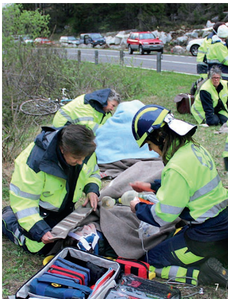
Abbildung 7: Übung des Samaritervereins Guttannen. Der Samariterverein Guttannen entstand im Jahr 1943 und zählt heute 76 Mitglieder, davon 24 aktive. Da der nächste Arzt 9 Kilometer entfernt und die Strasse nach Guttannen im Winter oftmals wegen Lawinengefahr mehrere Tage gesperrt ist, ist der Samariterverein auf allgemeine Notfallsituationen ausgerichtet und stellt sein Material bei Bedarf der Bevölkerung zur Verfügung.

Visp-Eyholz-Baltschieder (beide mit rund 1000 Mitgliedern). Der kleinste Verein ist das Alpentheater Kiental mit 4 Mitgliedern. In diesem Zusammenhang muss allerdings angemerkt werden, dass bisher nicht bei allen Vereinen der Welterbe-Region die Mitgliederzahlen eruiert werden konnten.