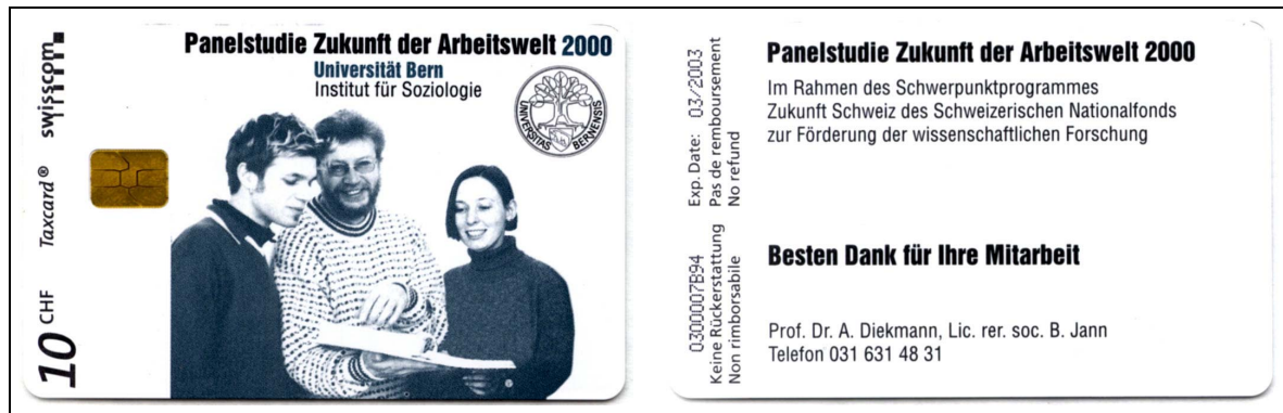
Abbildung 4.1: Telefonkarte mit Projektaufdruck

Das Design unseres Experiments umfasst zwei Versuchgruppen und eine Kontrollgruppe zu je 200 Personen (die Personen wurden den Gruppen nach Zufall zugewiesen). Der ersten Gruppe wurde eine Telefonkarte mit CHF 10.– Gesprächsguthaben und Projektaufdruck (vgl. Abbildung 4.1) versprochen für den Fall, dass der Fragebogen ausgefüllt und zurückgeschickt wird. Bei der zweiten Versuchgruppe war die Telefonkarte dem Fragebogen beigelegt. Den Personen in der Kontrollgruppe wurde kein Geschenk beigelegt und auch keines versprochen. 1