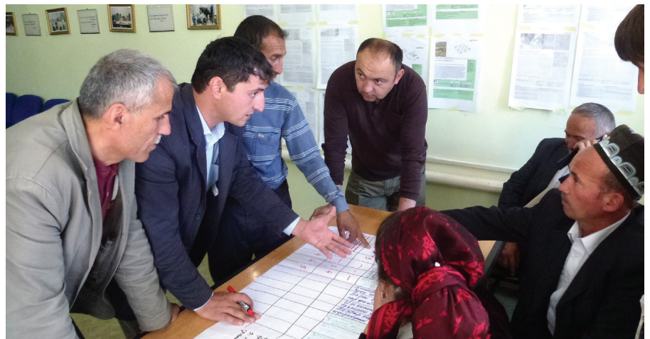
Ҷонибҳои манфиатдор меъёрҳои мувофиқашударо, ки ҷанбаи экологӣ, иқтисодӣ ва иҷтимоӣ доранд мавриди баррасӣ қарор додаанд. Фарм, водии Рашт.

НФҶО Муминобод дар марҳилаи аввали лоиҳаи ИХҶО тарҳрезӣ шуда барои дастгирии амалисозии фаъолиятҳои ИХҶО барои ҳар як соҳаи муайян усулҳои машаххасро пешниҳод мекунанд (ҷадвали 1). Ин усулҳо ба намудҳои мушаххаси моликияти замин ва ҷонибҳои манфиатдори дахлдор равона шудаанд.