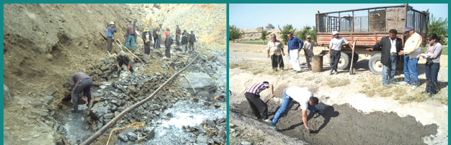
Гузaronидани корҳои техникӣ дар ҷойҳои обёрӣ дар баландихо ва водихо

Дар сурате, ки давлат ягона соҳибмулкӣ захираҳои об маҳсуб мегардад ҷавобгарӣ барои нигоҳдошт ва идораи инфрасохтори об як навъ номуайян менамояд. Ин ба Тоҷикистон ҳам рабт дорад, чи ба системаҳои обёри калон дар водихо ва чи ба системаҳои хурд дар минтақаҳои кӯҳӣ. Дар аксар ҳолат Ассотсиатсияи истифодабарандагони об (АИО) дар водиву баландкӯҳҳо кӯшиш доранд то ҷавобгарӣ барои инфрасохтори харобшударо ба ӯҳдаи худ гиранд. Баҳисобгирӣ ва ё баҳсгузории инфрасохтори об ба таври лозима гузаронида нашуда моликият пурра ба ҳисоби АИО ё ҷомиа гузаронида шуд. Дар натиҷа тақсими вазифаву ӯҳдадорихо номуайян боқӣ монда дар аксар маврид ба ташкилшавии сохторҳои мувозӣ ва ё такрорӣ оварда мерасонад, ки ба кӯшишҳои идоракунии самаранокӣ захираҳои об, алалхусус байни аъзои АИО ва дигар афрод, монеъа эҷод мекунад.