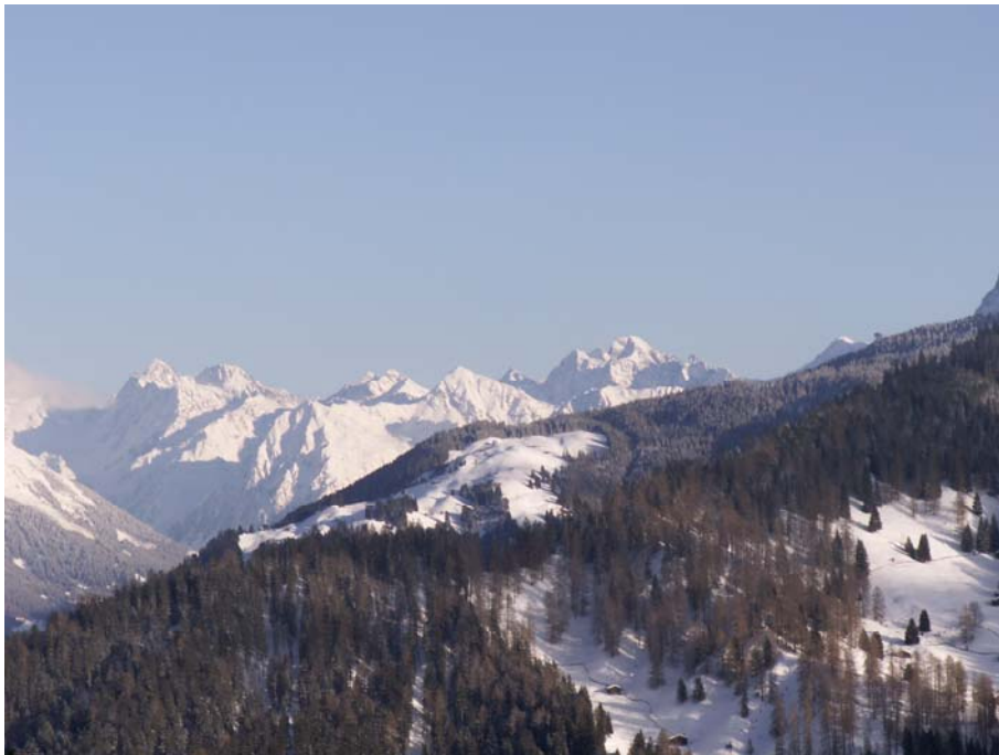
Foto 2 Von Furna aus genießt man den Blick weit über's Prättigau hinweg.

Ziel des Teilprojektes 'lokale Entwicklungsplanung' war es, in drei Gemeinden/Kleinregionen nämlich Sent im Unterengadin, Furna im Prättigau und Budoia (I), unter Einbezug verschiedener Akteure / Stakeholder einen partizipativen Prozess für die lokale Entwicklungsplanung anzuregen und durchzuführen, welcher in einen konkreten Projekt- und Umsetzungsplan mündet. Konzeptionelle und teilweise methodologische Grundlage für diesen Prozess ist das Learning for Sustainability - Konzept des CDE.