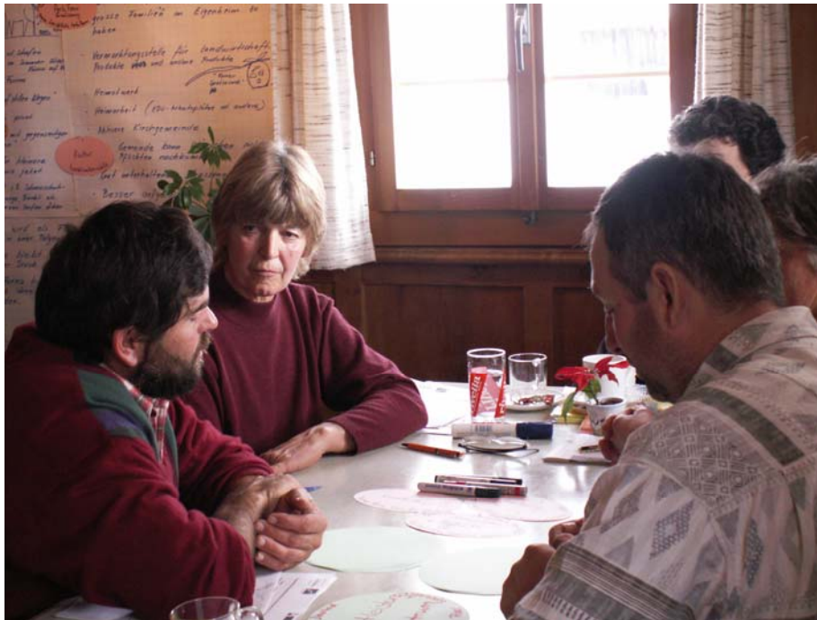
Foto 3 Arbeitsgruppe in Furna: Gemeindepräsident, Bäuerinnen und Handwerker diskutieren über lokales Entwicklungspotential.

In Budoia (I) war niemand seitens des CDE oder des Alpenbüros während der Workshops anwesend, weshalb die Erfahrung nur aus der Perspektive des italienischen Moderators vorliegt.