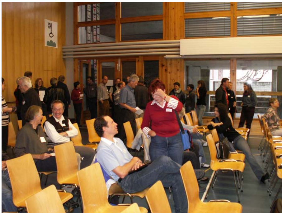
Foto 1 Allein das Schulhaus in Sent hat genügend Raum für die Durchführung der Zukunftswerkstatt mit über 60 Personen.

Diese Anpassung an die spezifischen Gegebenheiten des Alpenraumes erschien von Interesse im Hinblick auf eine mögliche Anwendbarkeit der vom Alpenbüro erarbeiteten Methodologie auf Berggebiete im Rahmen der Ostzusammenarbeit, z.B. im Kaukasus, Südosteuropa und Zentralasien etc. Die NRU / DEZA ermöglichte dem CDE im Rahmen des Backstoppingmandates das Projekt des Alpenbüro zu begleiten und eine Auswertung hinsichtlich der Transferierbarkeit der Methodologie in den Kontext von (europäischen und kaukasischen) Transitionsländern vorzunehmen. Das CDE begleitete in der Folge die Umsetzung / Anwendung der Methodologie in zwei Schweizer Gemeinden (Sent und Furna) in Graubünden, um abzuklären, ob und unter welchen Voraussetzungen der Einsatz der Methodologie im Rahmen der Ost- und Südkontexte sinnvoll ist. Dieser Frage widmet sich diese Auswertung.