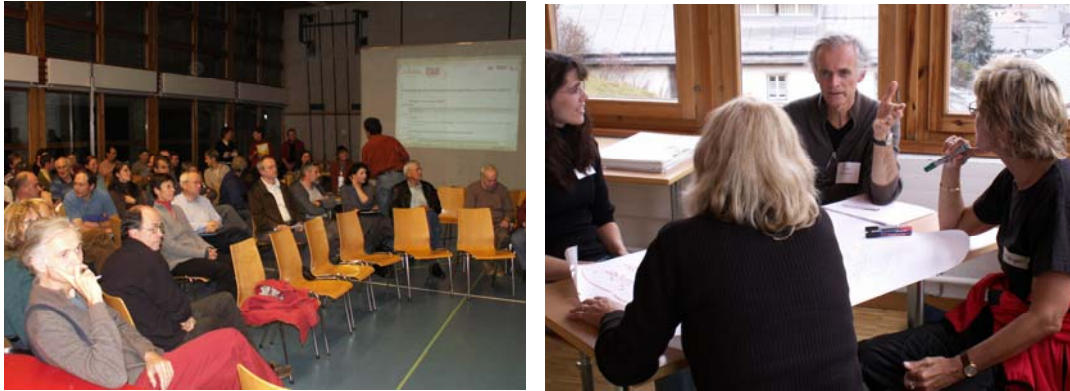
Foto 5 Engagierte Diskussionen im Plenum und den Arbeitsgruppen.