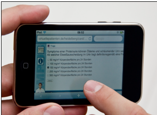
Figure 1: Work-up of a virtual patient on the smart phone

Twice a year, the German Society for Pediatrics and Adolescent Medicine (DGKJ) hosts a revision course offered particularly to pediatric residents. In 2009, this course was hosted at the Center for Pediatrics and Adolescent Medicine Heidelberg, Germany, and one of the authors (DC) was announced for the lecture on nephrotic and nephritic syndrome in children. Two existing VPs on these topics were adapted to the requirements of residency training with the help of experienced specialists and blended with the lecture. The VPs were designed in accordance with published design criteria [17] using CAMPUS software [18]. They were drafted as a wrap-up session of the lecture and were worked-up by around 200 participants in a separate session at the end of the revision course on personal mobile devices via Wi-Fi (see Figure 1). In addition, the VPs were available on the internet for another eight weeks (via http://www.virtuellepatienten.de ).