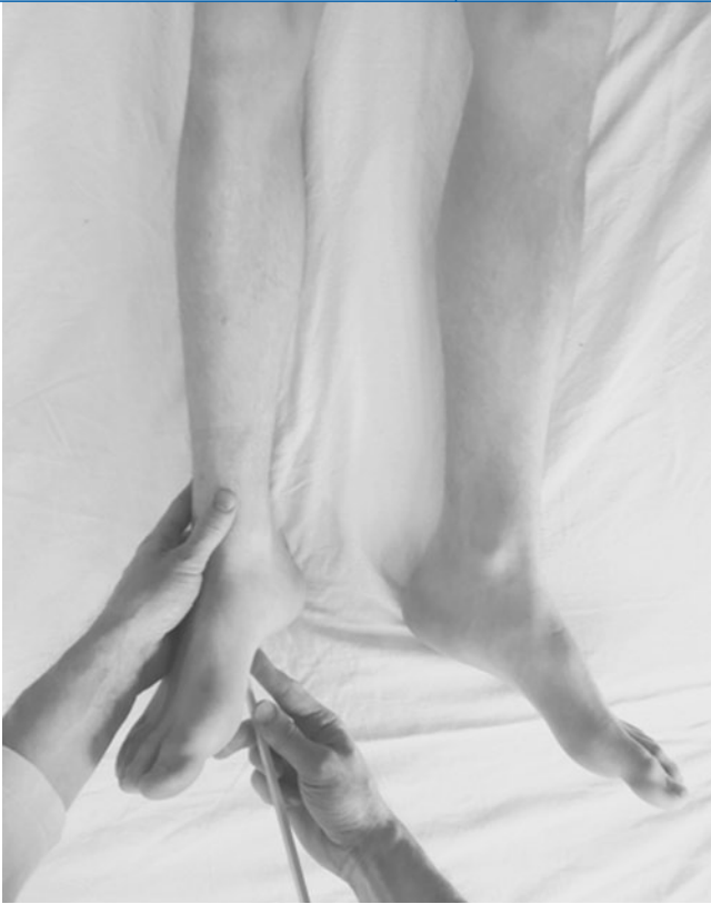
Abb. 2 ▲ Babinski-Test. Auf der schmerzdominanten Seite besteht eine Berührungshypästhesie. Bei der Babinski-Testung findet sich entsprechend auf dieser Seite oft eine stummere Fußsohle. Der Babinski-Test wie auch die Testung der Muskeleigenreflexe sind normal