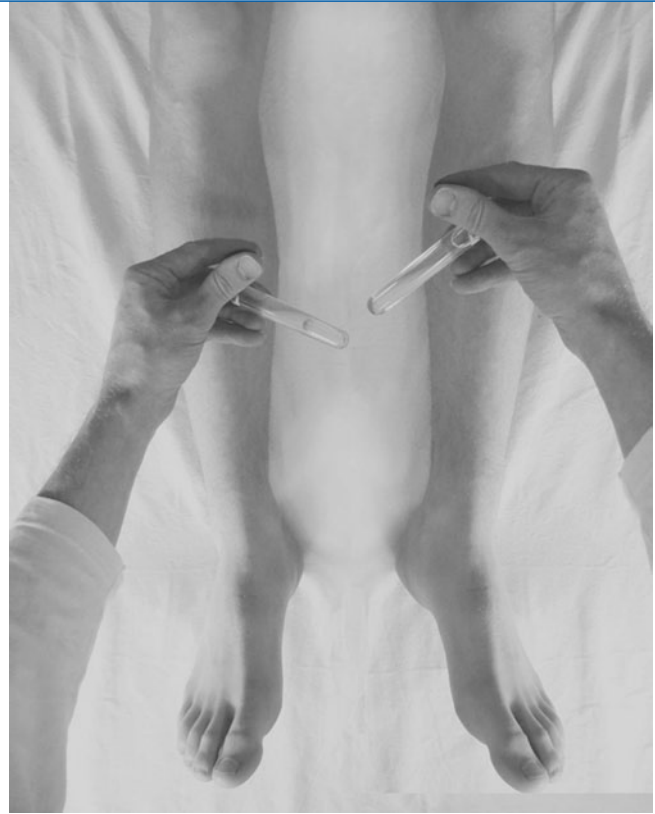
Abb. 3 ▲ Wärmetestung. Die Kunststoffröhrchen sind mit heißem Leitungswasser (etwa 45°C) gefüllt. Bei der symmetrischen Testung findet sich auf der schmerzdominanten Seite eine Thermhypästhesie

Beanspruchung der betroffenen Zonen wird als schmerzverstärkend empfunden. Selbst der eigene Muskelhaltetonus wird bei länger gleich beibehaltener Körperposition zuweilen bereits als schmerzhaft empfunden. Zeichen der langen Bahnen sind nicht festzustellen, jedoch kann sich bei Prüfung des Babinski-Reflexes ipsilateral zur Schmerzstörung häufig eine stummere Fußsohle (■ Abb. 2 ) zeigen.