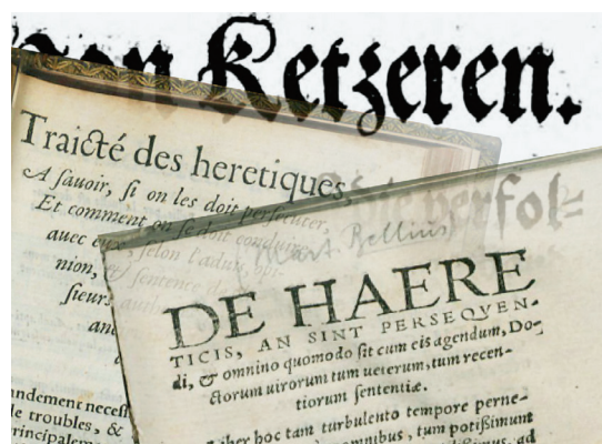
Brief Sebastian Castellios in seiner «Humanistenhandschrift» an Felix Platter von 1556 (links) sowie Titelblätter seiner Schriften zu Ketzern.

(Abb. links: © Brief Sebastian Castellios an Felix Platter, 29. Juli 1556, Handschriftenabt. der UB Basel: Frey-Gryn Mscr. II 9, Br. 99.