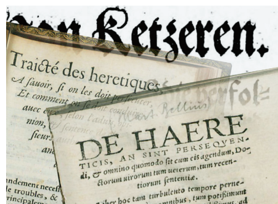
Brief Sebastian Castellios in seiner «Humanistenhandschrift» an Felix Platter von 1556 (links) sowie Titelblätter seiner Schriften zu Ketzern.

(Abb. links: © Brief Sebastian Castellios an Felix Platter, 29. Juli 1556, Handschriftenabt. der UB Basel: Frey-Gryn Mscr. II 9, Br. 99.