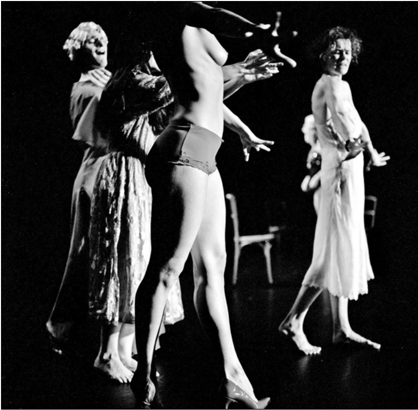
Abbildung 5: Mimésix (2005) von Foofwa d'Imobilité und Thomas Lebrun.

Das Publikum von Mimésix ist also massgeblich an der Erstellung der behaupteten »Plagiate« mit beteiligt, denn auch wenn die Posen nicht zugeordnet werden können, schwingt das Spiel mit den Referenzen doch stets mit. Zu den Bildern, die von Rosas danst Rosas im kulturellen Gedächtnis schon bestehen, fügen sich somit weitere hinzu. Dasselbe gilt für die nächste Szene. Stéphane Imbert malt mit schwarzer Kreide einen Kringel um seinen Bauchnabel und schreibt dazu: »MOI«. Eine Referenz an Jérôme Bel und seine gleichnamige Performance Jérôme Bel aus dem Jahr 1995. Seine Performer beschrieben darin ihre nackte Haut wie Palimpseste als Körper-Texte und stellten den Körper so als diskursive Konstrukte aus. In Mimésix wiederum endet die kurze Szene in einer Siegerpose: The Show must go on (2001) von The Queen ertönt und der Tänzer steckt die Kreide in den Mund und die Faust in die Höhe. Der Liedtitel ist der Name von Jérôme Bels wohl berühmtester Arbeit, in der Popsongs buchstäblich in Bewegung und Mimik umgesetzt und als Bewegungen des