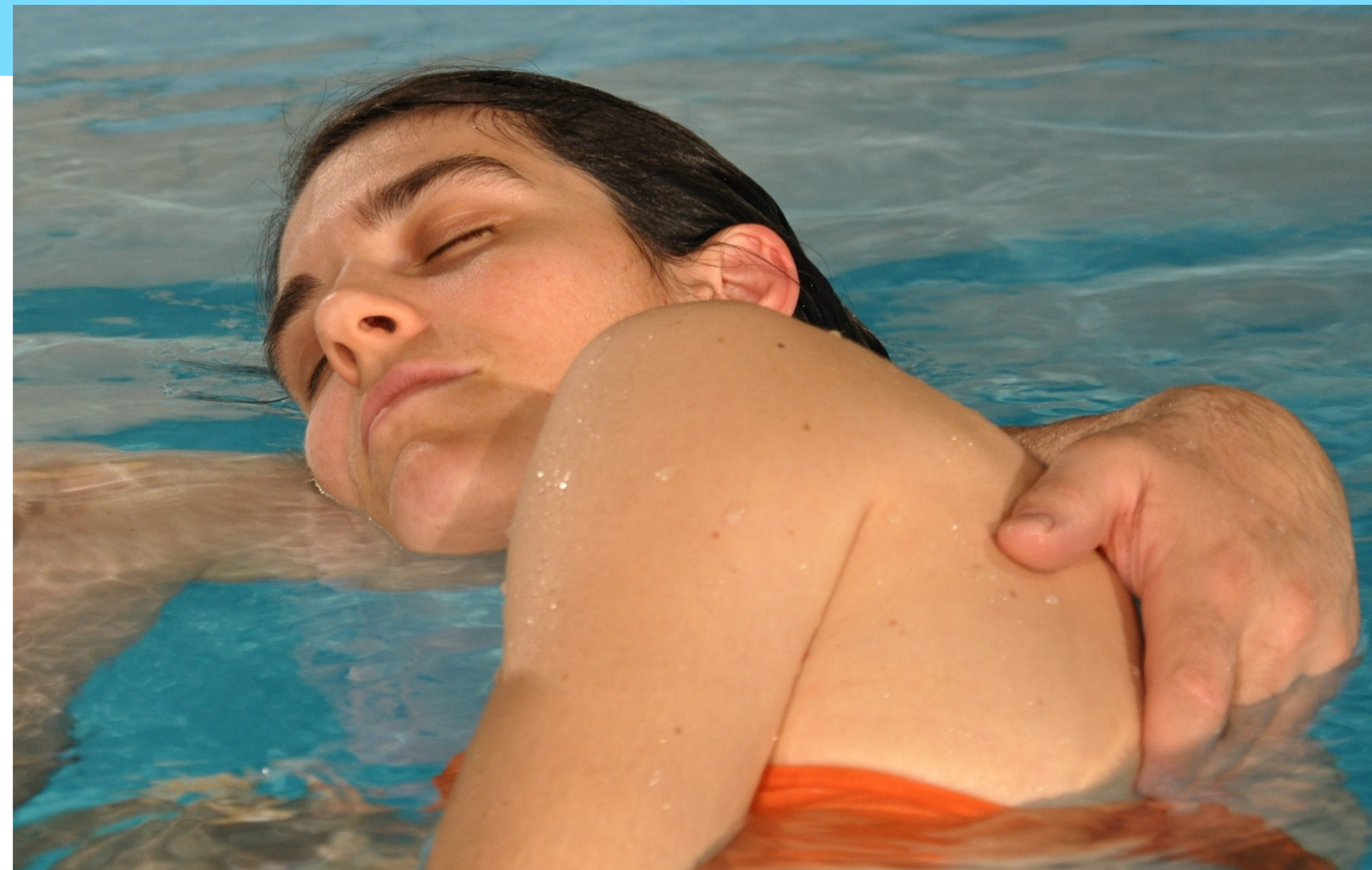
Fig. 1: WATSU: Massage in 35° C warmem Wasser.

Die Patientin ergänzte ihre ambulante Rehabilitation selbständig um sechs WATSU-Sitzungen (1x pro Woche, beginnend 7 Wochen nach dem Unfall). Sie führte während dieser Zeit ein Tagebuch über ihre Therapieerfahrung, welches sie später zur wissenschaftlichen Auswertung zur Verfügung stellte. Diese erfolgte nach dem Triangulationsmodell nach Mayring [3].