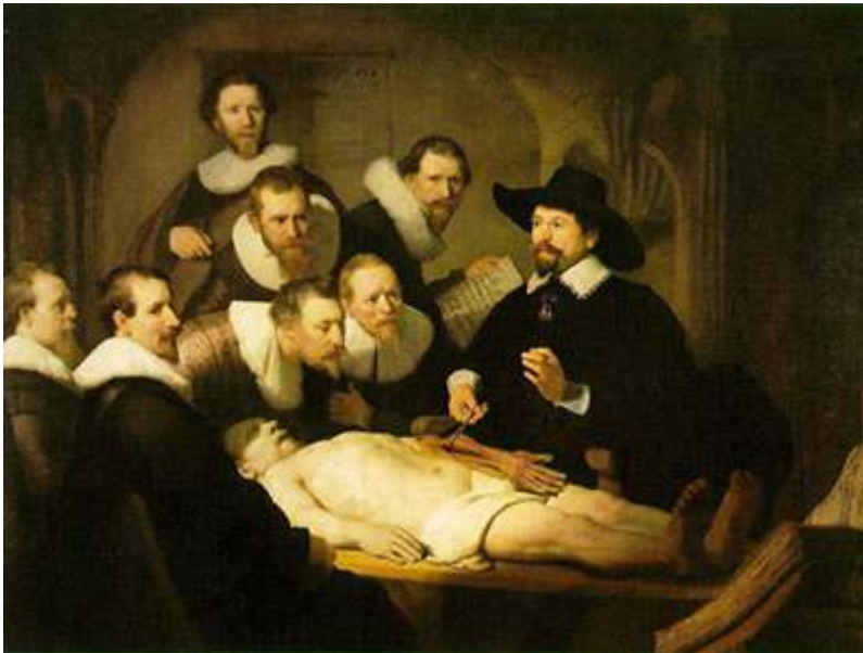
Rembrandt, La Leçon d'anatomie du professeur Tulp , huile sur toile 162x216, Mauritshuis, La Haye.