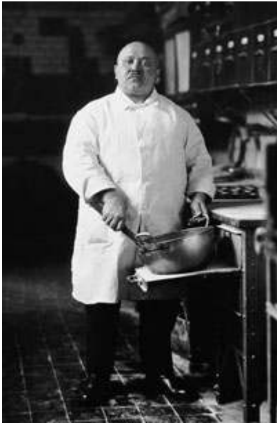
August Sander, « Le pâtissier », Visage d'une époque (Das Antlitz der Zeit) , 1928.