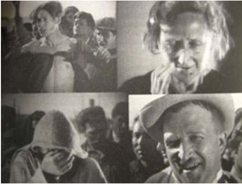
Sergueï Eisenstein, Le Cuirassé Potemkine , 1925.