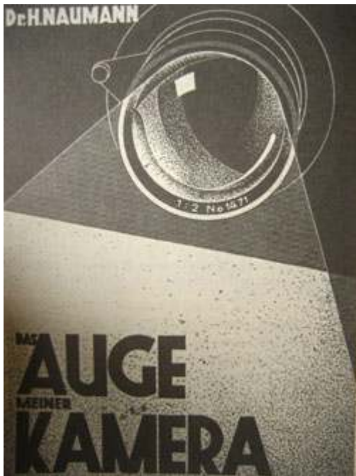
Helmut Neumann, L'Œil de ma caméra ( Das Auge meiner Kamera. Eine Buch über fotografische Optik ), Halle/Saale, 1937.