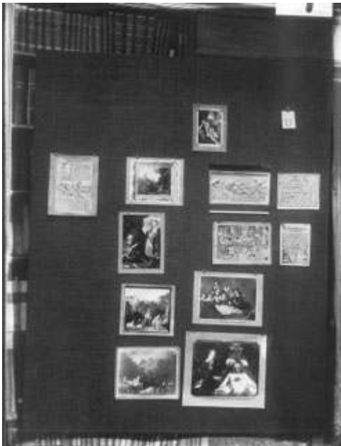
Aby Warburg, Der Bilderatlas Mnemosyne , planche 75.