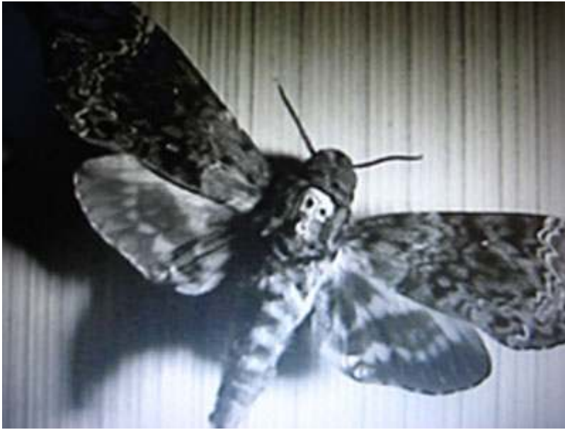
Luis Buñuel et Salvador Dali, Un chien andalou , 1929.