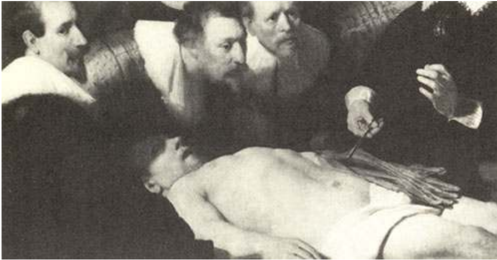
Détail de Rembrandt, La Leçon d'anatomie du professeur Tulp , in W. G. Sebald, Les Anneaux de Saturne , p. 30.