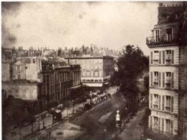
W. H. F. Talbot, « Paris, vue sur les boulevard », Planche II, Le Pinceau de la nature (The Pencil of Nature) , 1844.