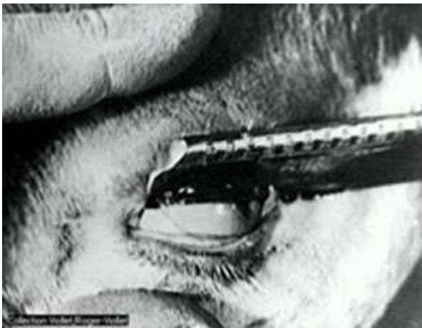
Luis Buñuel et Salvador Dalí, Un chien andalou , 1929.