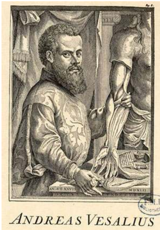
André Vésale, frontispice intérieur de l'ouvrage De corporis humani fabrica libri septem , 1543.