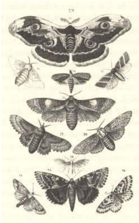
W. G. Sebald, Les Anneaux de Saturne , p. 355