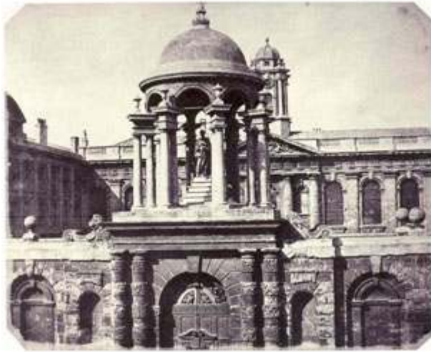
W. H. F. Talbot, « Le portail d'entrée de Queen's College », Planche XIII, Le Pinceau de la nature (The Pencil of Nature) , 1844.